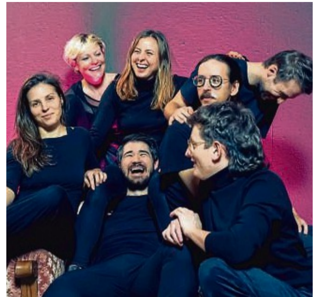
Das Freiburger Sprechtheater-Ensemble Laut & Lyrik ist am 10. und 11. Februar im Bad Arolser BAC-Theater zu Gast.

„Denn bleiben ist nirgends“, hat Rainer Maria Rilke einmal geschrieben, die Veränderung, der ewige Wandel sind Themen, die