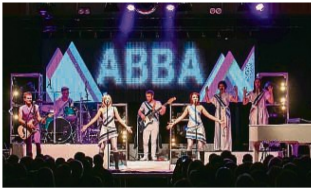
Ein ABBA Tribute Konzert ist am 11. März in Mengeringhausen zu hören.

Die vier Schweden Agnetha Fältskog, Anni-Frid Lyngstad, Björn Ulvaeus und Benny Andersson haben der Welt ein fantastisches musikalisches Gesamtwerk geschenkt. ABBA ist es gelungen, vier Generationen an Fans und Musikliebhabern zu fesseln und zu begeistern. Mit „Waterloo“ eroberten die vier Schweden die weltweiten Charts und die Herzen der Menschen im Sturm. Der Sieg beim Grand Prix 1974 machte ABBA über Nacht zur bekanntesten Popband dieser Zeit. Es folgten Hits wie „Mamma Mia“, „SOS“, „Super Trouper“, „Knowing Me, Knowing You“, „Chiquitita“, „Money