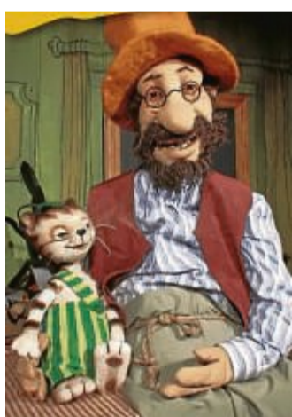
Kinderaufführung: Das Theater Con Cuore aus Schlitz spielt „Wie Findus zu Pettersson kam“.