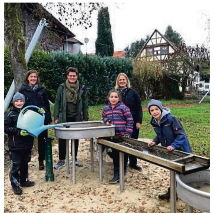
Die Wasserspielanlage am Dorfplatz in Schlierbach wurde mit Geld aus dem Regionalbudget 2022 gebaut.

Gefördert werden Vorhaben in den Bereichen Kultur, Versorgung, Bildung, Freizeit, Naherholung und nachhaltiges Handeln. Auch Projekte, die Treffpunkte schaffen oder einen Ortskern stärken möchten, sind förderbe-