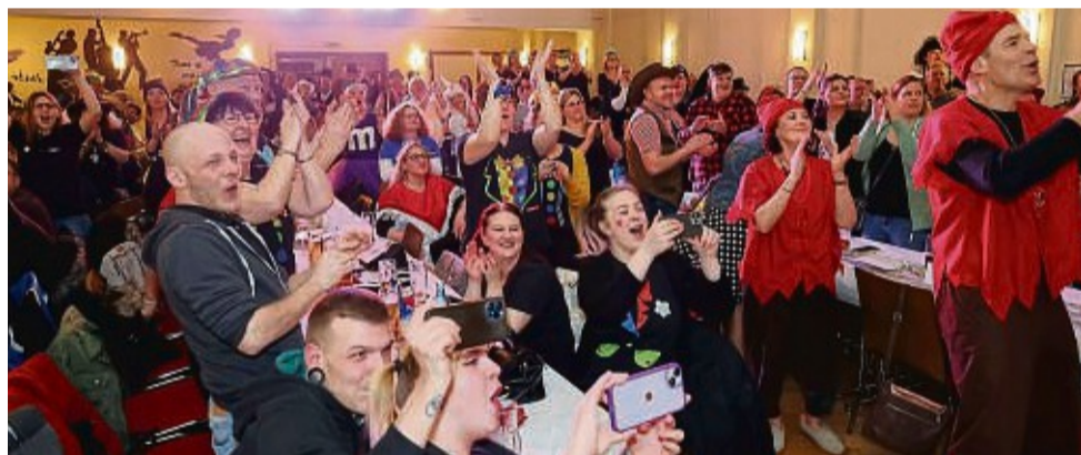
Tosenden Applaus gab es für das Männerballett, das ordentlich für Stimmung sorgte.

wurde die Närrische 11 an diesem stimmungsvollen Abend durch die Kolpingnarren aus Zierenberg, den No-Name-Dancern aus Fritzlar und den Fußballdamen des SV Anraff.