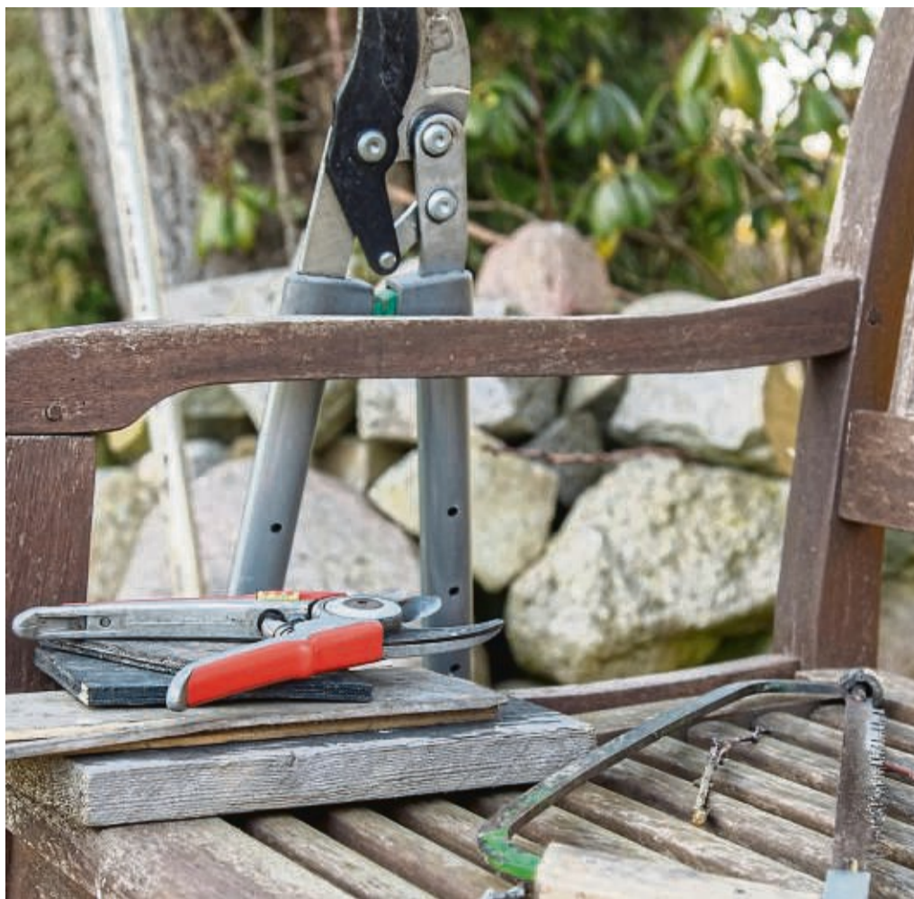
Kein Wachstum ohne Entfernen: Schnittwerkzeuge gehören zur Ausrüstung eines Hobbygärtners.

Hansjörg Haas empfiehlt Handscheren mit nach innen