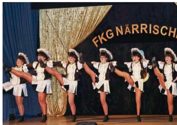
Die Seniorsgarde zeigte beim Marschtanz ihr Können.

◀ Das Damenballett nahm das Fritzlarer Publikum mit auf eine „Reise nach Venedig“.