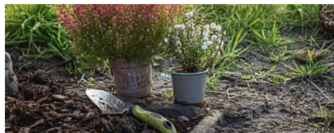
Bald geht es wieder los: Die Pflanzsaison braucht auch gute Werkzeuge, zum Einsetzen des neuen Gartengrüns.