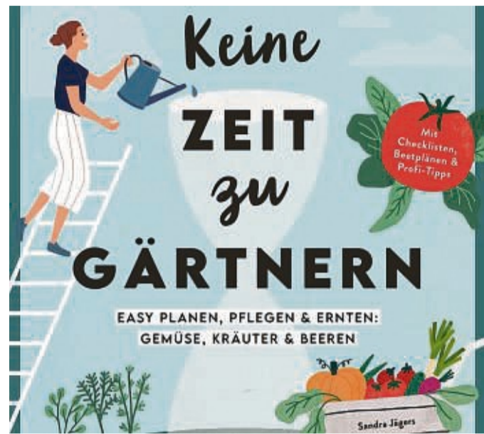
Tipp: „Keine Zeit zu Gärtnern. Easy planen, pflegen und ernten: Gemüse, Kräuter & Beeren.“

Anders als Scherenklingen können die Sägeblätter nicht nachgefeilt werden. Der Baumschulgärtner rät daher zu Qualitätsmarken. „Sehr billige Sägen sind schnell