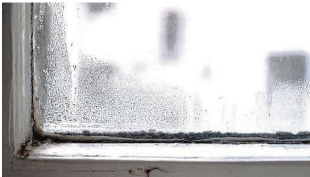
Ein Bild, wie man es gerade in vielen Wohnungen vorfindet: Wo viel Feuchtigkeit ist, wächst Schimmel gut.