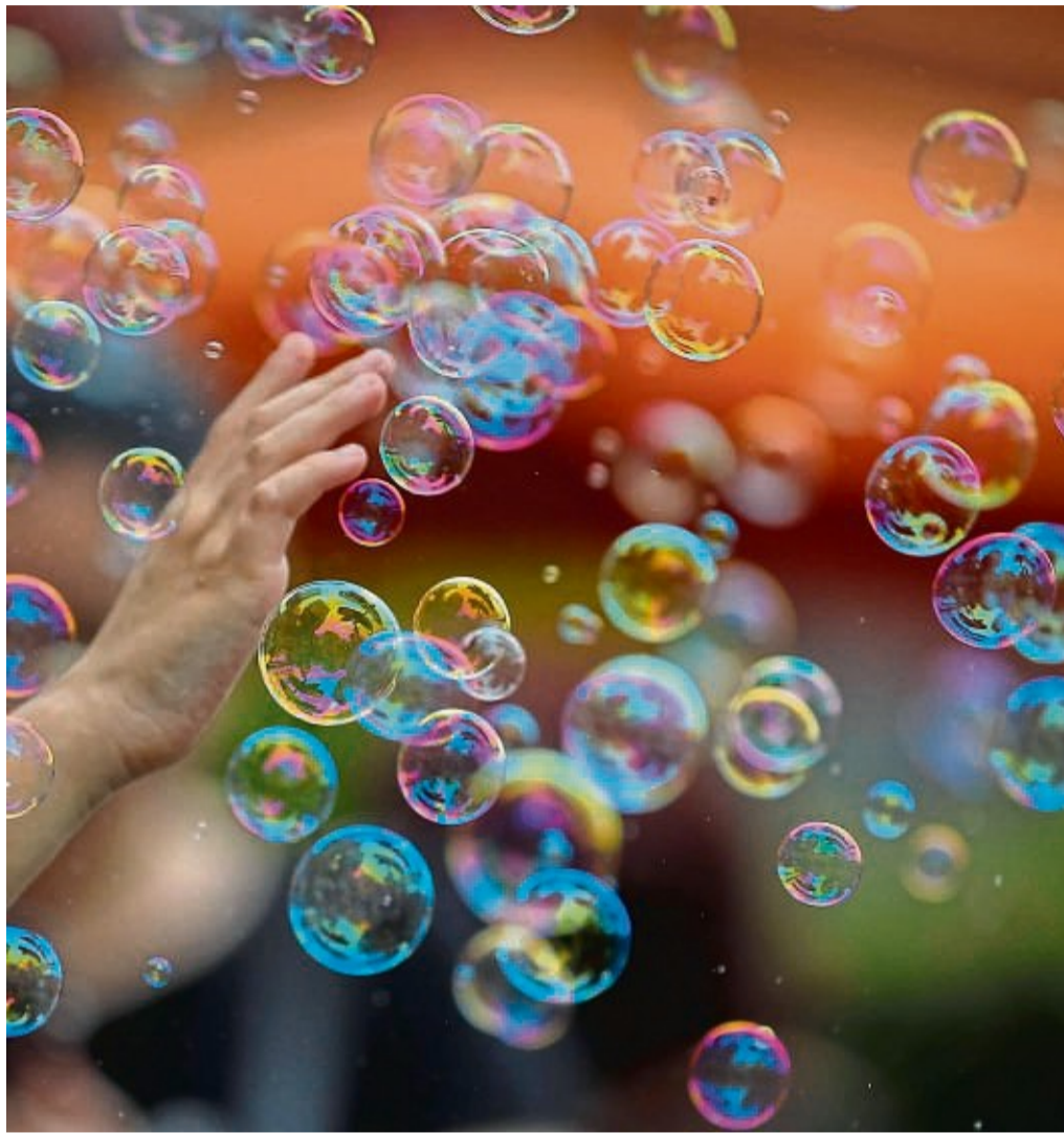
Verträglicher für Mensch, Tier und Umwelt als bunte Luftballons: Seifenblasen sind bei Feiern gut geeignet.

Doch es gibt alternative Ideen. Kinder könnten etwa Seifenblasen oder Drachen in