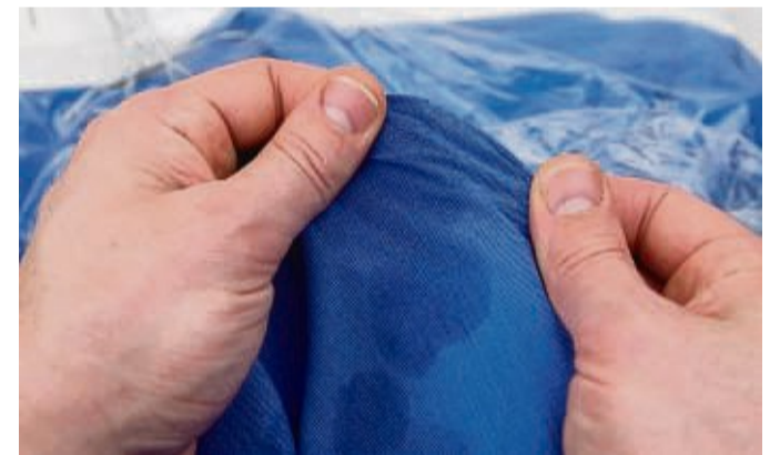
Das passiert! Aber man sollte Flecken nicht eintrocknen lassen, sondern schnell behandeln.

Alle schmutzigen Stücke sollten nach dem Erste-Hilfe-Einsatz wie gewohnt gewaschen werden. Eventuell verbleibende Fleckenreste packt dann im besten Fall die Waschmaschine. tmn