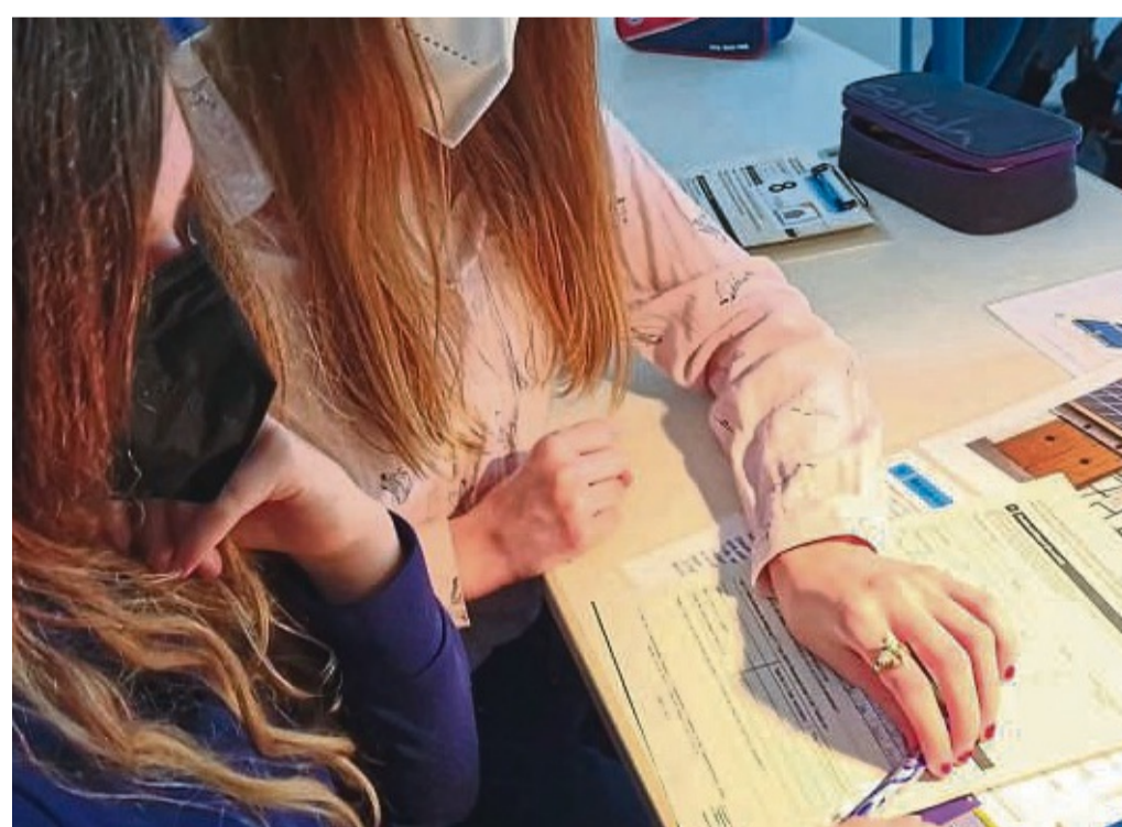
Themen rund um das Klima spielerisch entdecken: Unser Bild zeigt die Klimawerkstatt an der Eschweger Brüder-Grimm-Schule.

„Ein weiteres tolles Klimabildungsprojekt kommt aus dem „Schuljahr der Nachhaltigkeit“, das wir aufgrund un-