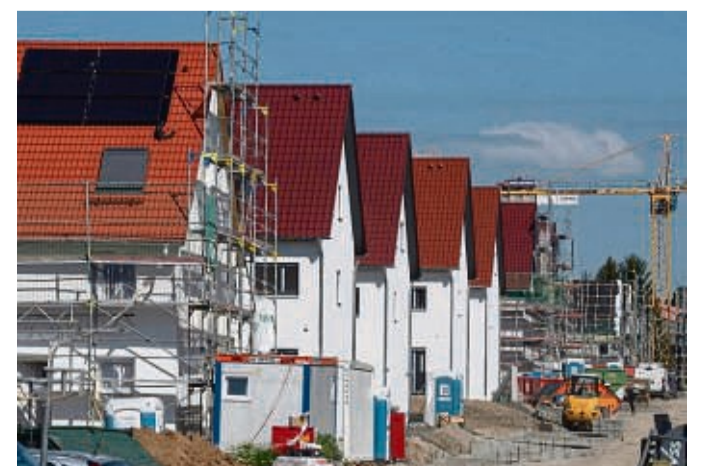
Beim Hausbau kommt es oft auf jeden Euro an: Skontovereinbarungen können Rechnungssummen drücken.

Was man unbedingt beachten sollte: Sofern nichts anderes vereinbart ist, gilt für die Gewährung des Skontos der Zeitpunkt des Zahlungseingangs auf dem Konto der beauftragten Bau- oder Handwerksfirma, nicht der Zeitpunkt der Zahlung. Je nach Finanzinstitut können zwischen diesen beiden Zeitpunkten bis zu drei Tagen liegen. Auftraggeber sollten das einkalkulieren. tmn