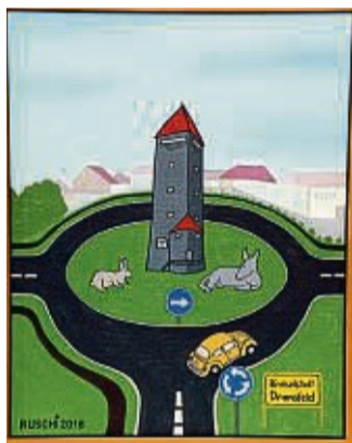
Kreiselsstadt Dransfeld: Ruschinskis humorvoller Vorschlag für die Gestaltung des Kreisels.

Margueritenweg 5 37213 Witzenhausen 05542 999182 0170 2101959 lipnik@t-online.de