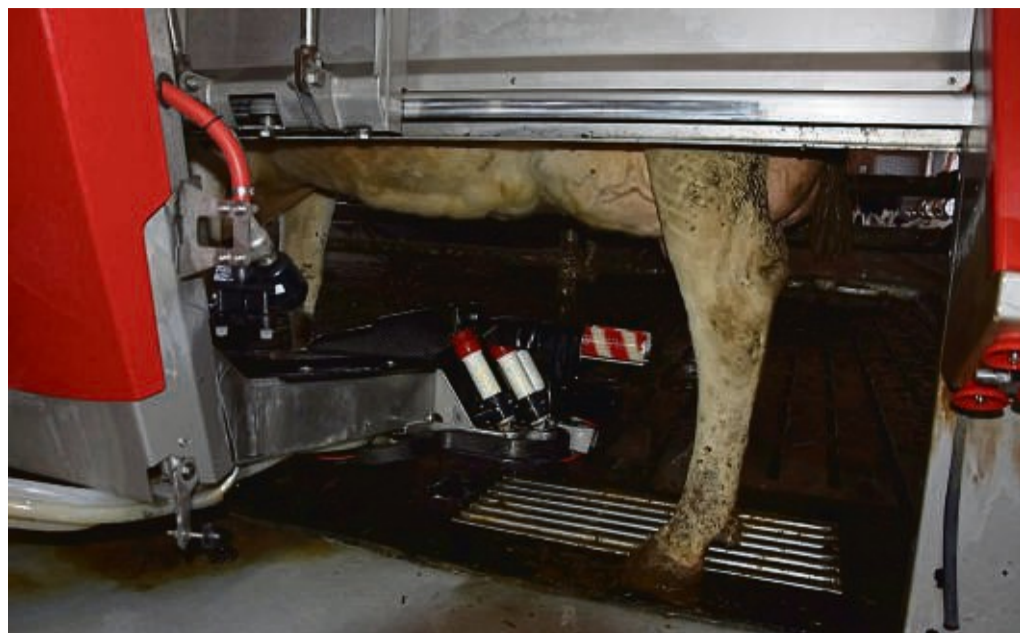
Beim automatischen Melken übernimmt die Maschine die Arbeitsschritte. Bis zu viermal am Tag kommen manche Kühe eigenständig zum Melken.