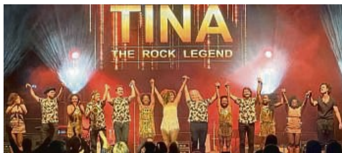
Tribute-Show: „Tina – The Rock Legend“ macht am Mittwoch, 15. März, um 19.30 Uhr in der Stadthalle in Korbach Station.

Die Show lässt das Leben und die Karriere der Powerfrau mit der markanten Stimme und der unverwechselbaren Löwenmähne Revue passieren. Hits wie „Simply The Best“, „Private Dancer“, „Typical Male“ oder „Golden Eye“ prägen auch „Tina – The