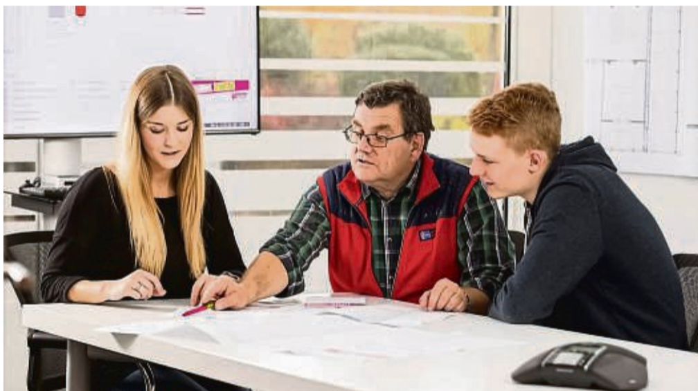
Die Ausbildung bei Veltum ist praxisbezogen und wird stets von engagierten Ausbildern begleitet.