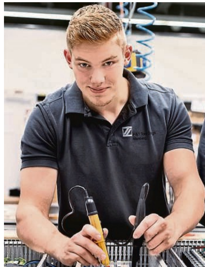
Die Heitkamp & Thumann Group in Marsberg ist ein beliebter Ausbildungsbetrieb.