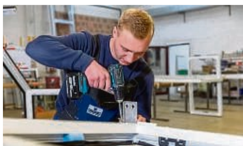
Präzision will gelernt sein – beim Handwerk...

Das Metallbauunternehmen Pistorius Türen- und Fensterbau GmbH aus Vasbeck fertigt Aluminiumelemente: Fenster, Türen, Fassaden, Wintergärten, Insektenschutz, Brand- und Rauchschutztüren. Durch die Fertigung im eigenen Haus kann Pistorius bei der Produktion gezielt auf Kundenwünsche eingehen. Da das Metallbauunternehmen in ganz Deutschland tätig ist, steht ihnen der Kundendienstservice auch nach Beendigung der Arbeiten zur Verfügung. Zum nächsten Ausbildungsstart bietet Pistorius freie Plätze für den Beruf Metallbauer/in in Fachrichtung Konstruktionstechnik (m/w/d). Die Tätigkeit ist abwechslungsreich, mit vielen spannenden, aufregenden und neuen Aufgaben. Die Azubis produzieren in der firmeneigenen Werkstatt und fahren mit auf die Baustelle, um die Elemente zu montieren. Nach der Aus-