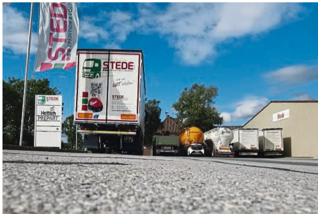
Logistik – warum nicht? Stede in Lichtenfels und Mengeringhausen hat aktuell noch Ausbildungsstellen frei.