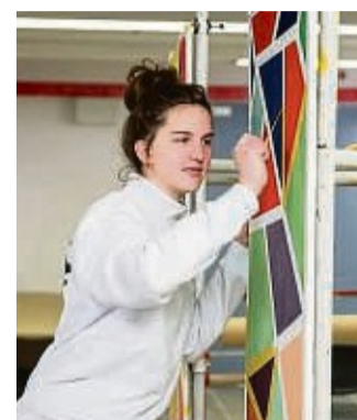
Kreativität und Spaß sind wichtige Bestandteile der Ausbildung im Malerbetrieb Göbel. Die Dauer der Ausbildung kann sogar auf 1,5 Jahre verkürzt werden.

Zum neuen Ausbildungsjahr sucht der Malerbetrieb Göbel noch Verstärkung. Wer auf der Suche nach einem handfesten Beruf mit familiärem Team und echten Weiterentwicklungsmöglichkeiten ist, sollte die Gelegenheit nutzen und sich jetzt schnell bewerben. Und wenn