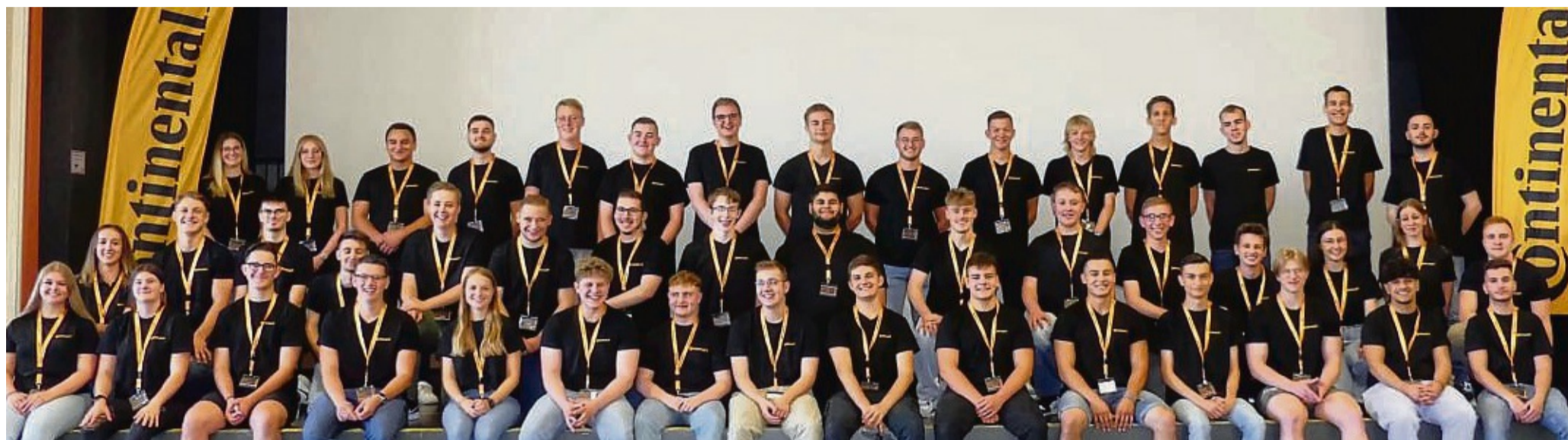
Die Auszubildenden bei Continental in Korbach nutzen die vielfältigen Möglichkeiten für ihren erfolgreichen Berufsstart.

Karriere ins Rollen bringen – Ausbildung bei Continental bietet gute Perspektiven