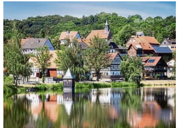
Da arbeiten, wo andere Urlaub machen ist das Motto des „Unternehmens Stadt Waldeck“.

Die Standortfaktoren und Vorteile der Nationalparkstadt Waldeck als Arbeitgeber wurden bereits von zahlreichen Mitarbeiterinnen und Mitarbeitern in verschiedensten Bereichen erkannt, die bei der Nationalparkstadt Waldeck ihren beruflichen Lebensmittelpunkt gefunden haben. Ganz gleich ob Verwaltung, Kindertagesstätten, Touristikbüro, Baubetriebshof, Wasserwerk, oder Abwasserbeseitigung - die Nationalparkstadt Waldeck bietet mittlerweile fast 100 krisensichere und dauerhafte Arbeitsplätze in unterschiedlichen Berufszweigen an. Verwaltungsfachleute,