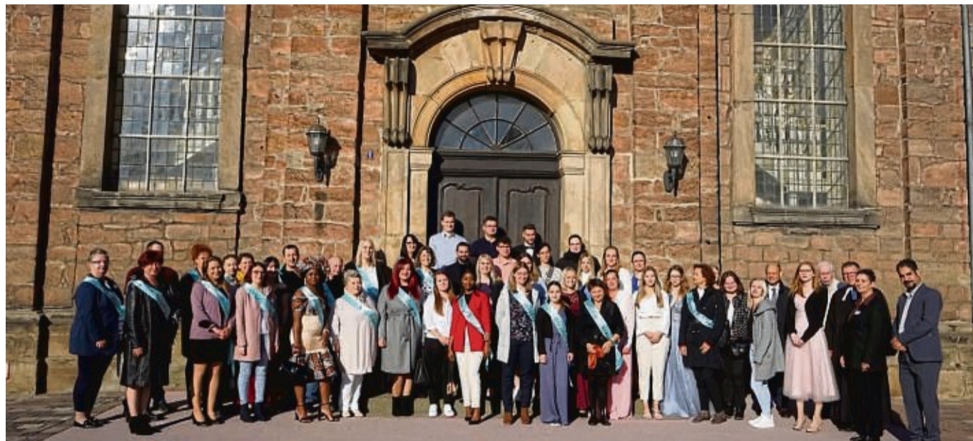
Den erfolgreichen Abschluss feiern jedes Jahr zahlreiche Auszubildende des DIAKO Bildungszentrums Emma und Karl Hübel.

Wir informieren über offene Ausbildungsstellen