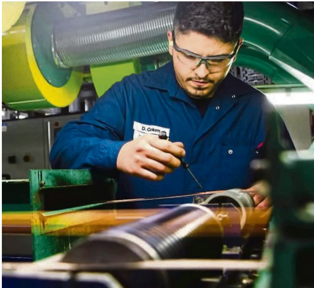
Die Essex Furukawa Magnet Wire GmbH sucht für den Standort Bad Arolsen Auszubildende in verschiedenen Unternehmenszweigen.

www.essexfurukawa.de E-Mail: bewerbungen@essexfurukawa.com