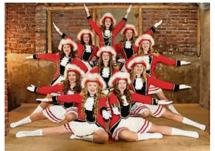
Die Funkgarde 2023 der Karnevalisten „Rot-Weiß“ Medebach.

dem Programm. Zur Weiberfastnacht besuchen die Karnevalisten morgens die Hansegrundschule und die beiden Medebacher Kindergärten, bevor abends die große Fastnachtsparty ab 20.11 Uhr in der Schützenhalle viel Vergnügen verspricht. In diesem Jahr steht erstmals die Partyband „Tante Käthe“ aus Köln auf der Bühne. Büttreden, Showtänze, Sketche und vieles mehr erwartet die Gäste der Großen Narrensitzung am 18. Februar. Die Karnevalisten von „Rot-Weiß“ mit ihren drei Garden laden an dem Samstag ab 19.31 Uhr ins Kolpinghaus Medebach ein. Eintrittskarten für diese Sitzung und die Party-Sitzung sind noch bei der Touristik GmbH am Marktplatz in Medebach erhältlich. Höhepunkt und Abschluss der Session ist dann der Rosenmontagszug am 20. Februar. Start ist um 14.11 Uhr am Kolpinghaus, nach dem Sturm auf das Rat-