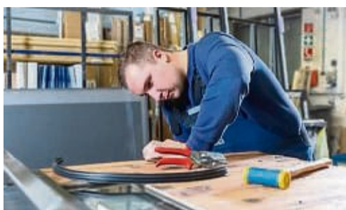
...mit Spaß und Knowhow.