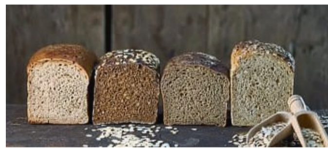
Die Willinger Bäckerei Schumann ist nicht nur für leckere Brote und Backwaren bekannt, sondern auch für gute Ausbildung.

Göbel GmbH & Co. KG Wildunger Landstraße 19 34477 Twistetal-Elleringhausen Telefon 05695 99119-0 E-Mail bewerbungen@maler-goebel.de www.maler-goebel.de