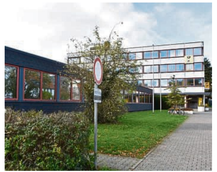
Soll abgerissen werden: Das Postverteilzentrum (vorne) und das mehrstöckige Gebäude, in dem die Postfiliale samt Postbank derzeit noch untergebracht sind, sollen für den Bau einer Seniorenresidenz weichen.