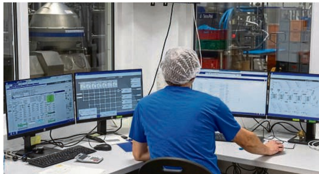
Die Upländer Bauernmolkerei bildet in den Berufen Milchtechnologe und milchwirtschaftlicher Laborant aus.

Wer sich mit Begeisterung für eine nachhaltige Zukunft einsetzen und dabei mit neuester Technik arbeiten möchte, ist bei der Upländer Bauernmolkerei genau richtig. Für die Berufe Milchtechnologe und milchwirtschaftlicher Laborant bietet die Molkerei interessante Ausbildungsplätze an. Die Auszubildenden arbeiten in dem neuen hochmodernen Produktionsgebäude direkt am Produkt. In einem jungen engagierten Team sorgen sie dafür, dass aus der Milch, die in den Milchtankwagen von den Höfen aus der Region angeliefert wird, die leckeren Upländer Bio-Milchprodukte hergestellt werden. Ihre tägliche Aufgabe ist es, die Arbeitsprozesse und Hygienevorschriften zu überwachen und den Herstellungsprozess sowie die Qualität der hochwertigen Bio-Milchprodukte zu kontrollieren. Die Ausbildung