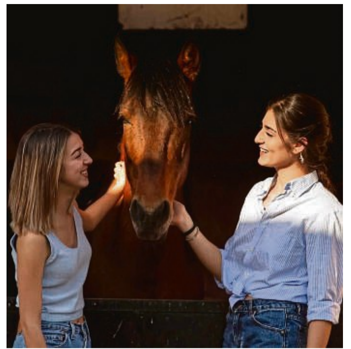
Was ist uns bei einem Pferd wichtig? Will man sich zu zweit ein Tier anschaffen, sollte man diese Frage vorab klären.

Ihrer Erfahrung nach hört beim Thema Pferd die Sachlichkeit rasch auf, zu sehr spricht es die Emotionen an. „Man kann die Uhr danach stellen, bis einer anfängt zu motzen, weil der andere an-