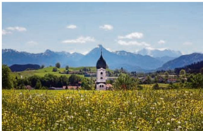
Nesselwang ist auch als Aussichtsterrasse des Allgäus bekannt.