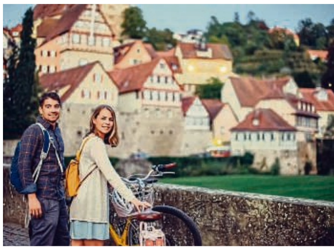
Die ehemalige Reichsstadt Schwäbisch Hall lädt zu einem kurzweiligen Zwischenstopp ein.

Deutlich unkomplizierter als ein gemeinsamer Pferdekauf ist eine Reitbeteiligung. Dabei gehört das Tier nur einem Menschen, der andere darf es gegen ein Entgelt nutzen. „Der Vorteil ist, dass nur einer das Sagen hat und beide schnell wieder aus der Sache raus können, wenn es nicht funktioniert“, so Hlauscheck. tmn