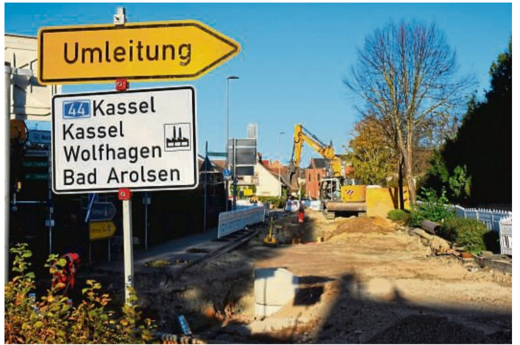
Zwei Jahre Dauerbaustelle in der Warburger Straße Volkmarsen: In mehreren Bauabschnitten erfolgt hier eine grundlegende Erneuerung der Fahrbahn. In die offene Straße lassen die Kommunalbetriebe Nordwaldeck neue Kanal- und Wasserleitungen legen.

In den Ortsdurchfahrten würden in Abstimmung mit den Rathäusern meist gleichzeitig Kanal- und Wasserleitungen mit erneuert, was unterm Strich auch öffentliche Mittel einsparen helfe. Nicht wegzudiskutieren sei aber, dass das Straßennetz nur ei-