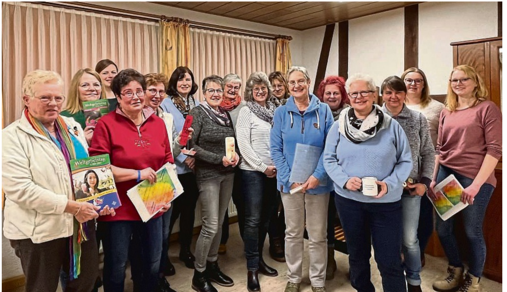
Gemeinsame Planung: Den Gottesdienst zum Weltgebetstag für das Upland bereiten derzeit zahlreiche Frauen im Eimelroder Dorfgemeinschaftshaus vor.

In diesem Jahr haben Christinnen aus Taiwan die gemeinsame Liturgie vorbereitet und lassen dadurch die ganze Welt an ihren Traditionen und kulturellem Leben teilhaben. Der Weltgebetstag 2023 steht unter dem Motto „Glaube bewegt“. Bilden die christlichen Frauen in Taiwan nur einen geringen Anteil im Vergleich zu den anderen Religionen, so geht von