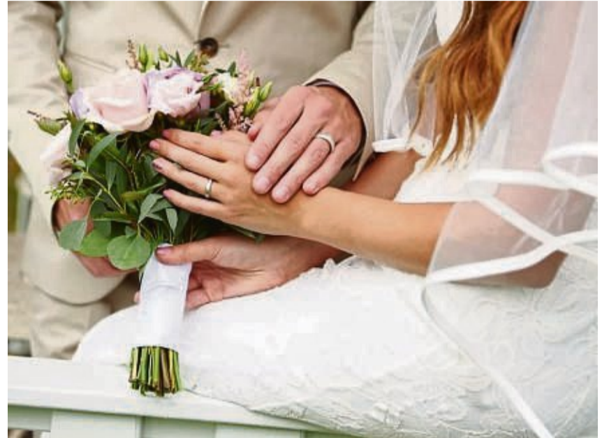
Bei der Materialwahl gibt es für Trauringe viele Möglichkeiten.

Trauringe aus Gold gibt es streng genommen gar nicht. So wie es in der Natur vorkommt, ist das Material nämlich viel zu weich für die Ver-