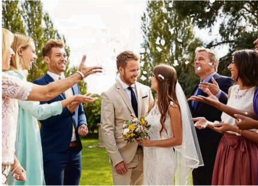
Während des schönsten Tags im Leben spielen die Trauringe eine wichtige Rolle. Für die perfekten Schmuckstücke gibt es im Vorfeld einiges zu beachten.

Diese Fragen sollte man vor der Entscheidung beantworten: Passt der Ehering zum Verlobungsring? Welches Material ist für den individuellen Alltag am besten geeignet? Wenn beispielsweise einer der Ehepartner in der freien Natur arbeitet, sind robuste Eheringe besonders wichtig. Welcher Stil wird mir vermutlich noch lange gut gefallen? Inspiration können hier aktuelle Trauringe-Trends liefern. Welche Qualitätsansprüche bestehen an den Trauringen? Unter Umständen müssen diese mit dem zur Verfügung stehenden Budget abgewogen werden.