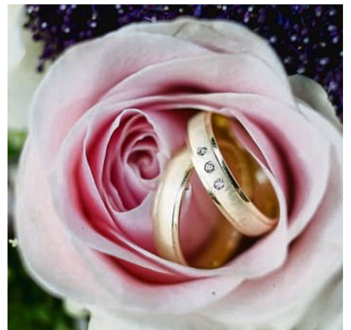
Schlichte Designs sind bei Trauringen nach wie vor am meisten gefragt. Für eine individuelle Optik sorgen Akzente wie Mattierungen oder Edelsteine.