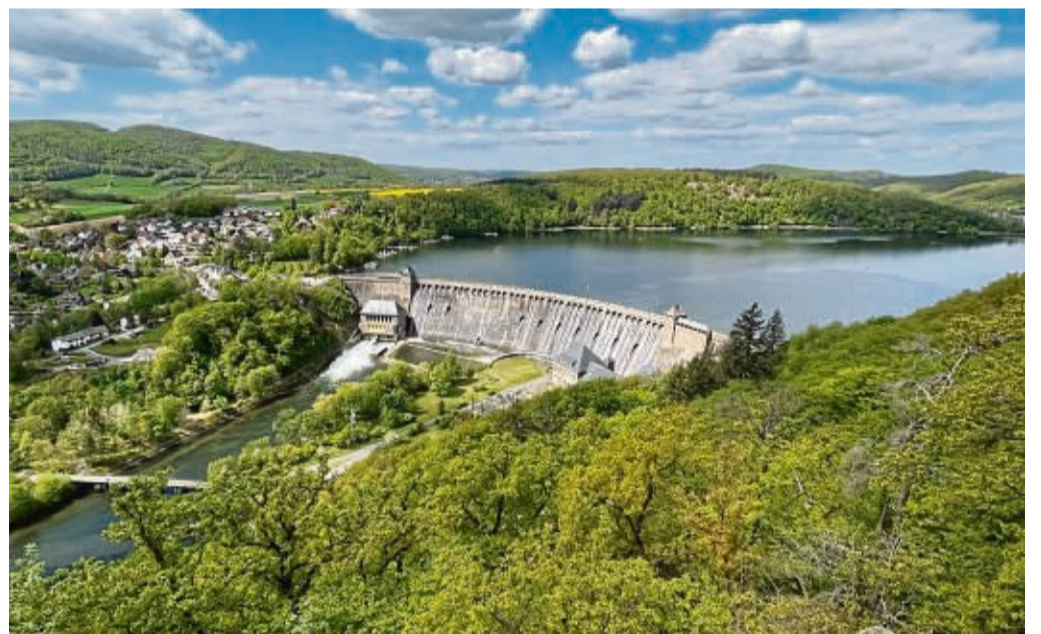
Der Edersee als Marke: Die zielgerichtete Weiterentwicklung und das neu gestaltete Logo sollen die Region noch bekannter werden lassen.

Die Vision: die Dachmarke Edersee ist ein Vorbild für touristische Kooperationsmarken. Der Anspruch dahinter: dass die Marke mit ihrer Arbeit die höchste Zustimmung und Vertriebsfolge bei den Leistungsträgern erreicht. Auch eine Charta wurde verfasst. Darin verpflichtet sich das Edersee Marketing unter anderem, die Bekanntheit der Region zu steigern und die Leistungsträger bei Marketingaktivität-