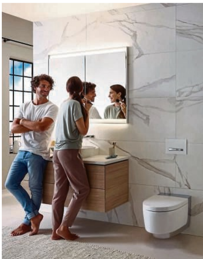
Das Bad als Ort der Erholung und Regeneration stellt hohe Ansprüche an die Einrichtung und funktionale Ausstattung.

Eine im Dusch-WC integrierte Sitzheizung kann zusätzlich vor kalten Überraschungen beim Toilettengang bewahren und sorgt für Entspannung. djd