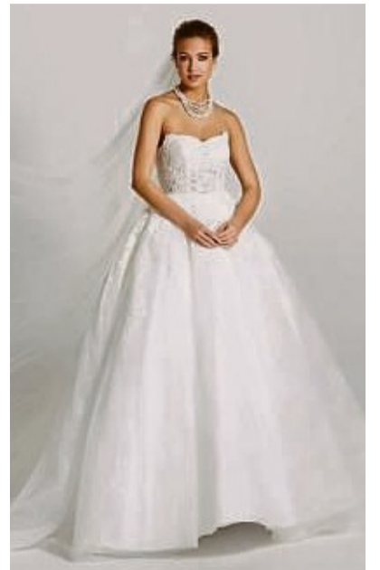
Die aktuelle Brautmode ist vielfältig und bietet für jeden Typ Frau die passende Form. Vom verspielten Prinzessinnenkleid bis zum minimalistischen Look ist alles möglich – Hauptsache wohlfühlen!