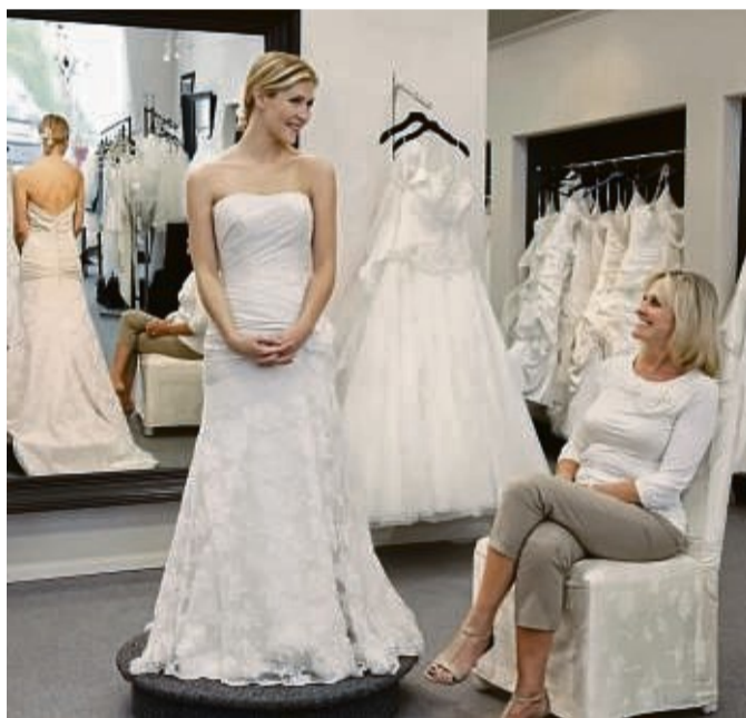
Eine Anprobe soll neben Spaß auch das Beste für die zukünftige Braut herausholen.

Jede Braut möchte an ihrem großen Tag die schönste Frau sein – unabhängig von