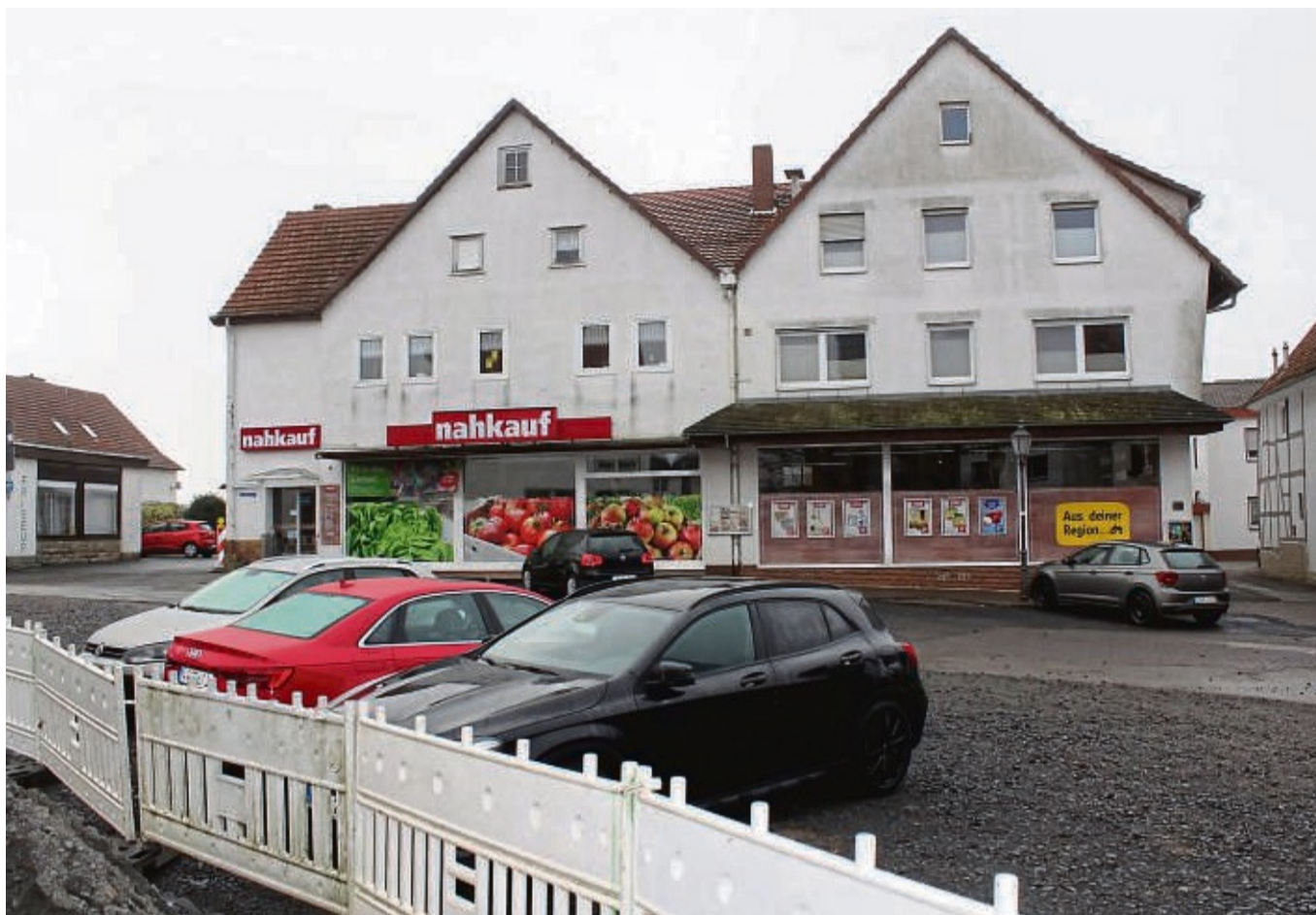
Mehr als 800 000 Euro fließen in die nächsten Arbeiten am Waldecker Marktplatz. Außerdem soll eine Machbarkeitsstudie erstellt werden, wie im Haus Nummer 3/5 Einzelhandel auch in Zukunft gehalten werden kann.

Auf dem Marktplatz rückt die Zukunft des Doppelgebäudes Nummer 3/5 ins Zentrum des Interesses. Der Pächter des Lebensmittel-