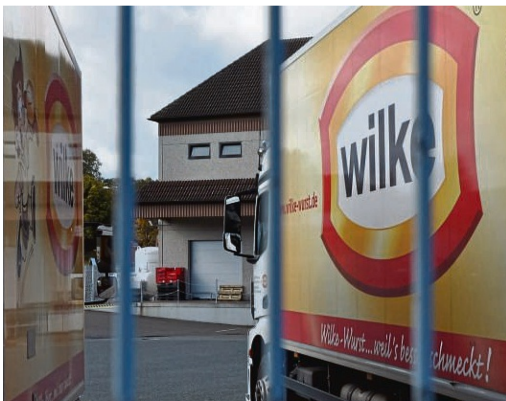
Die Staatsanwaltschaft Kassel erhebt Anklage unter anderem gegen den ehemaligen Geschäftsführer der Firma Wilke Wurstwaren in Twistetal-Berndorf. Ihm werden diverse Straftaten vorgeworfen.

Das Robert-Koch-Institut hatte schon 2018 bei einer