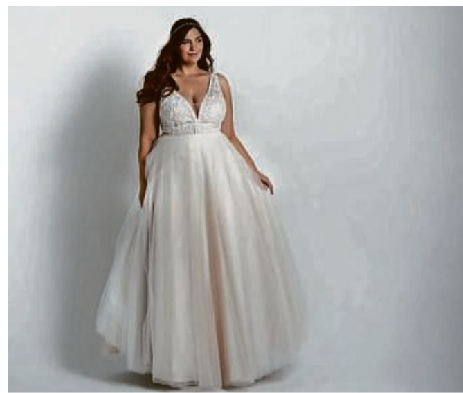
Frauen mit voller Figur haben häufig ein traumhaftes Dekolleté. Der Deep-Plunge-Ausschnitt verlängert den Hals optisch und streckt die Figur vorteilhaft.

Bei einem trägerlosen Brautkleid sind filigrane Spitzentops genau das Richtige, um das Brautstyling harmonisch abzurunden. Vor allem, wenn der Wunsch besteht, Arme oder Rücken zu bedecken. Ärmel mit Spitzenapplikationen, Illusionsausschnitte und feine Rückenansichten – das alles sind wunderschöne Eyecatcher.