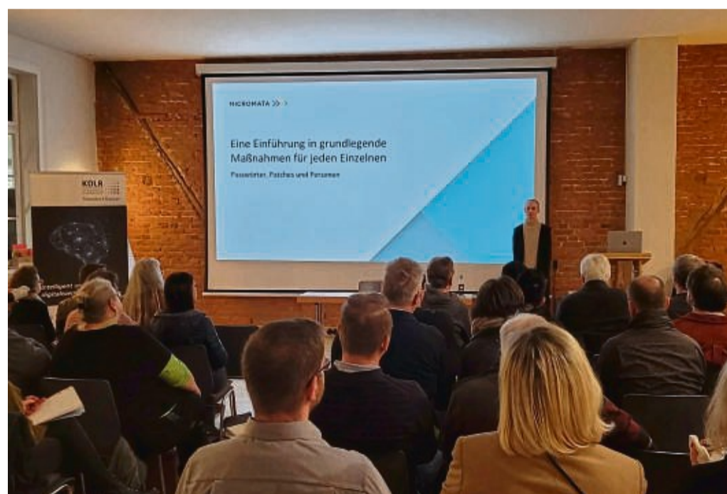
Nach der sehr gut besuchten Veranstaltung mit knapp 50 Teilnehmenden im Hotel Freund in Oberorke, zieht die Wirtschaftsförderung ein positives Fazit.

*Sämtliche Bezeichnungen beziehen sich auf alle Geschlechter.