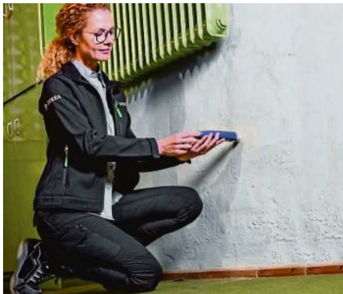
Ob und wie viel Feuchtigkeit sich bereits in der Wand festgesetzt hat, kann mit einem Feuchtigkeitsmesser festgestellt werden.

Kraus: „Eine über längere Zeit erhöhte Feuchtigkeit oder Nässe im Keller bedeutet eine Gefahr für gelagerte Vorräte, Kleidung, Möbel