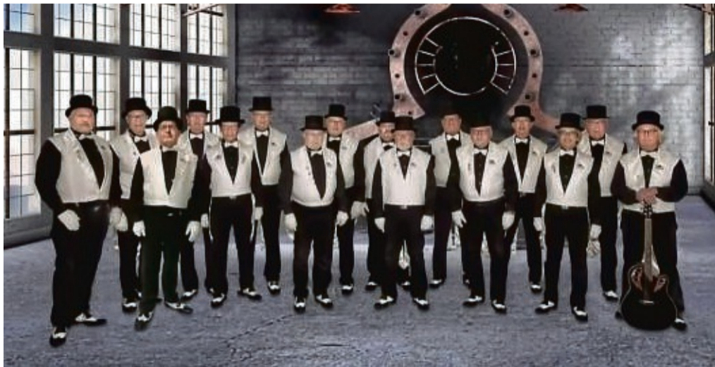
Mit einem zweiten Konzert reagieren die Ladyknacker auf die hohe Nachfrage. Nun singen sie am 28. und 29. April im Bürgerhaus in Reichensachsen.

Ebenso wie zu diesem Konzert sollen die Ladyknacker auch am Samstag, 29. April, vom Wildecker Herzbuben Wolfgang Schwalm unterstützt werden. Er wird beide Konzerte moderieren und auch selbst einige Lieder singen. „Ein zusätzliches Schmankerl“ konnten die Ladyknacker für das Zusatzkonzert am 29. April engagieren: