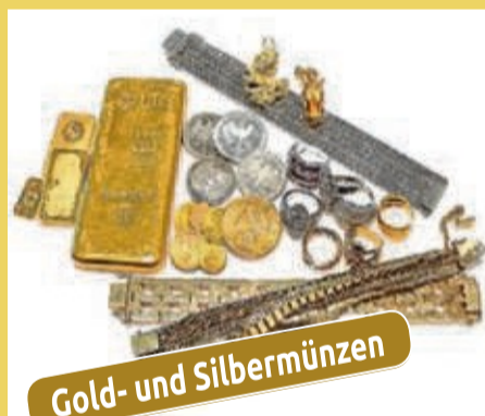
Gold- und Silbermünzen