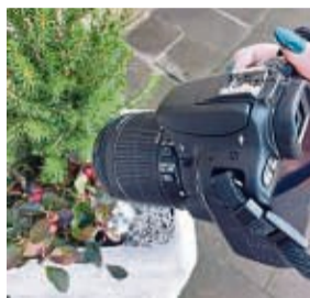
Fotowettbewerb: „Zeig mir Sontra!“

gern die Teilnahme zu ermöglichen. Die Bilder sollen im Querformat sein und eine Größe von mindestens 2,5 MB (jpg-Datei, Auflösung 300 dpi) besitzen. Teilen Sie uns Namen, Anschrift und Telefonnummer