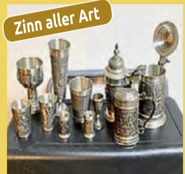
Zinn aller Art