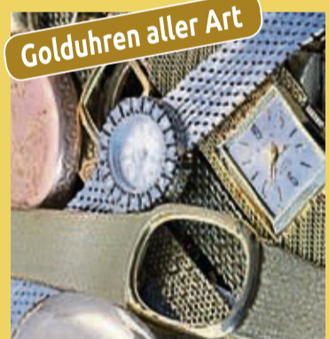
Golduhren aller Art