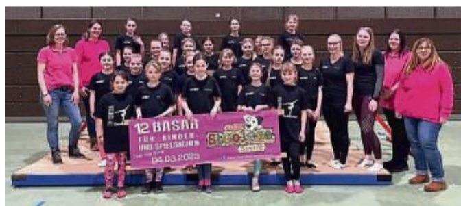
Der nächste Basar für Kindersachen findet am 4. März im Bürgerhaus Sontra statt.

Seit dem ersten Basar im Februar 2016 hat das Basar-team „Kleine Strolche“ aus Sontra schon einiges erreicht