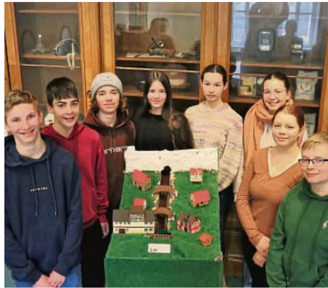
Einige Schülerinnen und Schüler der Klasse 9b der FWS Wanfried haben im Physikunterricht ein Wasserwerk im Miniaturformat gebaut.

Im E-Werk selbst ist ein Einplatinencomputer versteckt. „Da mussten wir ein bisschen tricksen, denn die Wasserkraft im Modell hat nicht ganz ausgereicht, um das Gebäude des E-Werks ausreichend zu beleuchten“, erklärt einer der Schüler, der an der Technik gearbeitet hat. Der Mini-Computer verstärkt das Signal, sodass bei Betrieb die Lichter des Miniatur-E-Werks ohne Flickern leuchten. Unter der Oberflä-