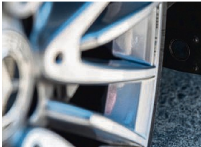
Mitteilungen aus dem Radhaus: Ein Nässe-Sensor im Radkasten dieses Mercedes kann feuchte Straßen ermitteln.

Bei Kribbeln, Brennen und tauben Füßen Wegen großer Nachfrage 2. Beratungstag* (auch telefonisch möglich) zum Thema „Polyneuropathie“ unter Einhaltung der Hygieneregeln Mi. 01.03.2023 Jetzt anmelden und Testangebot sichern! ☎ 06451 - 7 23 70 *keine Diagnostik Apotheke am Obermarkt Apotheker Thomas Czechowski-Körner Obermarkt 22 | 35066 Frankenberg Mo. - Fr. 08.00 - 18.30 Uhr | Sa. 08.00 - 13.00 Uhr