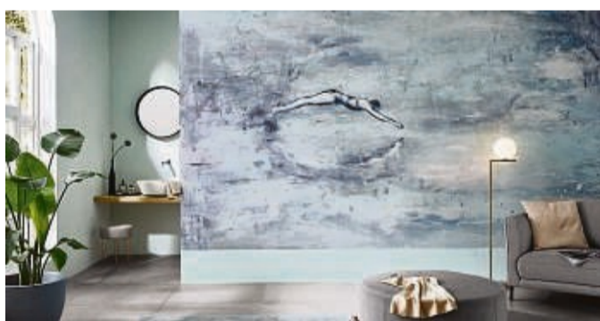
Ausdrucksstarke Kunstmotive finden sich weiterhin in den Kollektionen, wie zum Beispiel hier von Erismann.

Laut Trendbericht des Tapeten-Instituts ist diese Entwicklung eine Reaktion auf ein gesellschaftliches Gefühl: „Unsere Sehnsucht nach Wohlfühlen, nach angenehmen Erlebnissen ist in Zeiten der (Energie)Krise groß. Nackte Wände fühlen sich kalt und l(i)eblos an.“ Nun ist es Trends zu eigen, dass sie Bedürfnisse und gesellschaftli-