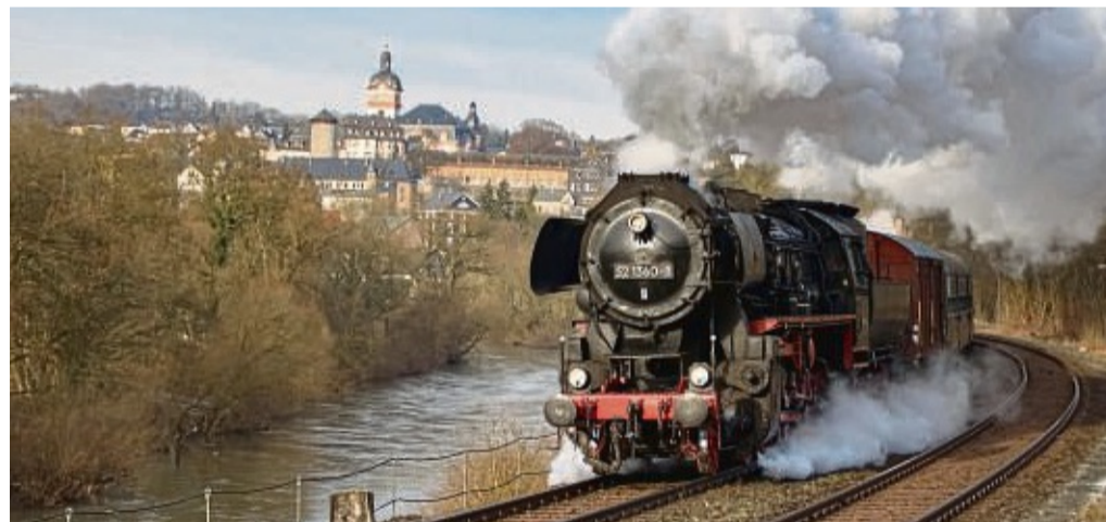
Die Eisenbahnfreunde Treysa laden wieder zu ihren beliebten Sonderfahrten ein.

Die Eisenbahnfreunde bitten um frühzeitige Buchung. Der Erlös der Fahrteinnahmen wird zum Erhalt der historischen Schienenfahrzeuge genutzt. Weitere Informatio-