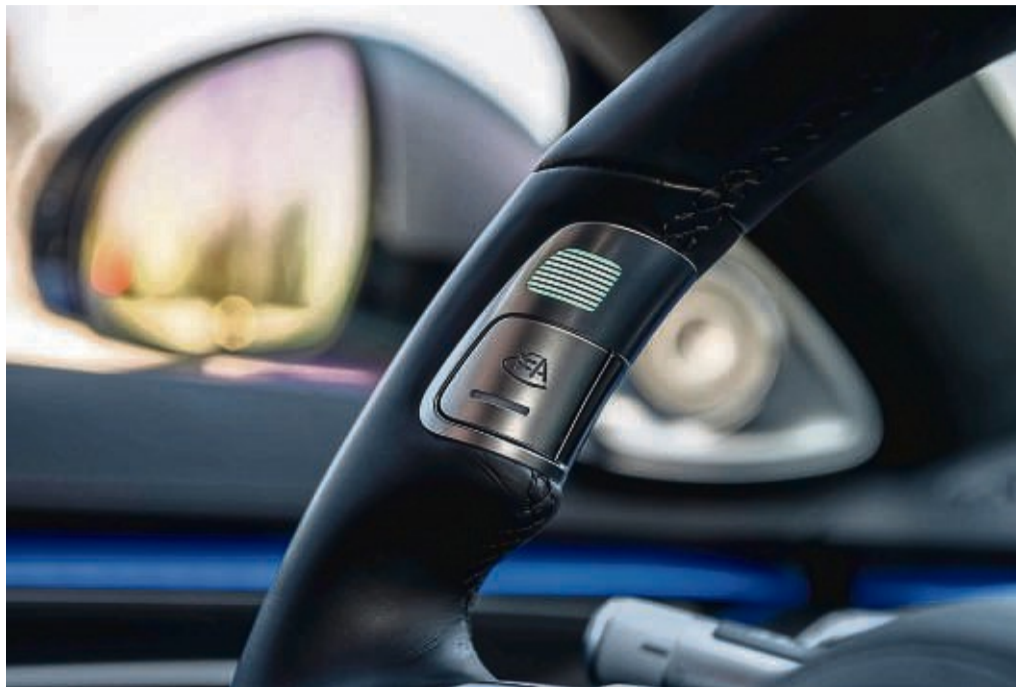
Mach, was Du willst – zumindest eine Zeit lang: Ist der Drive Pilot im Mercedes mit türkischem Licht aktiviert, übernimmt das Auto das Zepter.