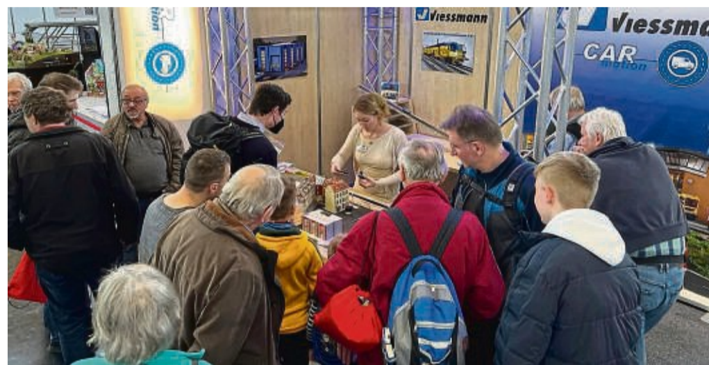
Andrang bei der Messe: Das Bild entstand am Stand der Firma Viessmann-Modelltechnik aus Reddighausen.

Messetagen (Samstag und Sonntag) war die Spielwarenmesse, die sonst Fachhändlern vorbehalten ist, auch für Privatkunden zugänglich.