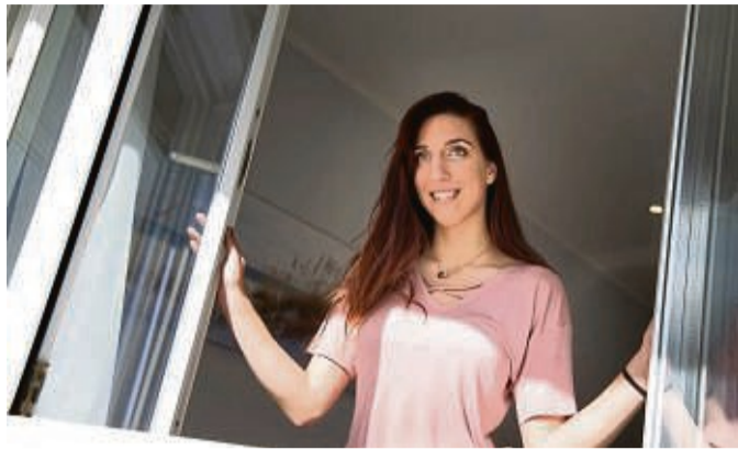
Wie aufwendig ein Fenstertausch ist, hängt vom Gebäude und den alten Fenstern ab.

Wie erkenne ich, welchen Standard mein Fenster zu Hause hat? Wie oft verglast die Fenster daheim sind, lässt sich mit einem Feuerzeug herausfinden: Die Flamme spiegelt sich so oft im Glas, wie Scheiben im Fenster vorhanden sind, erklärt der Verband Fenster + Fassade (VFF). Spie-