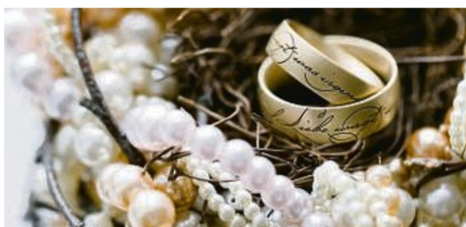
Immer beliebter sind aufwendig gestaltete Ringe.

Eheringe sind das Symbol für die ewige Liebe und Verbindung zweier Menschen. Nach dem Anstecken der Ringe – der Höhepunkt jeder Trauzeremonie – begleiten die Schmuckstücke das Brautpaar ein Leben lang. Eine sorgfältige Auswahl ist daher besonders wichtig. Die Trauringe müssen nicht nur stilistisch perfekt zum Brautpaar passen, sondern auch widerstandsfähig sein.