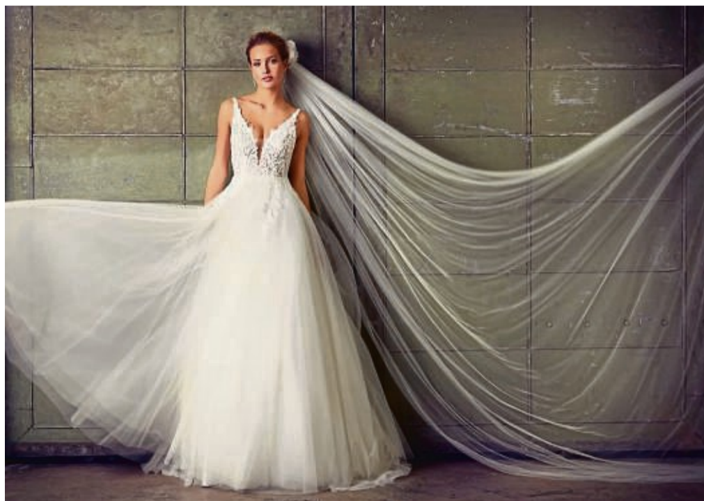
Das Trendelement an Brautkleidern: Viel Tüll und ein langer Schleier, wie bei diesem Modell von Lilly.

Zum Boho-Glam gehört vor allem ein Modell: Das Brautkleid mit Corsage und voluminös ausgestelltem Rock, auch als Prinzessinnen- oder Duchesse-Kleid bezeichnet. Ein weiteres Merkmal ist Tüll, wohin man nur blickt. Weite, zarte Tüllröcke, Glitzertüll-Elemente, bestickte Tüllschleppen. Dazu feine Spitzendetails. Anders als beim Original-Boho-Look aber eher nicht aus Häkelspitze, sondern zart und filigran.