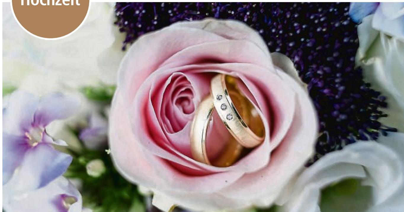
Schlichte Designs sind bei Trauringen nach wie vor am meisten gefragt. Für eine individuelle Optik sorgen Akzente wie Mattierungen oder Edelsteine.