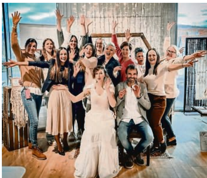
Das Wedding Lounge Team mit allen Ausstellern.

Man taucht in eine besondere Welt ein und genießt in entspannter und persönlicher Atmosphäre eine professionelle Beratung mit dem Vockeroth Team vor Ort. Wer es noch privater möchte, kann bei Vockeroth entwe-