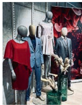
Festliche Mode bei Vockeroth.