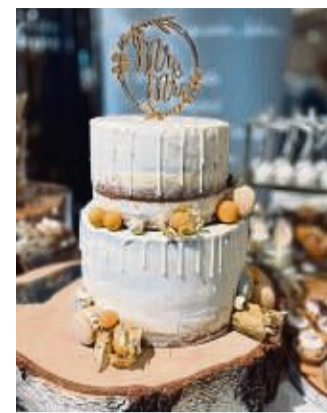
Tortenpräsentation von Sweetcakes.