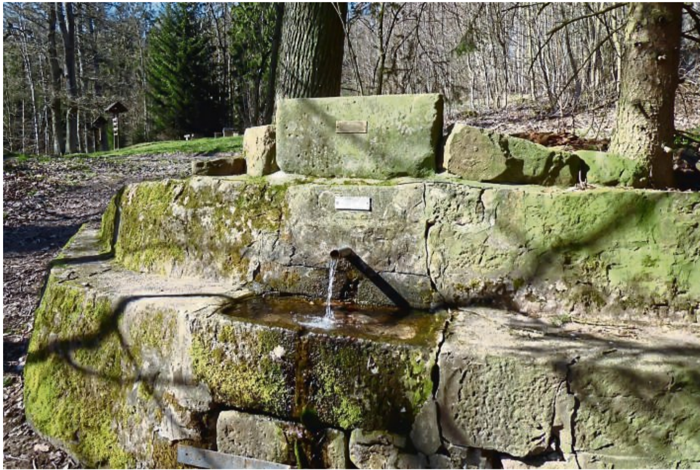
Auf dem Quellpfad tauchen die Wanderer in die alten Zeiten des Mittelalters ein.

Ebenfalls einen Ausflug wert ist der Märchenweg Liebenbach: Schon die Gebrüder Grimm schrieben über die tragische Spangenberg Geschichte. In literarischen Um-