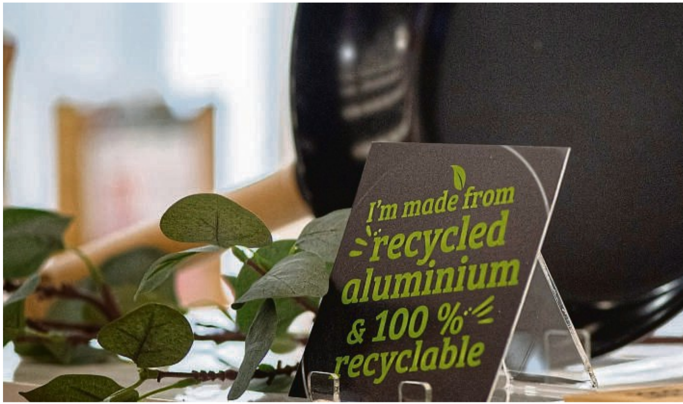
Besteht aus recyceltem Material und wird recyclebar sein, wenn man das Produkt entsorgt: Damit warb zum Beispiel die Firma Russell Hobbs für seine Pfannen auf der Messe Ambiente in Frankfurt.

Hört sich nicht neu an? Stimmt, und doch gibt es Neues zu berichten: Bisher handelte sich in aller Regel nicht um echten Müll, der weiterverwertet wurde, son-