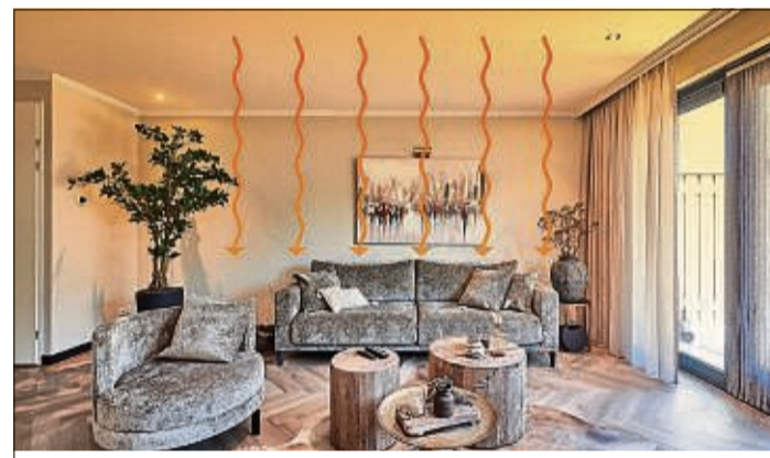
unabhängig heizen mit Infrarot Heizung unter der Decke