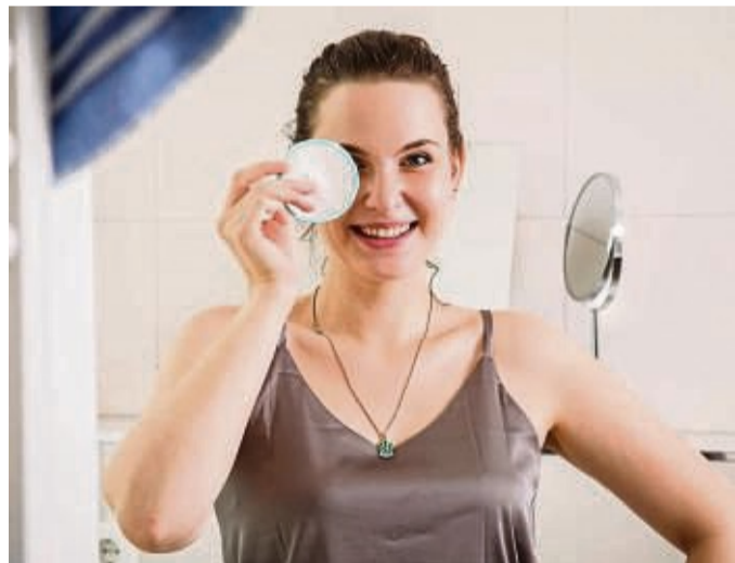
Wer weniger wegwerfen will, kann beim Abschminken auf waschbare Pads statt Watte-pads setzen.

Wer ganz auf Abschminkpads verzichten mag, für den hat Moers-Carpi übrigens einen anderen Tipp: Einfach zu Tüchern aus alten Baumwoll-T-Shirts greifen. Diese könne man ebenso gut zur Gesichtereinigung verwenden.