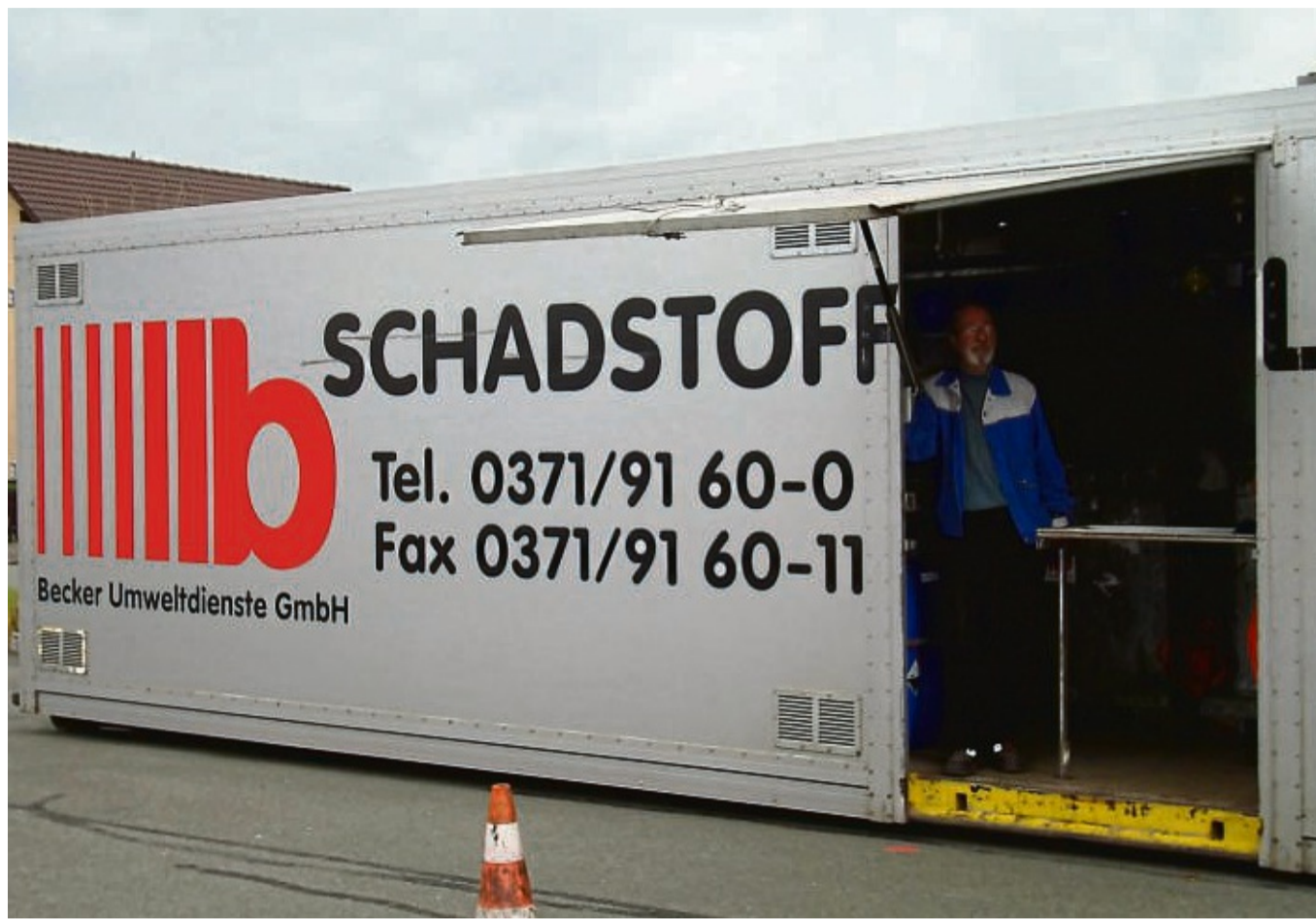
Beitrag zum Umweltschutz: In den nächsten Wochen sind im Landkreis wieder spezielle Fahrzeuge unterwegs, an denen Mitarbeiter kostenlos Sonderabfälle aus Privathaushalten annehmen.

Bei Laborchemikalien, Konzentraten, Säuren und Laugen sowie PCB-haltigen Kondensatoren liegt die Gesamtannahmemenge bei maximal 10 Kilogramm bzw. 10 Litern, bei Cyaniden und quecksilberhaltigen Abfällen bei 1 Kilogramm bzw. 1 Liter. Solarthermieflüssigkeit sowie Frostschutzmittel aus Solaranlagen können in der Regel über den Installateur zurückgegeben werden; hier ist die entgeltfreie Abgabe am Schadstoffmobil für private Haushalte auf 20 Liter begrenzt. Flüssige Sonderabfälle dürfen nicht miteinander vermischt werden und sollten nach Möglichkeit im Originalbehältnis mit entspre-