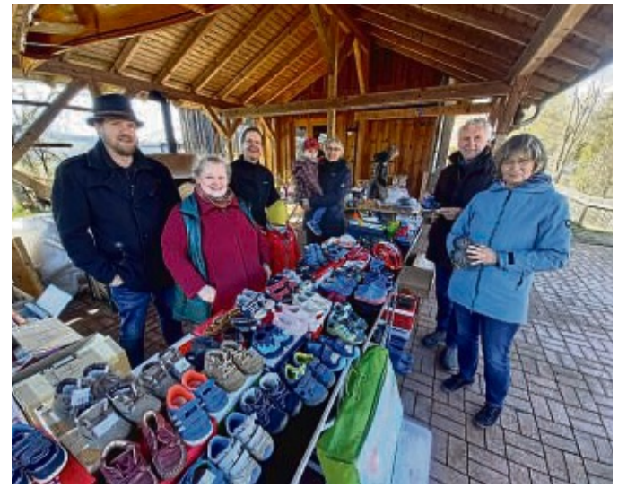
Gut erhaltene Gegenstände zu günstigen Preisen werden beim Dorfflohmarkt in Wellen geboten.