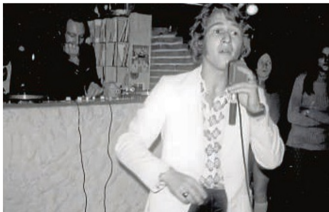
Peter Maffay im Oktober 1970 im Crazy Alm. Kurz vorher hatte er seinen Alfa bei einem Unfall zerlegt.