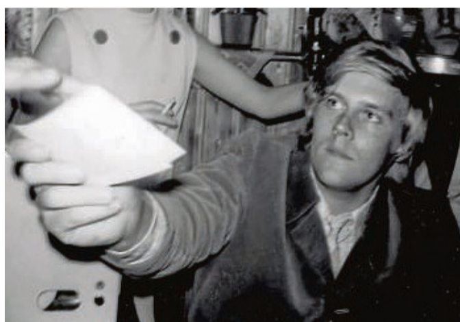
Howard Carpendale gibt im Juni 1969 in der Tropicana-Bar in Berndorf Autogramme.