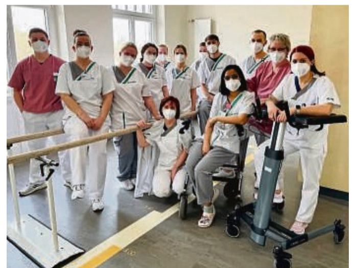
Die Pflegeschüler:innen leiteten drei Wochen lang die Station in Eigenregie.

Die Neurologie Phase B umfasst insgesamt 30 Betten, 20 davon wurden von den Pflegeschülern eigenverantwortlich geführt. Neben der Organisation der Pflege, der Koordination von Visiten und Therapien haben sie die Betreuung der Patienten übernommen. Unterstützt wurden sie dabei von ihrer Kursleitung, dem Ausbildungsteam und den Praxisanleitern der Asklepios Kliniken Bad Wildungen sowie dem Pflegepersonal der Station. Die Erfahrungen, die die Schüler während der eigenverantwortlichen Führung der Station gesammelt haben, sind für ihre spätere