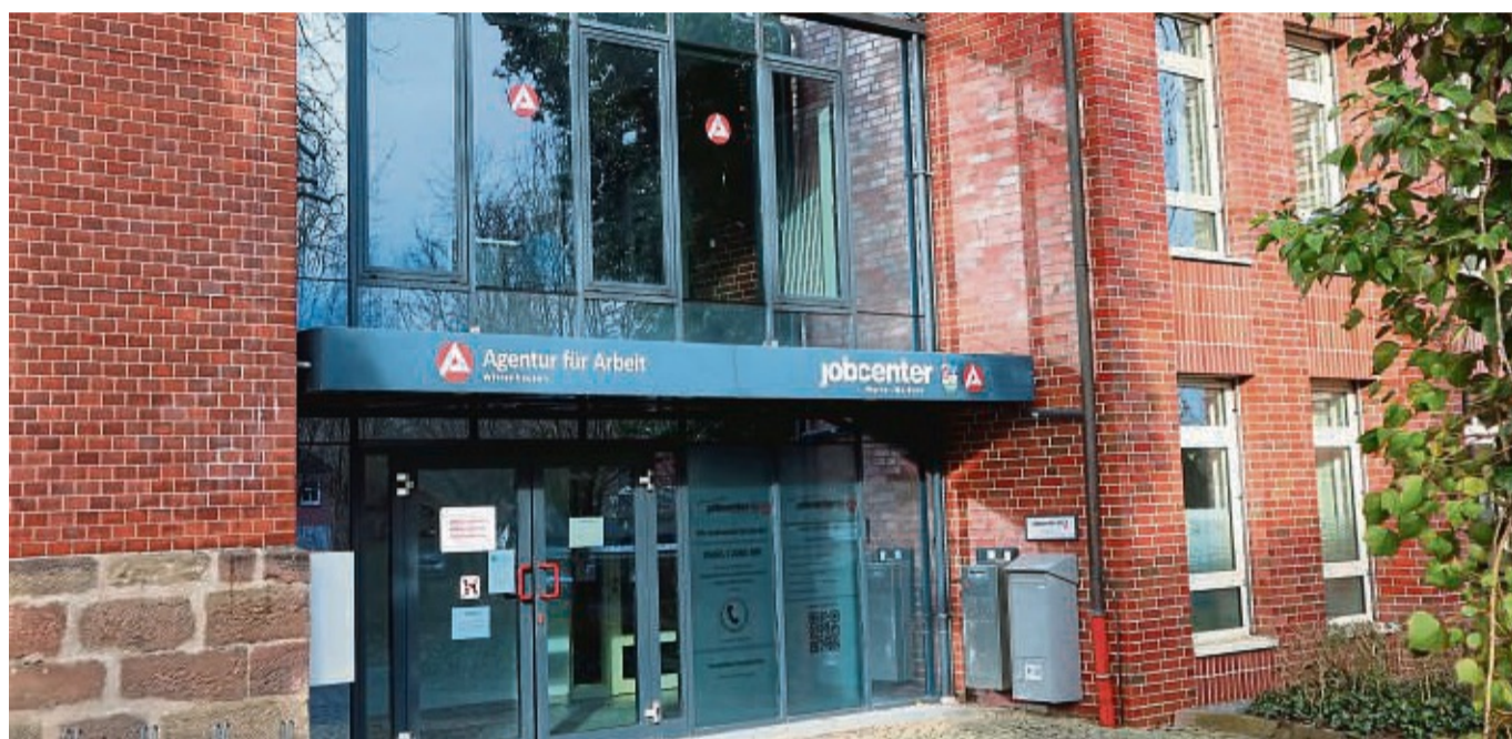
Das Jobcenter Werra-Meißner am Standort Witzenhausen. Mittlerweile sind 736 Ukrainer im Werra-Meißner-Kreis gemeldet.

Für das Jobcenter haben die Kriegsflüchtlinge eine Herausforderung bedeutet, da eine erhebliche Mehrarbeit angefallen ist. „Wir hatten nur gute vier Wochen Zeit, um 20 Prozent mehr Arbeit bei gleichem Personal zu organisieren“, berichtet Uwe