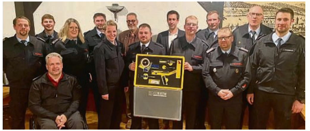
Ein „Glasmanagement-Einsatzkoffer“ wurde der Lippoldshäuser Feuerwehr übergeben.