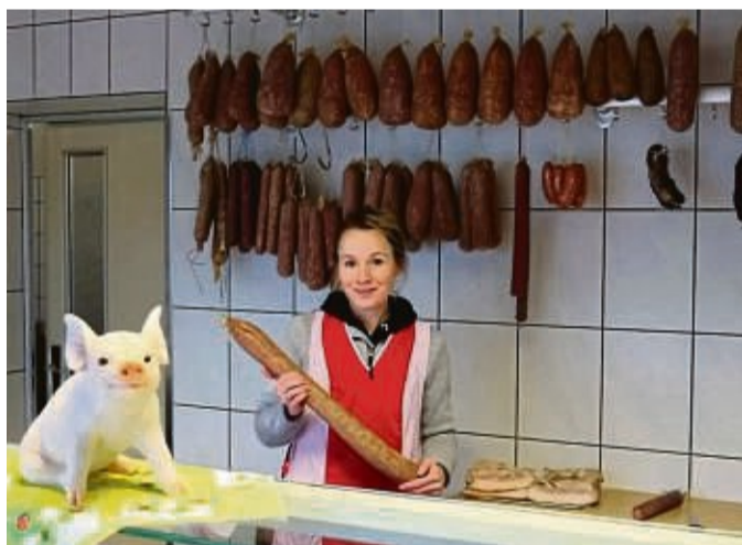
Bei der Bornhager Fleisch- und Wurstspezialitäten GmbH wird Tradition großgeschrieben.