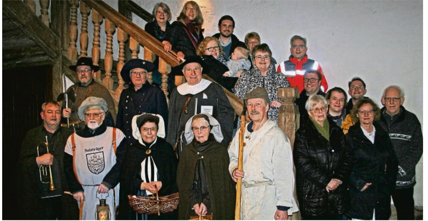
Nomen est Omen: Bei schwachem Licht übergab die Stadtführer-Gruppe „Allendorf bei Nacht“ die Geldspenden an die Begünstigten.

Im Einzelnen erhielten die St.-Crucis-Kirchengemeinde für ihr Taufstein-Projekt 1500 Euro und der Förderkreis Kirchenmusik an St. Crucis 1000 Euro für eine Truhennorgel. Jeweils 500 Euro gingen an den örtlichen Sozialkreis, die St. Marien-Kirchengemeinde in Sooden für ihren barrierefrei-