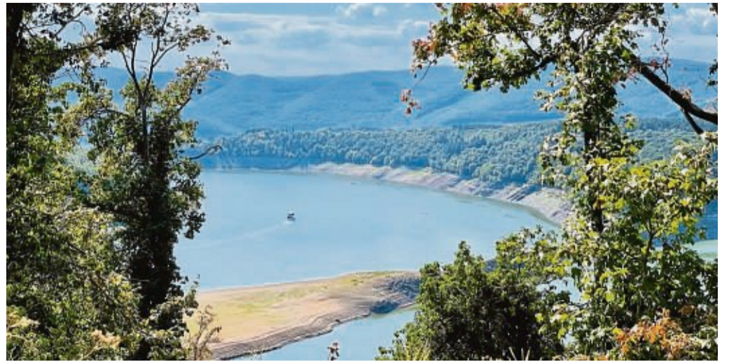
Beliebtes Urlaubsziel: Die Übernachtungen am Edersee haben wieder kräftig angezogen, alle Kommunen in der Region haben gegenüber dem Vorjahr zugelegt, teilt die Edersee Marketing GmbH mit.

Die Korbacher haben schnell gemerkt, dass die Post in den Markt an der Briloner Landstraße eingezogen ist. Die ersten hätten schon vor der Tür gestanden, um Pakete abzugeben, berichtet Wahler: „Aber wir haben nicht für den Kundenverkehr geöffnet.“ red