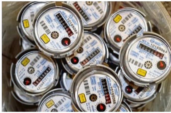
Der Tourismus erhöht den heimischen Wasserbrauch auf einen Spitzenwert in der Region.

Die Vergleichszahlen der aktuellen Statistik reichen bis 2008 zurück: Insgesamt wurden 2021 in Waldeck-Frankenberg 8,1 Millionen Kubikmeter Wasser verkauft – nur 2014 lag der Wert niedriger. Seit 2010 schwankt die