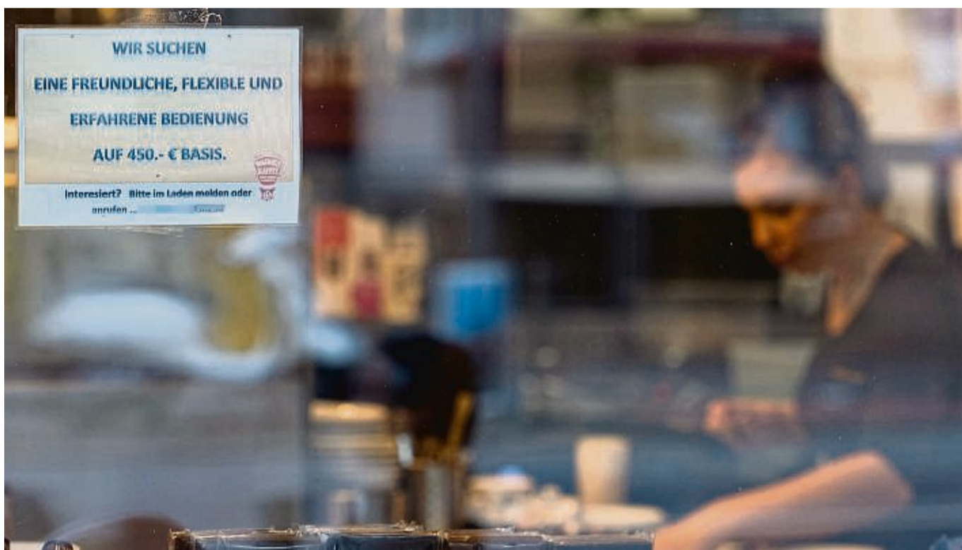
Personal dringend gesucht: Mitarbeiter werden derzeit in fast allen Branchen gebraucht, vor allem aber auch in Handwerksberufen.