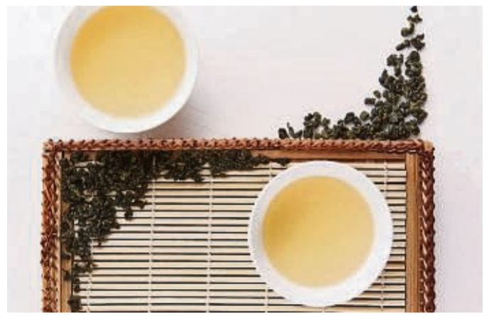
Bei jedem erneuten Aufguss des Oolong Tees entwickelt sich ein anderes Aroma.

Schlussendlich ist wichtig, dass wir auch auf uns achten: Schaffen wir es gerade, das Kind aufrichtig und ehrlich zu trösten? Können wir sagen: „Ich verstehe dich, du bist wütend und traurig. Komm, wir finden heraus, was dir jetzt hilft“. Oder sind wir gerade selbst gestresst und können das Toben nur schwer aushalten? Auch das gehört dazu - wir entwöhnen nicht nur das Kind, sondern auch uns Eltern.