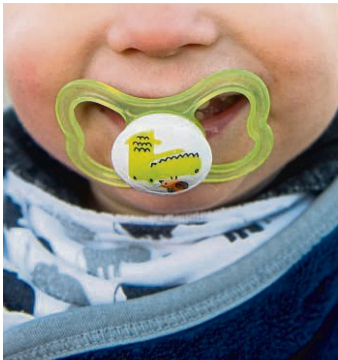
Geliebt und verflucht zugleich: Schnuller vermitteln Kinder ein Stück Sicherheit.

Nicola Schmidt: Zum einen ist der Schnuller eine Gewohnheit und unser Gehirn liebt Gewohnheiten, es gibt sie nur unter Protest wieder auf. Zum anderen spendet der Schnuller vielen Kindern Trost und hilft ihnen beim Einschlafen. So entsteht eine enge Bindung zu dem Schnuller, insbesondere, wenn er immer verfügbar ist. Ist er das nicht mehr, entsteht ein