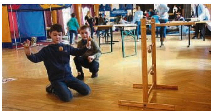
Eine Menge zu entdecken gab es beim Winterspielplatz der Jugendförderung in Waldkappel.

In Windeseile verwandelten sich dafür die Räumlichkeiten des Bürgerhauses in einen Spielplatz der besonderen Art, welcher Familien aus der Kernstadt sowie den dazugehörigen Stadtteilen zum Austoben und Ausprobieren einlud. Während draußen – passend zur Veranstaltung – tiefstes Winterwetter Einzug hielt, erwartete kleine wie große Besucher drinnen nicht nur ein großer Indoor-Spielepool mit Air-Hockey, XL-Jenga und Flip-Kick, son-