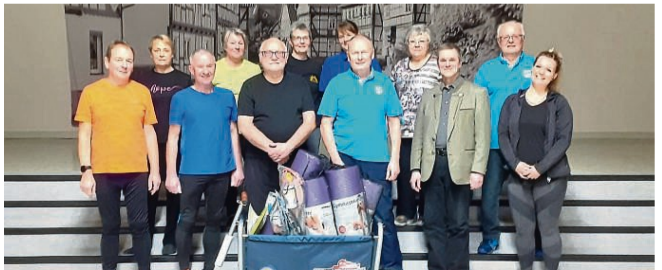
Auch die Mitglieder des TSV Frieda haben einen Bollerwagen inklusive Spiel- und Sportgeräten erhalten.

EINE PRIVATE INITIATIVE FÜR HUMANITÄRE HILFE UNSERE HILFE KOMMT DIREKT AN!