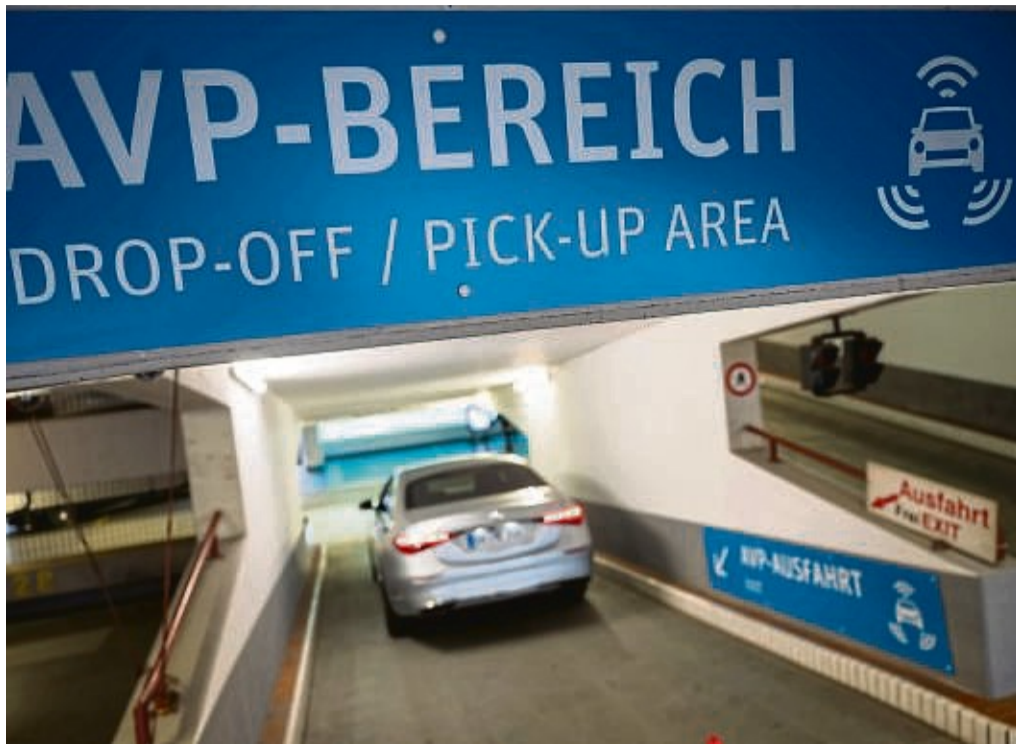
Vorführeffekt in Ordnung: Eine Mercedes-Benz S-Klasse fährt ohne Insassen automatisiert durch ein Parkhaus am Stuttgarter Flughafen.

Als einer der ersten Hersteller auf dem Level angekommen ist Mercedes-Benz. Zusammen mit Bosch hat das Unternehmen vor wenigen Wochen vom Kraftfahrt-Bun-