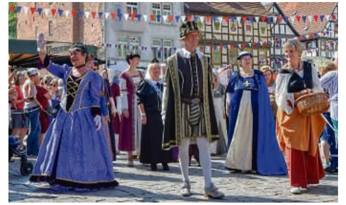
In Schmalkalden versteht man es zu feiern. Gut so, denn das Städtchen ist dieses Jahr Gastgeber des Thüringentags.