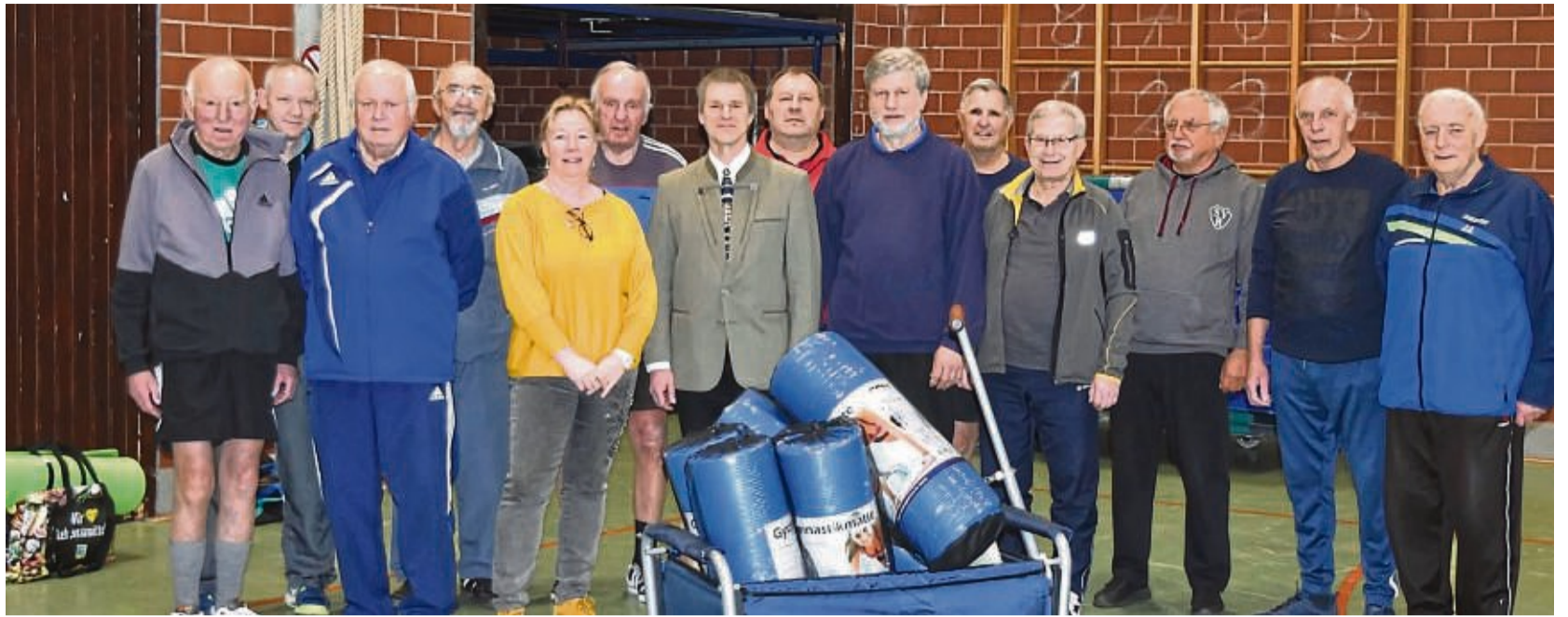
Die Pakete bestehen aus einem Bollerwagen, der mit einer Auswahl verschiedener Sport- und Spielmaterialien ausgestattet ist. Die Mitglieder des SV Reichensachsen freuen sich darüber sehr.