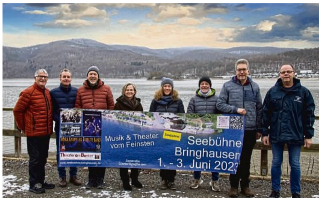
Die Seebühne kehrt zurück: Der Verein „Wir für Bringhausen“ präsentiert mit dem Kultursommer Nordhessen ein dreitägiges Programm aus Oper, Theater, Pop und Rock auf dem Edersee.

Gruppen ab zehn Personen erhalten 5 Euro Ermäßigung je Ticket. Freien Eintritt gibt es für die Begleitperson bei Gästen mit einem „B“ im Ausweis.