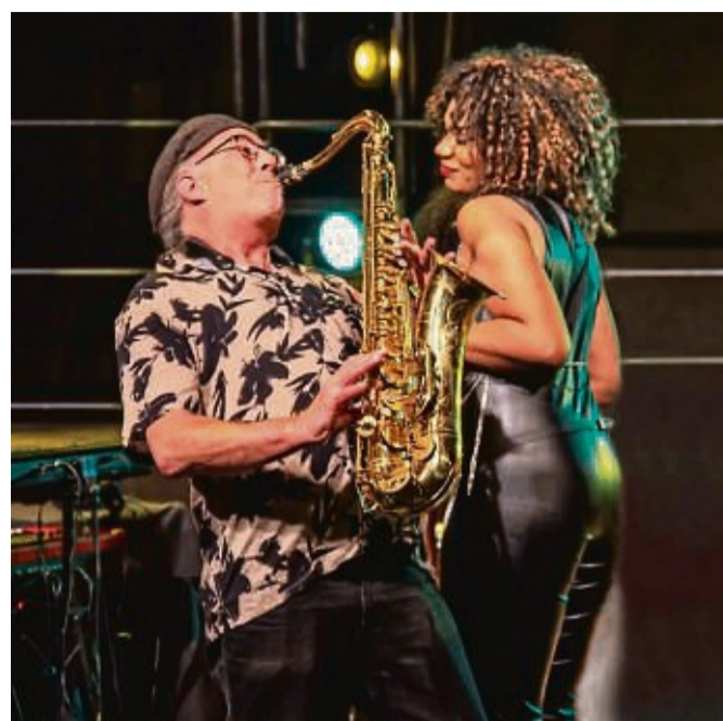
Tina-Musical: Die Tribute-Show steigt am 15. März in Korbach.

Ausführliche Informationen stehen online unter www.seebuehne-bringhausen.de zur Verfügung. Dort können auch Karten bestellt werden.