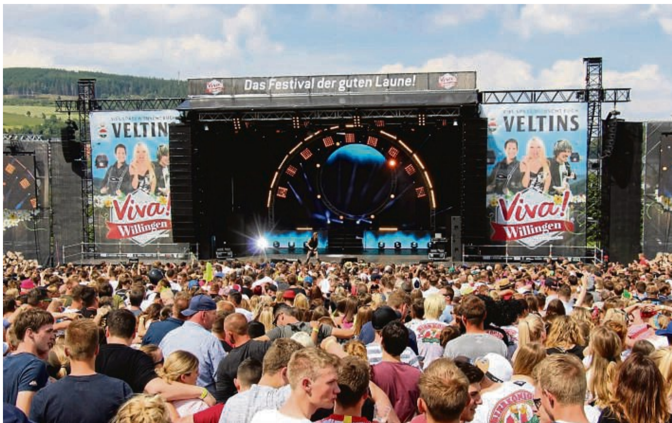
Das Festival Viva Willingen steigt am 17. Juni ein letztes Mal. Das hat der Gemeindevorstand der Uplandgemeinde entschieden.