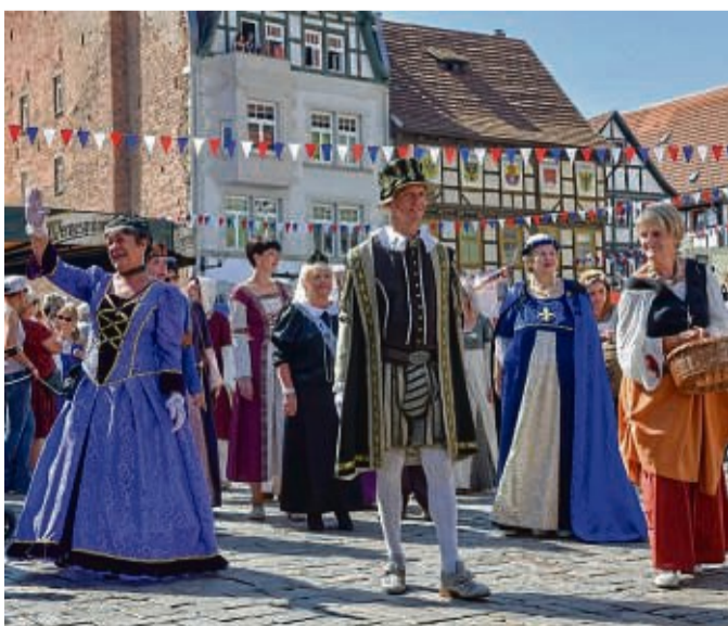
In Schmalkalden versteht man es zu feiern. Gut so, denn das Städtchen ist dieses Jahr Gastgeber des Thuringentags.