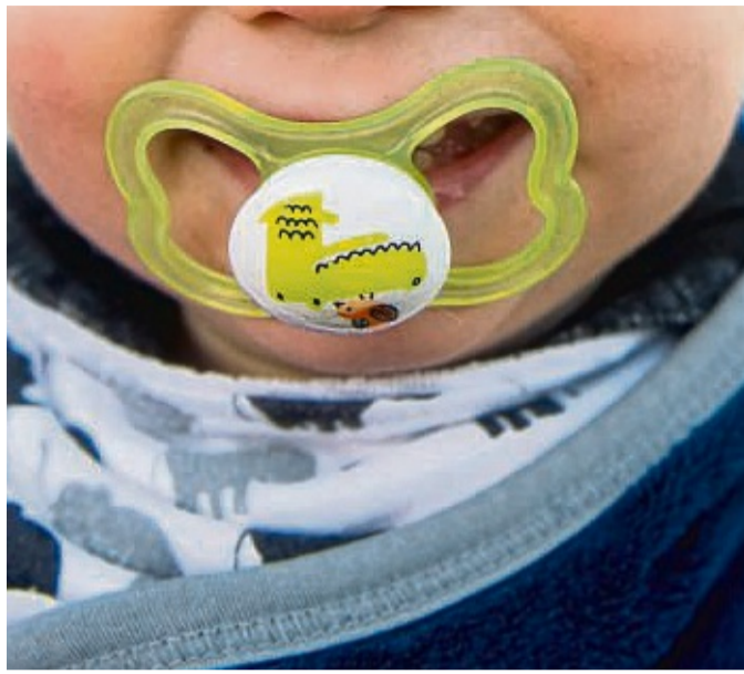
Geliebt und verflucht zugleich: Schnuller vermitteln Kinder ein Stück Sicherheit.

Nicola Schmidt: Zum einen ist der Schnuller eine Gewohnheit und unser Gehirn liebt Gewohnheiten, es gibt sie nur unter Protest wieder auf. Zum anderen spendet der Schnuller vielen Kindern Trost und hilft ihnen beim Einschlafen. So entsteht eine enge Bindung zu dem Schnuller, insbesondere, wenn er