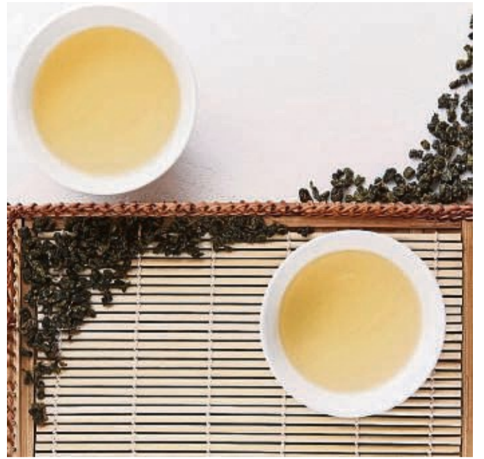
Bei jedem erneuten Aufguss des Oolong Tees entwickelt sich ein anderes Aroma.

Oder sind wir gerade selbst gestresst und können das Toben nur schwer aushalten? Auch das gehört dazu - wir entwöhnen nicht nur das Kind, sondern auch uns Eltern. tmn