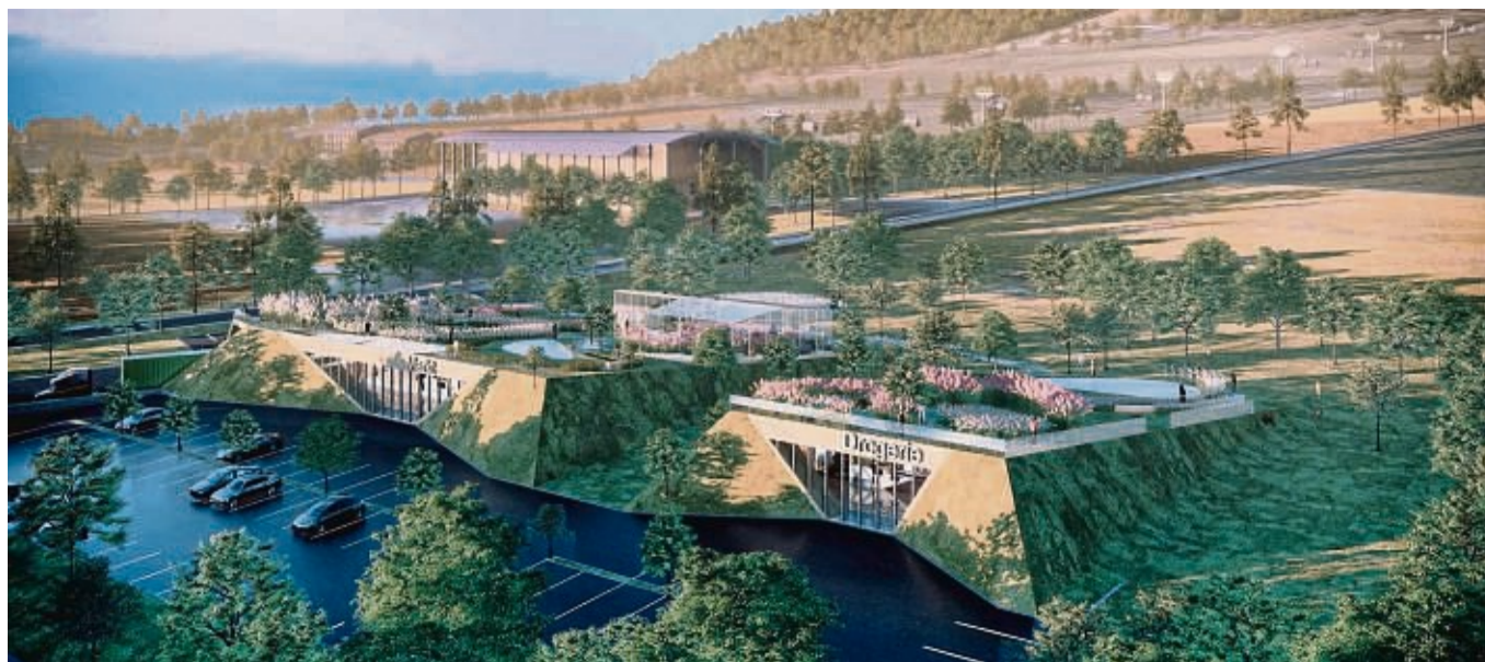
Nachhaltig gebaute Märkte wollen Investoren am Fuße des Ettelsbergs realisieren.

Ein neuer Yoga-Kurs erfreue sich großer Beliebtheit, und es wurden weitere Übungsleiter gewonnen.