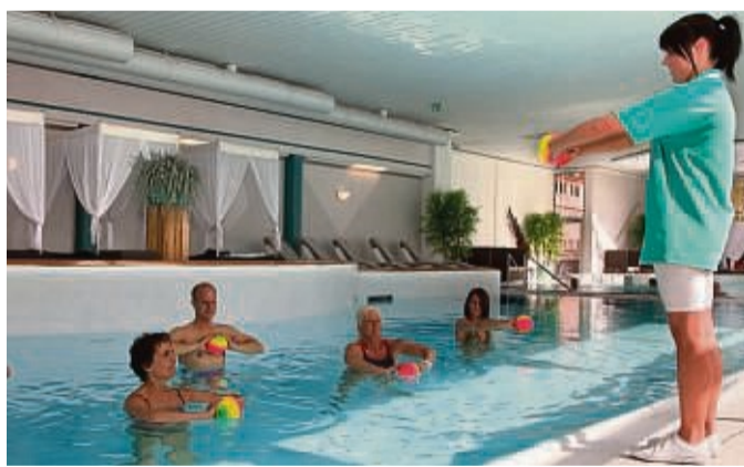
In der Gesundheits- und Fitnesswoche gibt es viele Angebote zum unverbindlichen Testen.

Gesund werden, gesund bleiben, fit sein, sich wohlfühlen – dafür sind auch die kommenden Angebote genau richtig. Es gibt Tipps vom Apotheker, Informationen zum Fahrschultraining für Ältere, zur Fußschule und zum Yoga. Im Fokus steht die Gesundheitsprävention so-