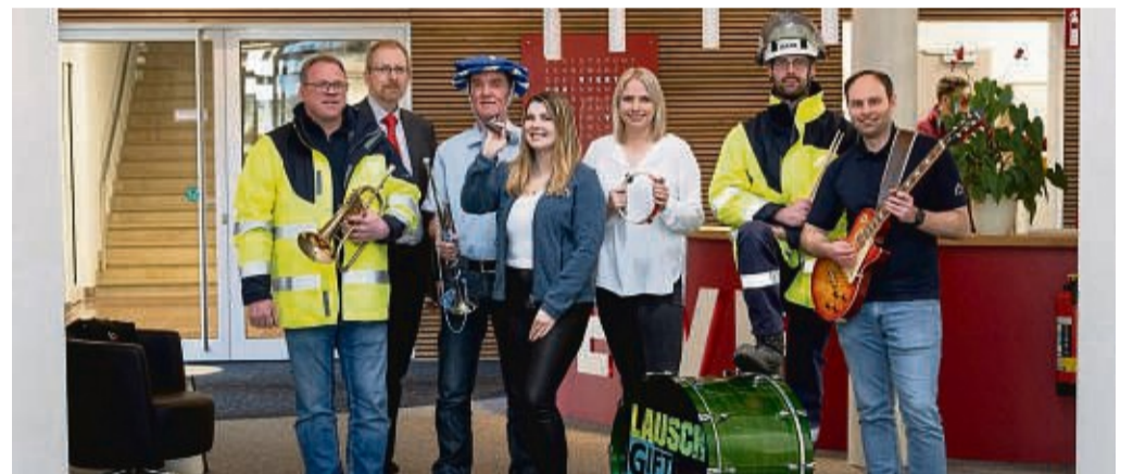
Der heimische Energieversorger Energie Waldeck-Frankenberg ruft zur Bewerbung für seinen Bandwettbewerb unter dem Motto „EWf – Wir bringen Energie auf die Bühne“ auf.