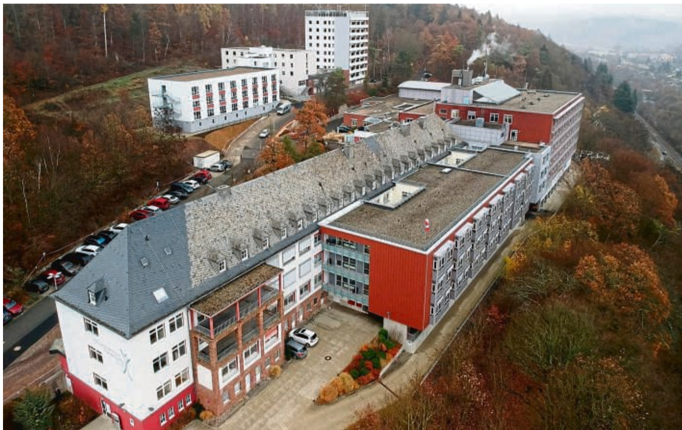
Das Kreiskrankenhaus in Frankenberg steht vor einigen Herausforderungen, zum Beispiel bei Arbeitsabläufen, Personalmanagement und der Funktionalität des Gebäudes.

Eine Mitarbeiterin des Kreiskrankenhauses hat der Redaktion in der vergangenen Woche berichtet, dass es