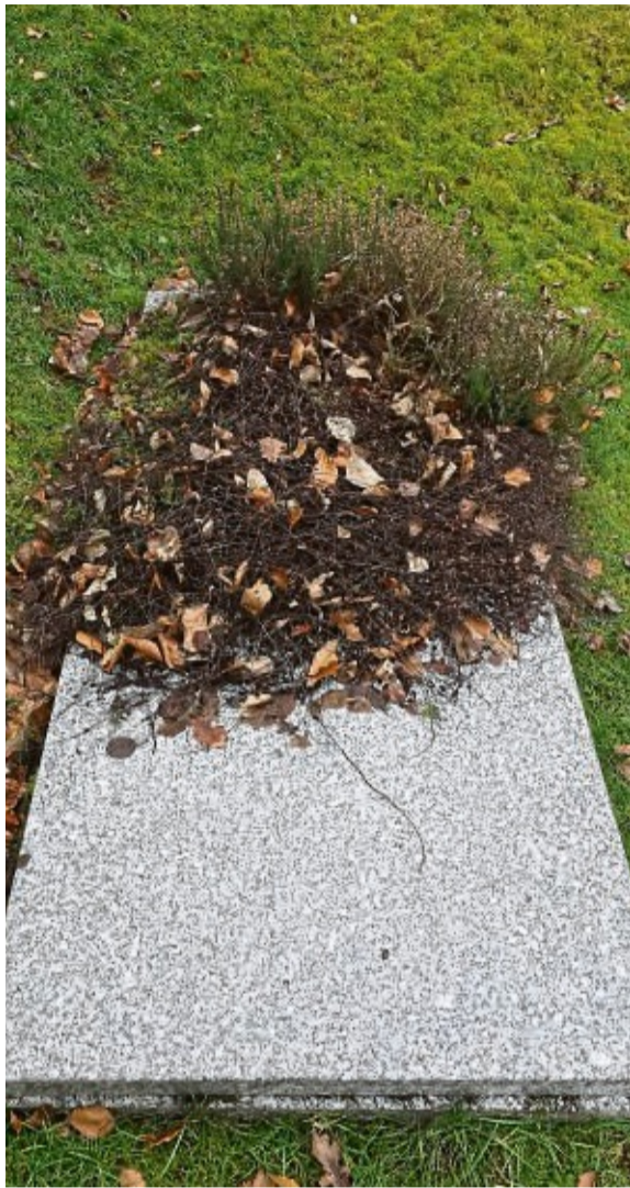
Nicht nur das Sterben, auch Hundehaltung und Kinderbetreuung in Wesertal werden teurer.

Bei der Überarbeitung der Gebührensatzungen wurde der Wortlaut an aktuelle Muster-satzungen angepasst und für die Kindertagesstätte Rasselbande in Lippoldsberg eine komplett neue Benutzungs-