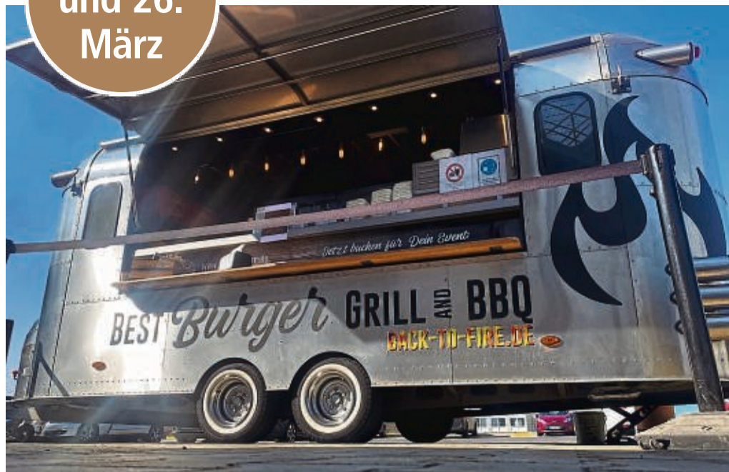
Frisch gebratene Burger sind auf dem Streetfood-Spektakel ebenso zu finden wie selbst gemachte Bowls, geschmackvolle Weine, frische Säfte ...