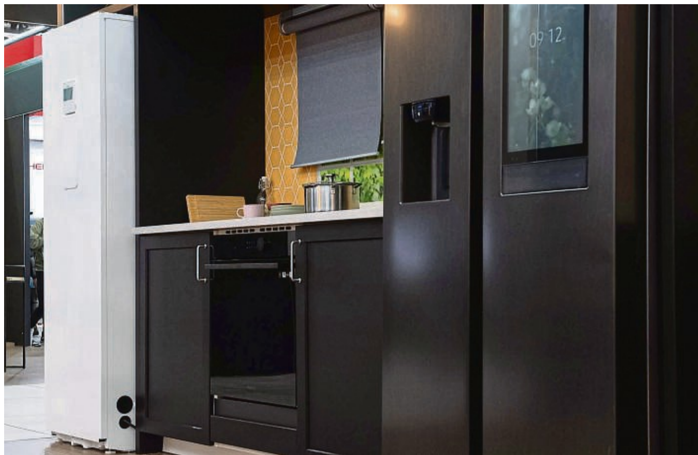
Kühlschrank oder Wärmepumpe? Die im Haus stehenden Teile der Heizungsanlage haben sich optisch verändert. Und können sogar in der Küche untertauchen – wie der weiße EHS ClimateHub Indoor von Samsung.

Gut einsetzbar ist die Wärmepumpe immer schon bei Fußbodenheizungen. Aber Konvektoren und Radiatoren brauchen viel höhere Wassertemperaturen. Diese schaffen bisherige Wärmepumpen oft nur mit mehr Strom - und damit höheren Betriebskosten.