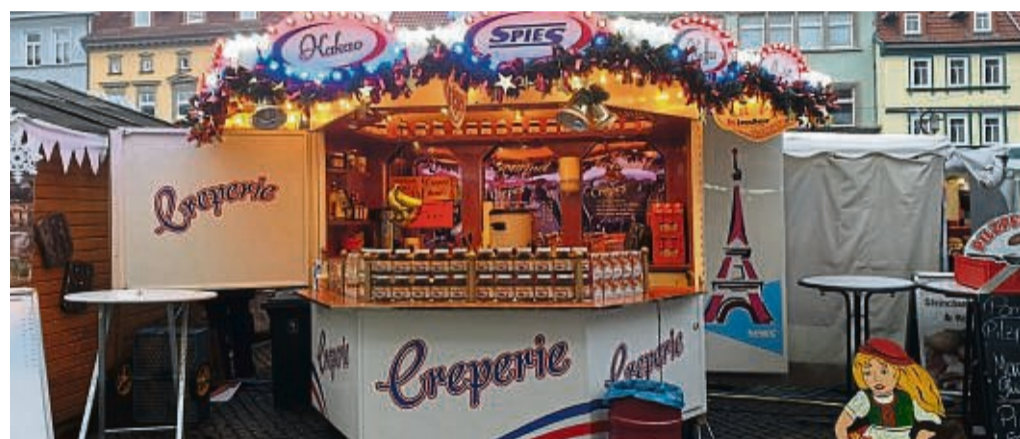
...sowie süße und herzhaftes Crepes.

i Diese Stände sind unter anderem beim Streetfood-Spektakel dabei Getränkestand mit Bier, Softdrinks und vielem mehr Bowl-Stand mit Bowl, Weinen und Säften Indonesische Gerichte XXL-Fleischspieße Burgerstände Mac & Cheese Grillschinken Crêpe Kaffeespezialitäten