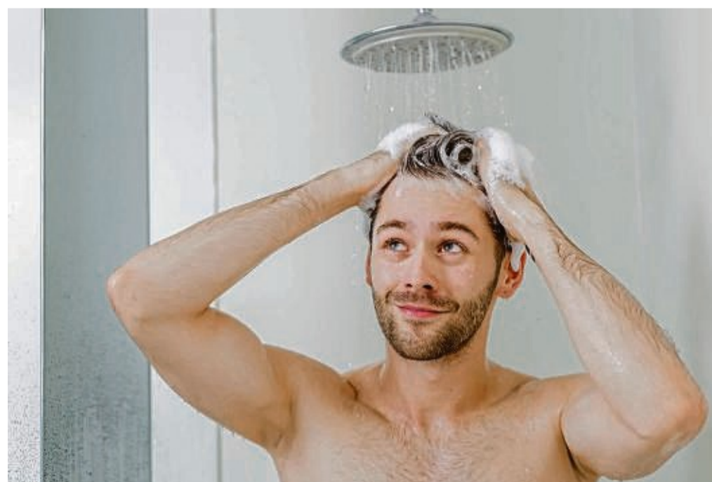
Alles eine Frage des Duschkopfes , ob man im Schnitt 15 Liter Wasser pro Minute oder nur rund sechs Liter pro Minute verbraucht.

Test: Wassersparende Duschköpfe amortisieren sich schnell