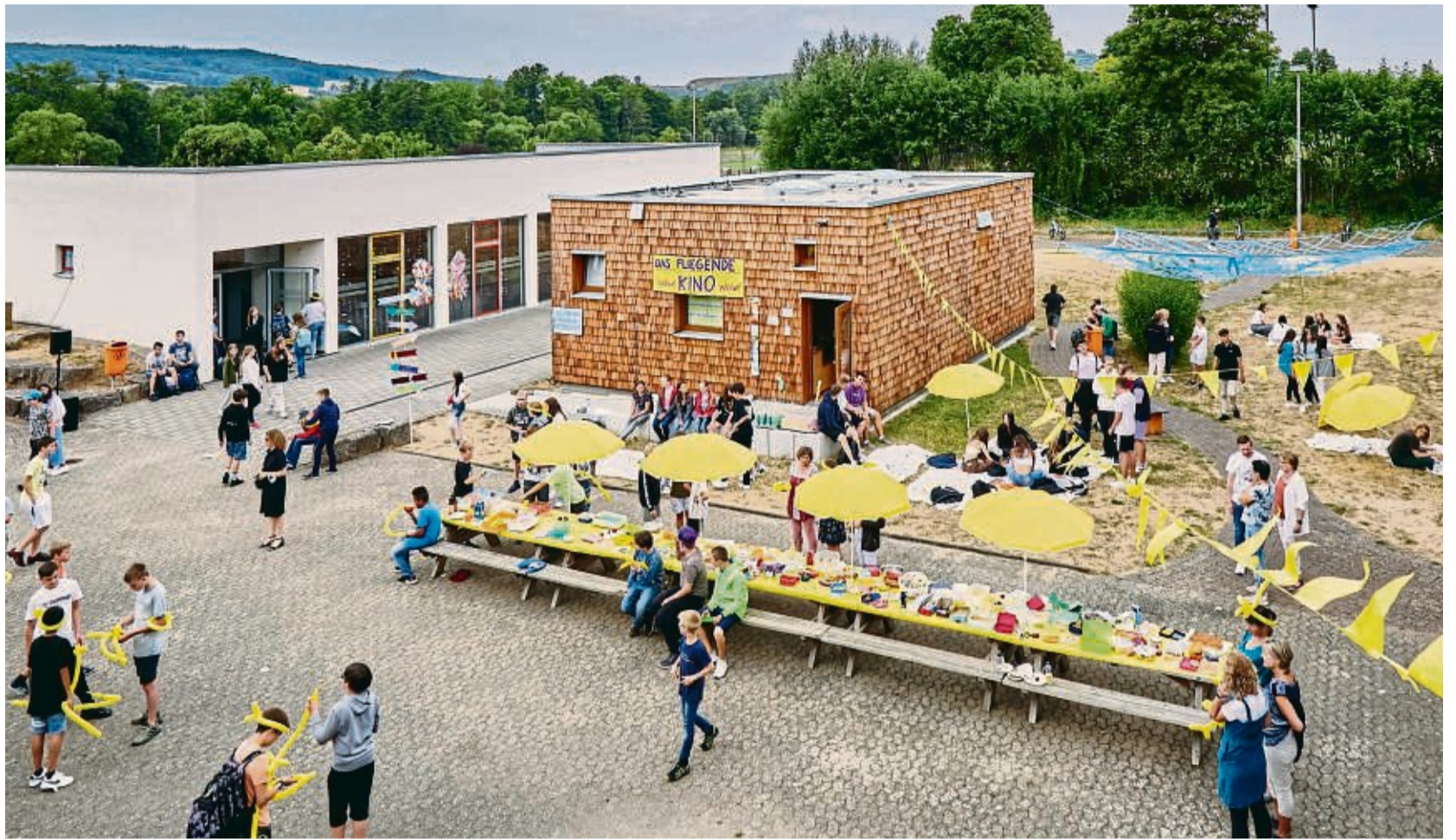
Das fliegende Künstlerzimmer ist hier am Standort Großenlöder an der Lüdertalschule zu sehen.