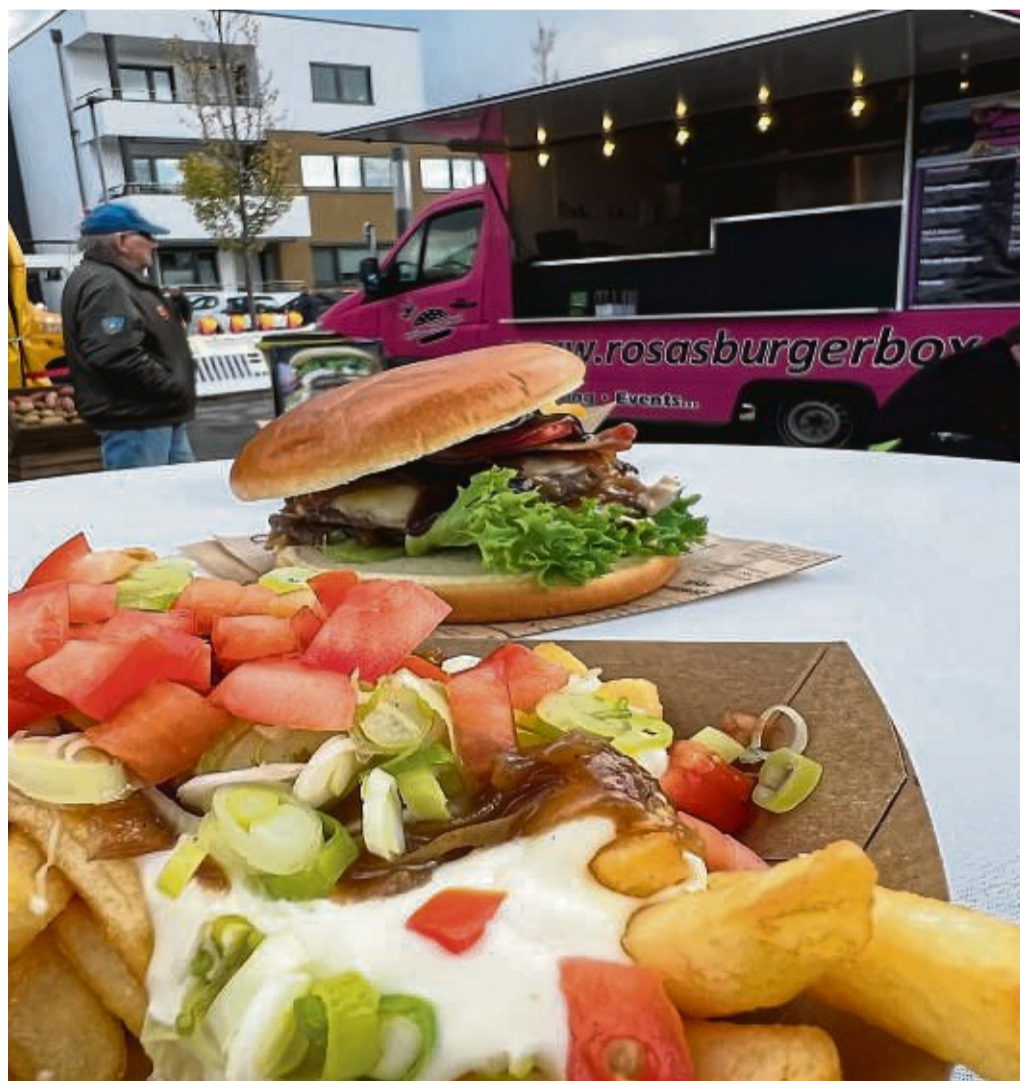
Die Besucher des Streetfood-Spektakels dürfen sich auf ausgefallene Kreationen freuen.

rund 25 weitere bunt gemischte Stände zusätzlich zu den geöffneten Geschäften für die Besucher geben. Ein Kinderprogramm für die kleinen Besucher mit verschiedenen Attraktionen rundet den Sonntag ab – somit steht einem spannenden Familienbesuch, bei dem jedes Mitglied auf seine Kosten kommt, nichts mehr im Wege. nh