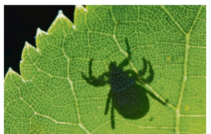
Zecken können Krankheiten übertragen, daher sollte man im hohen Gras besser lange Kleidung tragen und die Hosen in die Socken stecken.