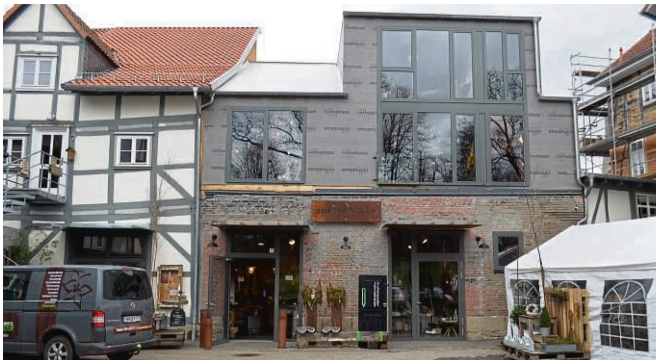
Nach der Sanierung wieder wie neu: Die Postscheune in Hann. Münden wurde nach der Brandkatastrophe 2021 renoviert.

„Die Postscheune hat schon ein bisschen was erlebt“, sagt Inga Hansen. Erst 2012 habe sie das Gebäude vor dem Einzug ihres Ge-