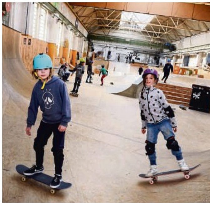
Skaten macht Spaß: Zusammen mit der Jugendförderung Hessisch Lichtenau gibt es im April einen Ausflug nach Kassel in die Skatehalle.

Let's talk about ist ein weiteres neues Format: Dabei geht es um Workshops zu verschiedenen Themen, mit Experten, die jede Menge Informationen für die Jugendlichen mitbringen. Erstes Thema wird am Freitag, 10. März, „Social media für Jugendgruppen“ sein. Mitmachen können Vereine, Organisationen und alle, die mit Jugend-