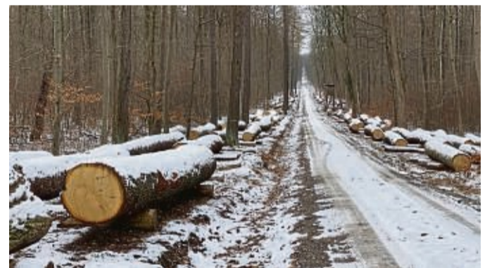
Wertholz- lager- platz Himmelsleiter bei Hedemünden: Das Holz wurde kürzlich versteigert.

Auf das Holz geboten haben in diesem Jahr 22 Bieter und dabei 5714 Gebote abgegeben. Mit einem Eichen- Durchschnittspreis hat sich