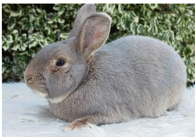
Die Luxkaninchen sind die beliebteste Kaninchenrasse Deutschlands.

chenrassen der Gesellschaft zur Erhaltung alter und gefährdeter Haustierrassen e.V. (GEH). Bei der Aktion „Rassekaninchen des Jahres“ wurden die Luxkaninchen nun zur beliebtesten Kaninchenrasse Deutschlands gewählt. Mit 14,8 Prozent der abgegebenen Stimmen siegten sie äußerst knapp vor den Japanern mit 14,2 Prozent und den Meißner-Widdern schwarz sowie den Rheinischen Schrecken mit jeweils 13,3 Prozent.