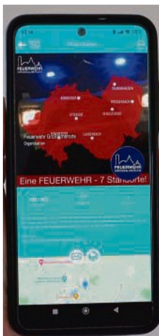
Mit der neuen Push-App erhalten Bürger schnell Informationen zu aktuellen Einsätzen.

Beim PR-Team handelt es sich um Feuerwehrleute, die als Schnittstelle zwischen der Feuerwehr und der Öffentlichkeit beziehungsweise der Presse fungieren. Sie werden ergänzend zu Einsätzen alarmiert. „Ich bin dann aber nicht unbedingt als ausgerüsteter Feuerwehrmann vor Ort, sondern in Zivil mit Warnweste und mache bei-