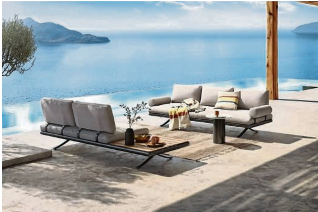
Weiche Stoffe und runde Formen verleihen dem auf geschwungenen Aluminiumfüßen ruhenden Outdoor-Sofa Eleganz.