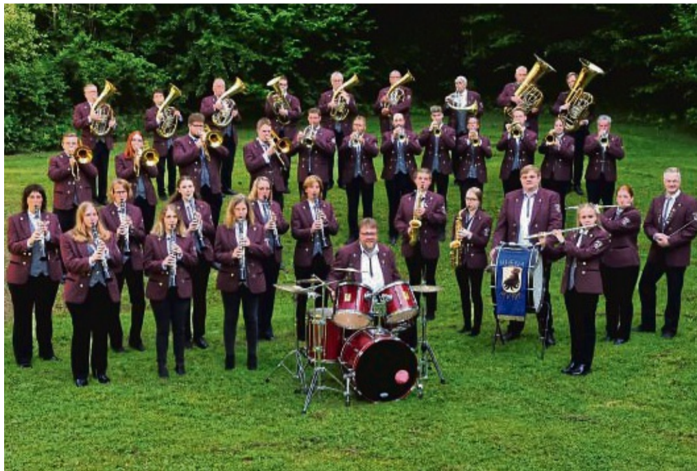
Zum Frühjahrskonzert „Best of Büschi“ lädt der Musikverein Rhena am 1. April ein. Karten sind bereits im Vorverkauf erhältlich.