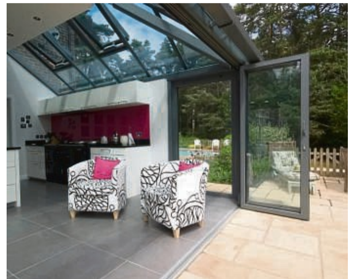
Falt-Schiebe-Systeme ermöglichen ein Öffnen und Schließen über bewegliche Fensterelemente.

Die Folge ist ein offeneres und naturnahes Wohn- und Lebensgefühl - unabhängig von der zur Verfügung stehenden Quadratmeterzahl - und eine freundlichere, einladende Atmosphäre mit größerem Wohlfühlfaktor. In diesem Zusammenhang avancierten Fenster in den vergangenen Jahren zu mehr als nur bloßen Luftdurchlässen. Längst sind sie ästhetisches Stilelement geworden, mit dem Architekten Räume und Fassaden ge-