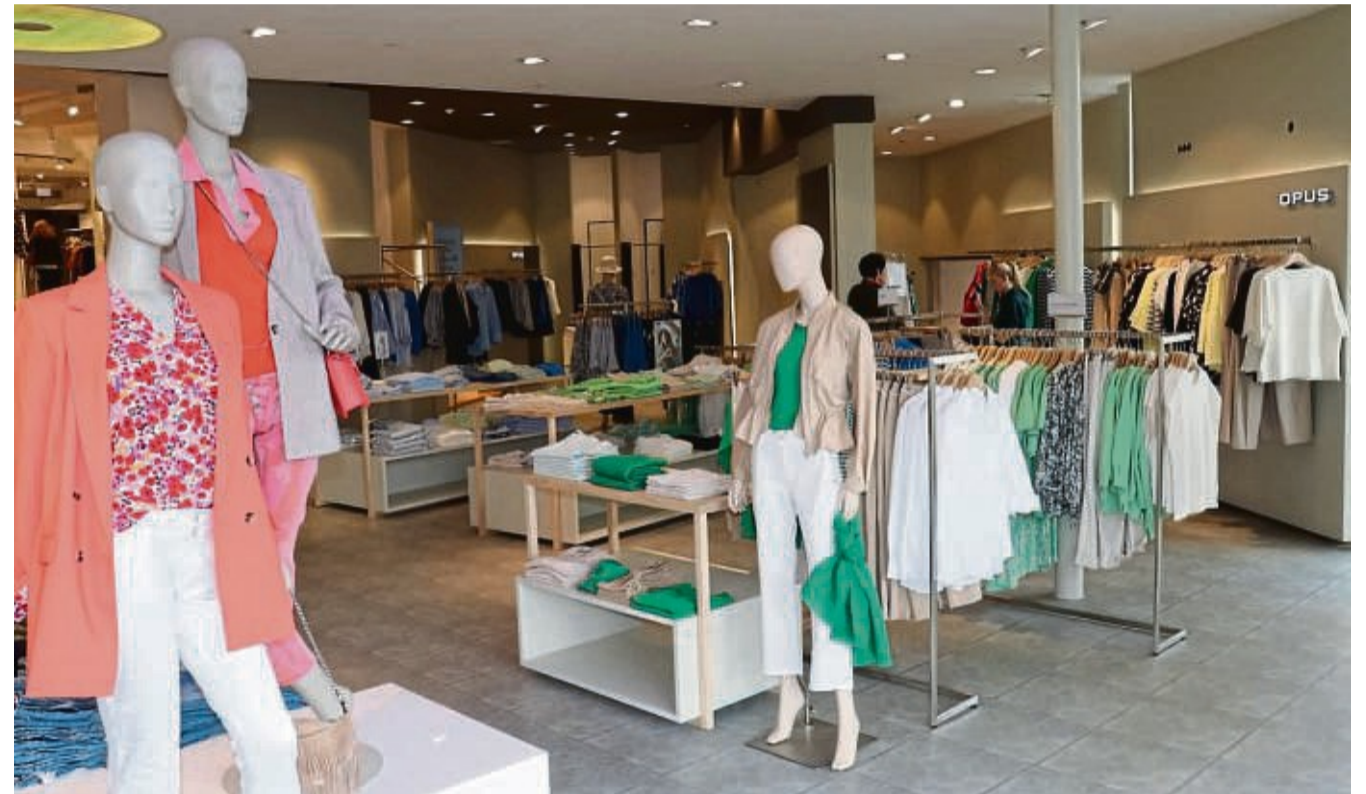
In Korbach wurde zudem der Eingangsbereich in der Tiefebene neu gestaltet. Die Marken Opus und Someday laden dabei in die besondere Welt der coolen Casuallooks ein.

In Korbach wurde zudem der Eingangsbereich in der Tiefebene neu gestaltet. Die der Marken Opus und Someday laden dabei in die