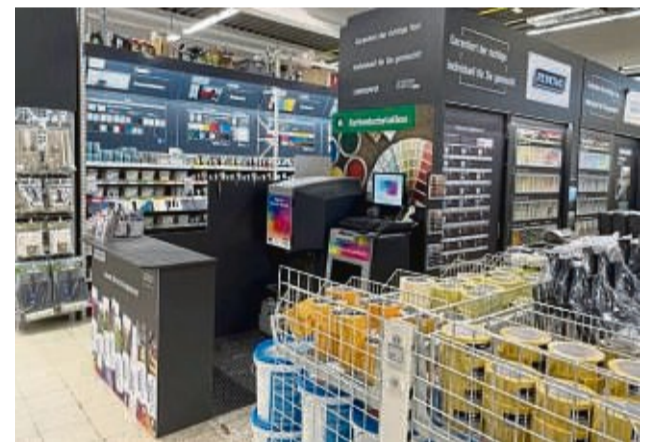
Der WERKERS WELT-Markt in Bad Wildungen, der von der Firma Müllenhoff GmbH geführt wird, hat ein neues Design sowie einen neuen Namen erhalten.

Die hagebau, die aus über 300 autonom agierenden Gesellschaftern besteht, hat Mitte dieses Jahres beschlossen, eine neue Dachmarke einzuführen. In diesem Zusammenhang werden alle WERKERS WELT-Standorte zu hagebau kompakt-Märkten. Neben den Baumärkten für Endkunden, hagebau kompakt und hagebaumarkt, betreibt die Kooperation auch Fachhandelsstandorte für gewerbliche