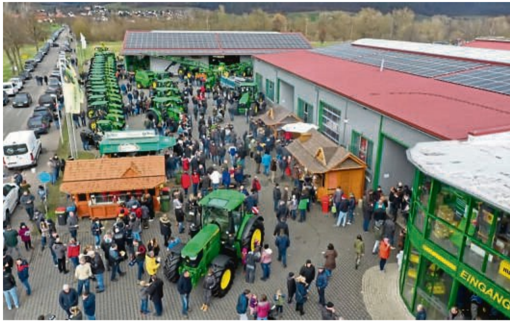
Eine erfolgreiche Landtechnik- und Gartentechnik-Ausstellung hat die Firma Hermann Wagener Landtechnik dem Publikum präsentiert.