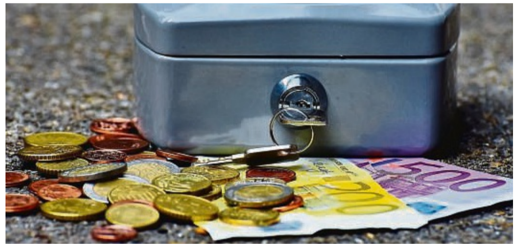
Das Stadt-Theater Meringhausen präsentiert ab 31. März die Krimikomödie „Das Oslo-Syndrom“ in der Stadthalle Meringhausen.