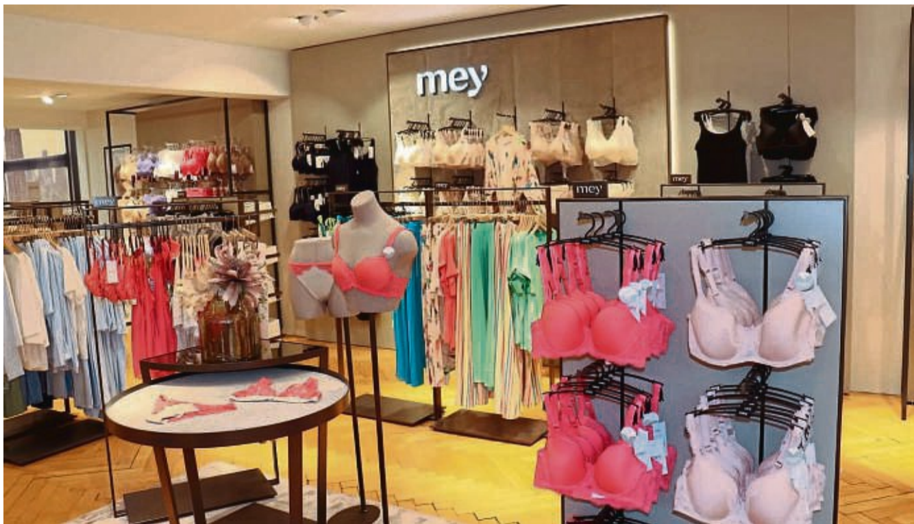
Eine besondere Fläche ist in der neuen Damenwäscheabteilung dem Wäschespezialisten Mey eingeräumt worden.

Die Kinderabteilung in Korbach hat ebenfalls eine neue Struktur erhalten. Dabei wurde die Hosenkompetenz erweitert und den styl-