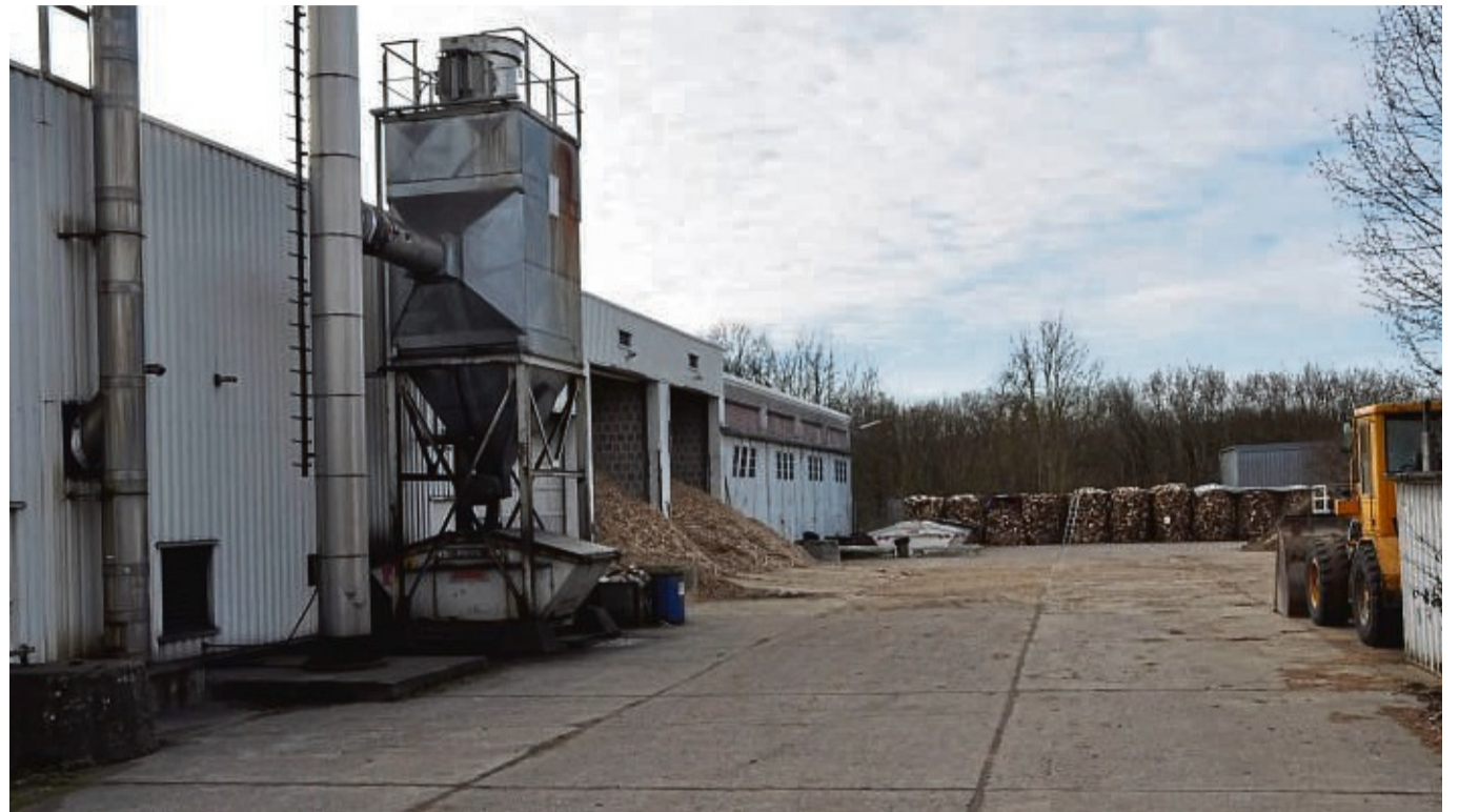
Von außen unscheinbar, aber im Kern die Lösung für viele Energieprobleme: Die Bad Arolser Nahwärme GmbH betreibt am Freizeitbad Arobella ein Heizkraftwerk, in dem das unbehandelte Holz gebrauchter Paletten verfeuert wird.