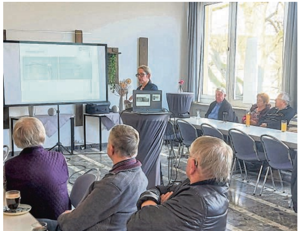
Lauschten gespannt dem Vortrag: Über 35 Teilnehmer informierten sich zu dem Thema „Wohnen in den eigenen vier Wänden, so lange wie möglich“.