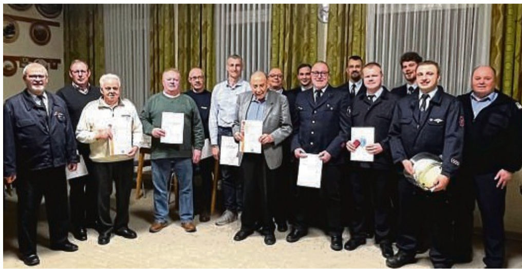
Freiwillige Feuerwehr Breitau traf sich zur Jahreshauptversammlung: alle geehrten und beförderten Mitglieder.

Die Bambini- und die Jugendfeuerwehr berichteten von einer schweren Zeit. Es war ihnen erst viel später als anderen Jugendabteilungen erlaubt worden, wieder Übungen durchzuführen. Mitgliederzahlen blieben jedoch stabil. Im Jahr 2023 werden vier Kinder von der Bambini- und Jugendfeuerwehr übernommen. Zurzeit üben bereits vier Jugendliche als Praktikanten mit der Einsatzabteilung. Für das Jahr 2023 wurde ein um-