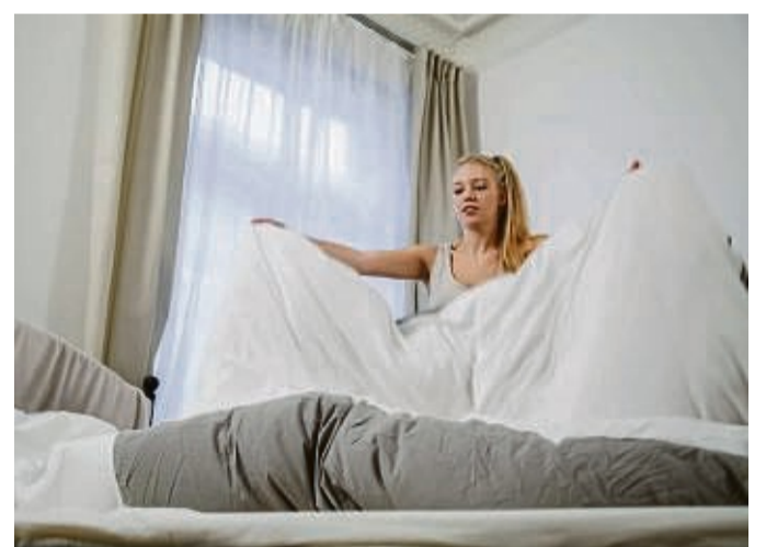
Die Mühe lohnt sich: Sich in ein frisch bezogenes Bett einzukuscheln, ist ein herrliches Gefühl.