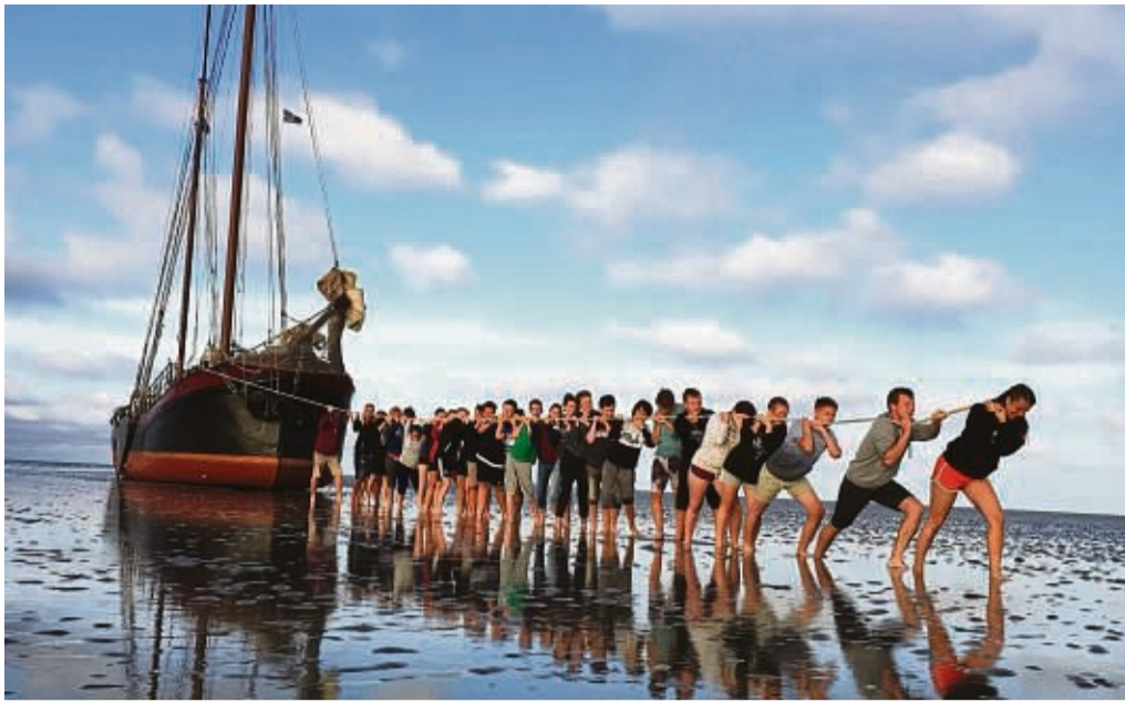
Unvergessliches Erlebnis: Jetzt kann sich für die Seegelfreizeit angemeldet werden.