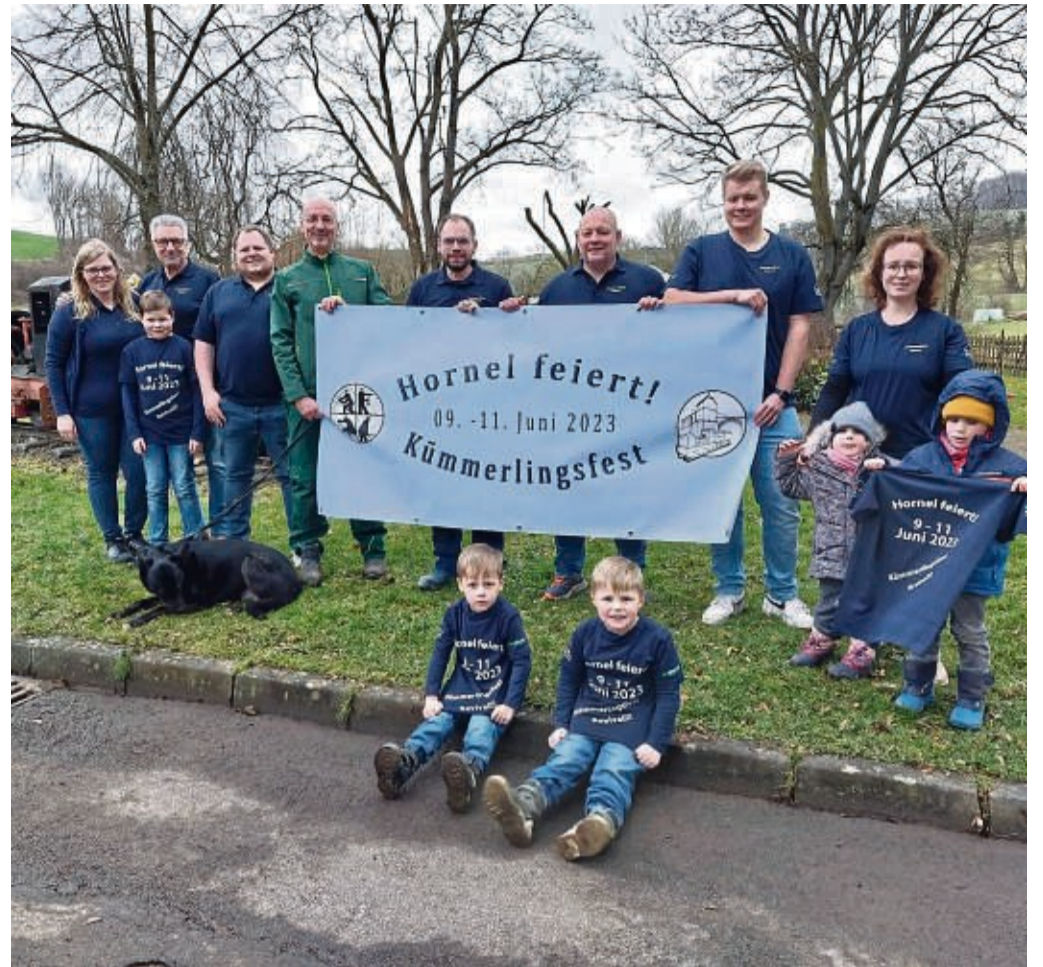
Freuen sich sehr: Der Festausschuss Hornel steckt schon voll in den Vorbereitungen.

Der Sonntag 11. Juni, beginnt ab 11 Uhr mit Frühstück und Unterhaltung mit der Showband „Die Stölzinger“. In der Mittagszeit wird, wie das gesamte Fest-