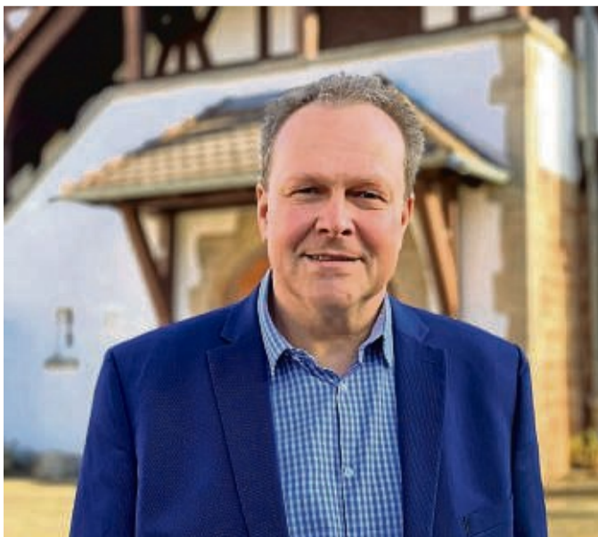
Thomas Mäurer wurde erneut zum Bürgermeister der Gemeinde Weißenborn gewählt.