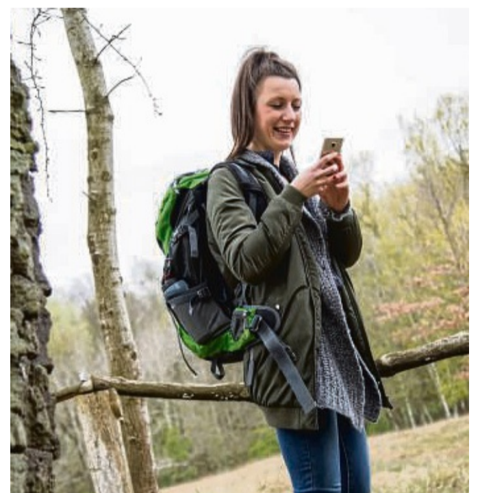
Ein Smartphone sowie Wanderschuhe oder Fahrrad sind nötig, um die Rätsel und Aufgaben auf den verschiedenen Routen lösen zu können.

Die Startpunkte der Routen sind in Bad Sooden-Allendorf