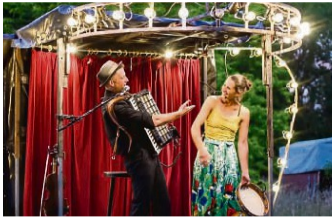
Tarantatá transportiert in ihren Auftritten die trunken ekstatische Energie süditalienischer Dorffeste.