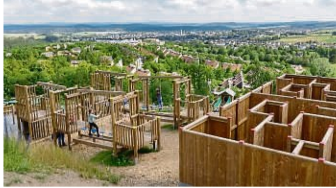
Abwechslungsreich sind die Indoor- und Outdoor-Angebote bei Center Parcs, wie hier am Aventura Spielberg.