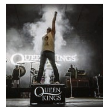
Heizen ein beim „Rock im Park“: Die Musiker der Gruppe „Queenkings“ spielen in Bad Wildungen Hits von „Queen“.

Fans von „Rock im Park“ hätten zuletzt immer wieder nachgefragt, wann denn wieder ein Rock-Festival steigt, sagt Martin. Möglich wird das nun durch eine Veranstalter-