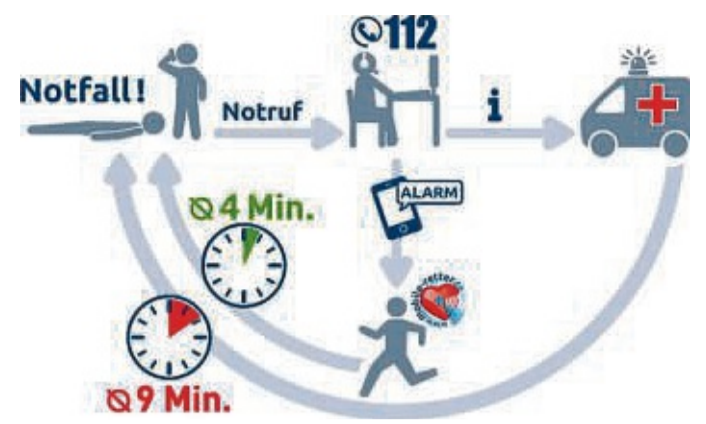
Das Schaubild zeigt die Alarmierung von Rettungsdienst und Mobilten Rettern.