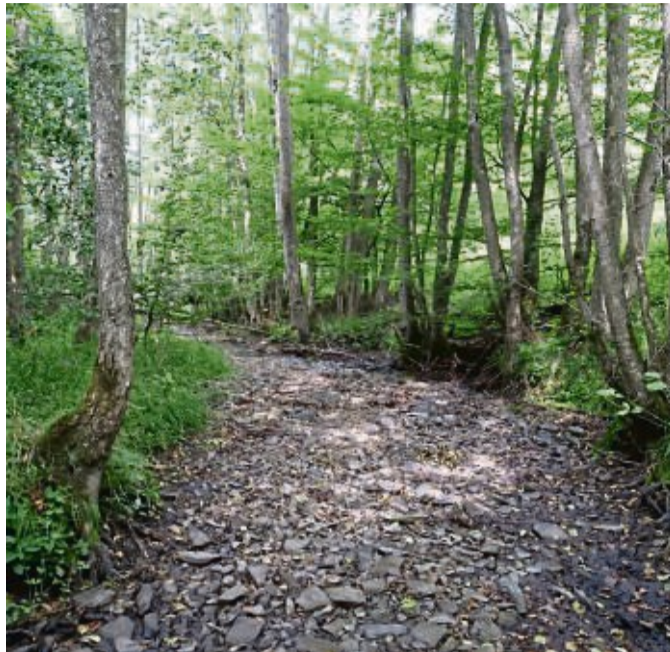
Die Banfe ist in den vergangenen vier Jahren streckenweise über mehrere Monate gänzlich trockengefallen. Rechts: Der selbe Bachabschnitt der Banfe sah in der Vergangenheit idealerweise so aus.

Das Extremjahr 2022 fiel dabei besonders ins Gewicht. Das Banfe-Keßbach-System