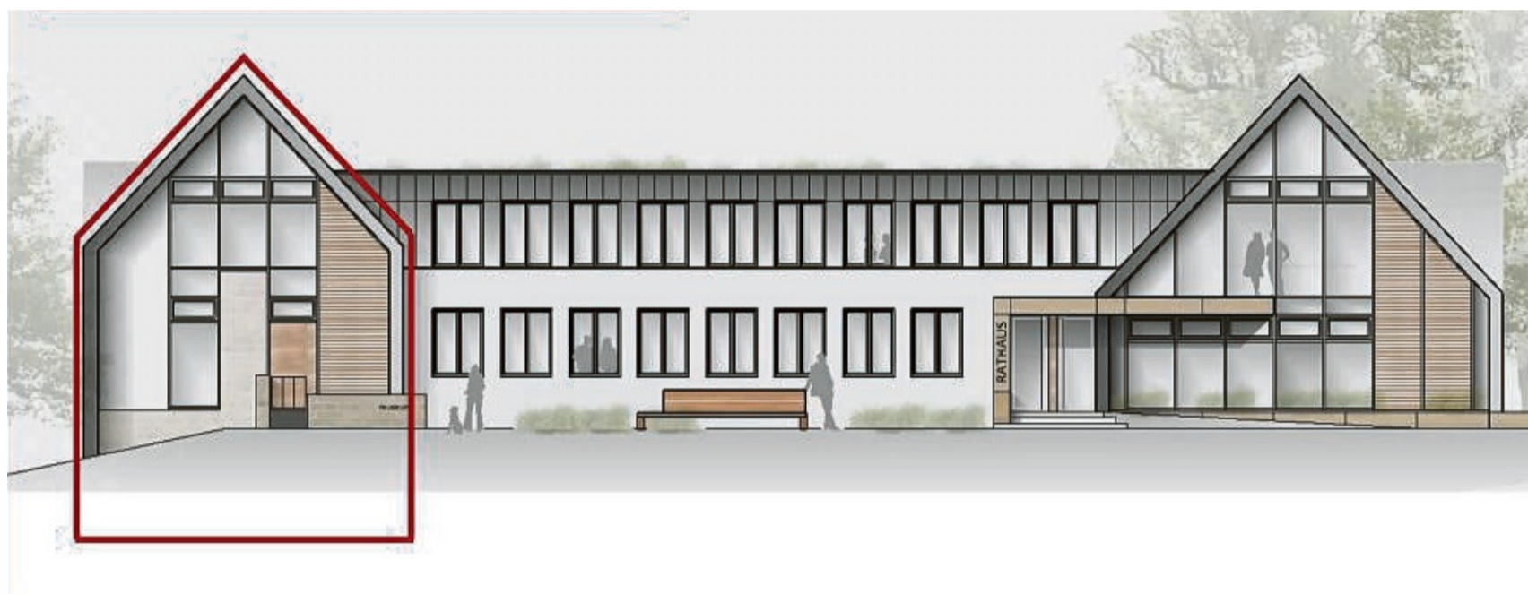
So schick könnte das Dorfgemeinschaftshaus Rhoden nach den Vorstellungen des Winterberger Planungsbüros Veldhuis aussehen: Die ehemalige Hausmeisterwohnung, links, könnte ein Satteldach bekommen. Der Mittelbau würde aufgestockt und mit einem Flachdach für Fotovoltaik versehen.