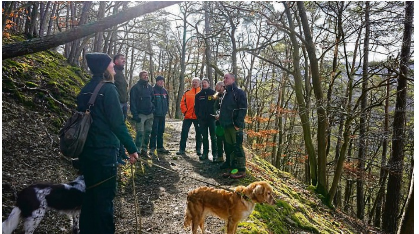
Unterwegs im Nationalpark: Auf der Daudenberg-Route untersuchten die Waldbesitzer der Nationalpark-Region an verschiedenen Stellen, ob es dort Gefahren gibt