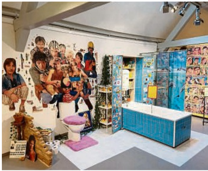
Klolektüre: Eine moderne Wunderkammer im Quellenmuseum der Wandelhalle lädt ein zu einer Zeitreise.

Zeitschriften, Bleistifte, Plastiktüten oder auch alte Filmplakate – es mag kaum etwas geben, das nicht von einem begeisterten Sammler gesammelt wird. Rings um das Wohnzimmer der Ausstellung tummeln sich daher allerlei Objekte, die im Zusammenspiel ein breites Spektrum des „Kuriosen Sammelns“ abbilden und sich thematisch in den Räumen der Wohnung verteilen. Ein Höhepunkt der Ausstellung ist die besondere Präsentation des Porzellan- und Puppenachlasses der Bad Wil-