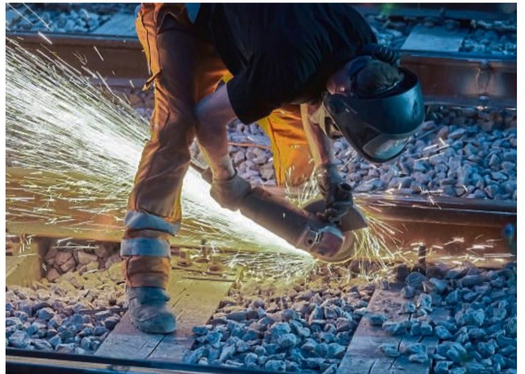
Die Modernisierung von Weichen, Gleisen und Signaltechnik sowie die Sanierung einer Brücke sind in Waldeck-Frankenberg geplant.

Wir freuen uns auf Ihre Rückmeldung unter Telefonnummer 0173-2987197 oder 0170-8824111 Facility Management, JurVik GbR, Wächterstraße 22, 34471 Volkmarsen.