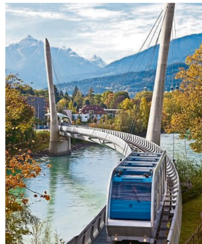
Die Berge so nah: Mit der neuen Hungerburgbahn geht es aus dem Zentrum Innsbrucks in Richtung Nordketten-Massiv.

Die zweieinhalb Stunden auf dem Fluss gehen schnell vorbei. Actionreich war das Unterfangen nicht, aber entspannt und mit neuem Wissen über die Geschichte Innsbrucks steigen die Gäste über die Gummiwülste des Bootes an Land. An einer schmalen Treppe zwischen Büschen, auf der Höhe des Olympischen Dorfes, zerren sie das Schlauchboot mit vereinten Kräften auf festen Boden. Stadtführung und Outdoor-Spaß - das Innsbrucker „City Rafting“ verbindet beides.