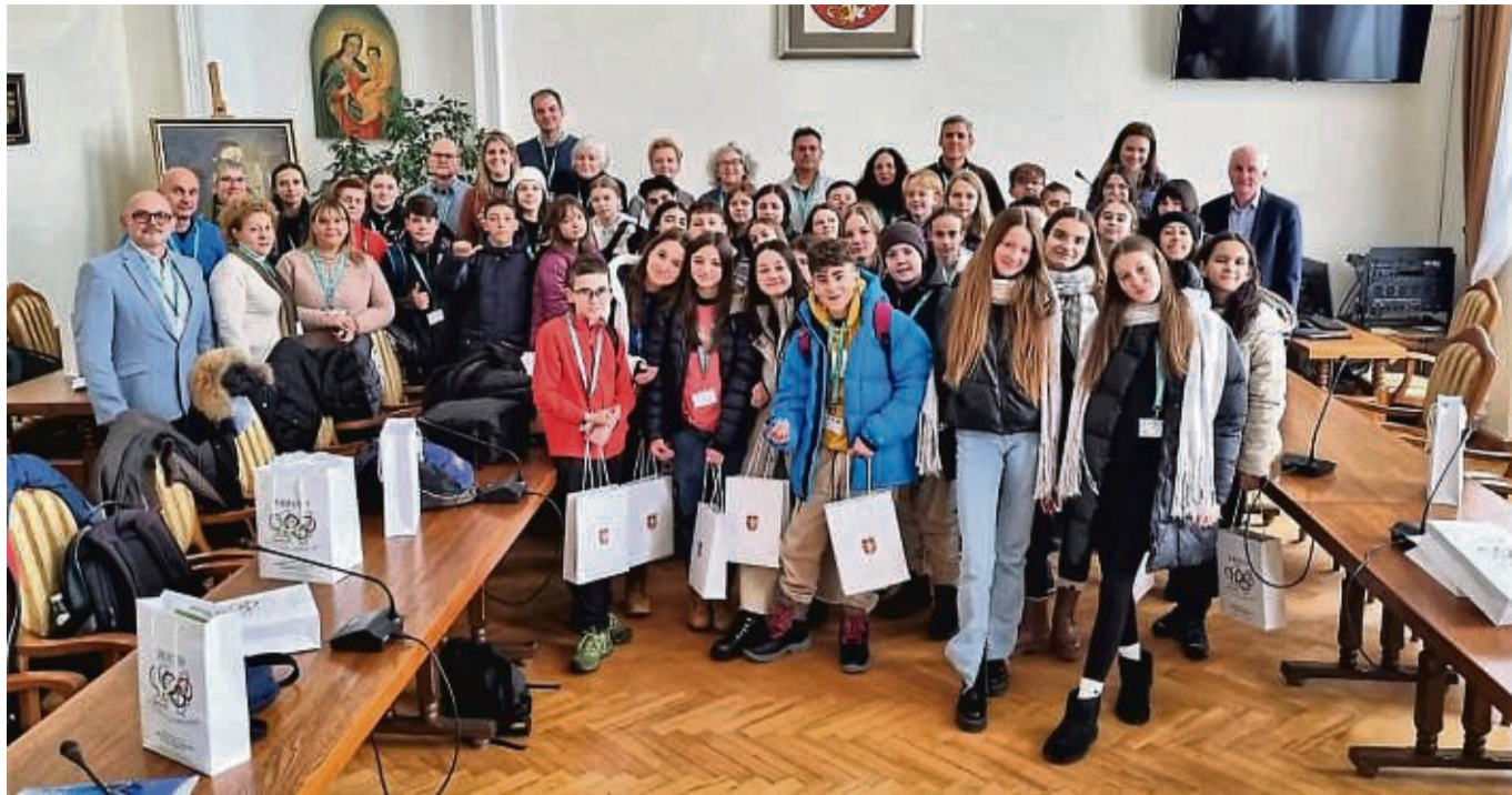
Empfang im Rathaus: Krosnos Bürgermeister begrüßte die Teilnehmer des Erasmusausstausches.