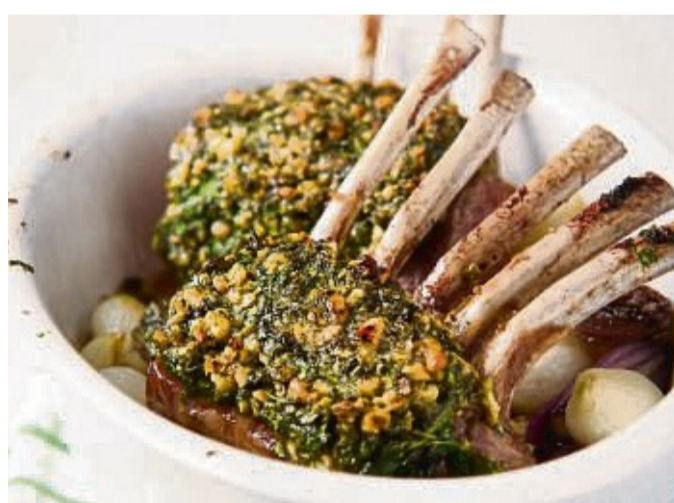
Ein Genuss zum Osterfest: Knusprig wird das Lammfleisch durch die Kräuter-Nuss-Kruste.

Das Fleisch aus dem Kühlschrank nehmen und von der oberen Fettschicht befreien. Die Lammkarrees in einer Pfanne kurz von allen Seiten anbraten. Die Karrees salzen und pfeffern und auf ein