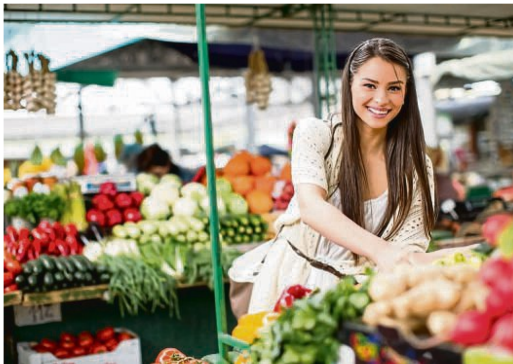
Frisches vom Markt: Regionale und frische Produkte gibt es in Hülle und Fülle von Direktvermarktern.

Und irgendwann lagern die alten Sachen ganz hinten, auch in der Tiefkühltruhe“,