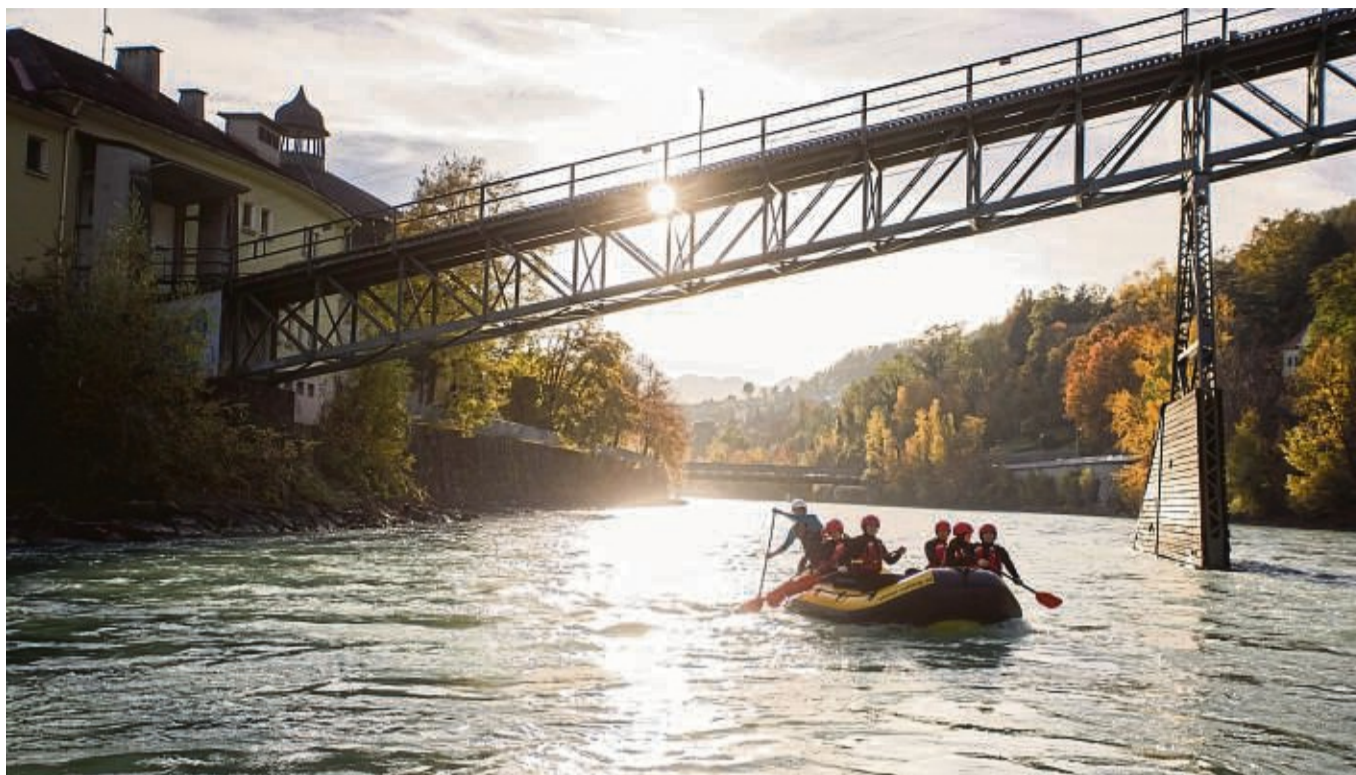
Auf der Schlauchboot-Tour geht es auch unter der historischen Brücke der 2005 stillgelegten, alten Hungerburgbahn hindurch.

Auf dem Wasser hält man Distanz zu Stress und Hektik, zu Lärm und Gerüchen. Ein Feeling, das bald auf die Rafting-Gruppe übergreift - zumal an diesem Tag kaum