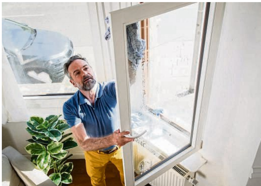
Wenn es wieder länger hell bleibt, sollte man das Tageslicht auch in die Wohnung lassen – indem man die Fenster vom Winterdreck befreit.

Wichtig ist vor allem eines: Stress ist dabei fehl am Platz! Hat man den Kopf nicht frei und ist beim Putzen noch unter Zeitdruck, fehlt es einem erst recht an Motivation. Man sollte einen Tag wählen, der einem gut passt. Ohne Termine, ohne Verpflichtungen. Dazu würde ich mir auch meine Lieblingsmusik anmachen. Irgendwas Flottes, wo man sich gern dazu bewegt.