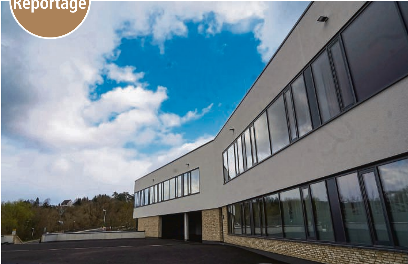
Die neue Kreissparkasse: Moderne Architektur fügt sich harmonisch ins Stadtbild ein.