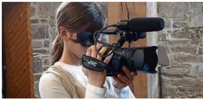
Film ab: Die Bewerbungsphase für das erste Niedersteiner Kurzfilm-Fest „Abgedreht auf dem Land“ ist gestartet.

Niederstein – Die Bewerbungsphase für das Projekt „Abgedreht auf dem Land“ läuft: Schulen, Vereine, Jugendorganisationen und Einzelne aus dem ländlichen Raum Nordhessens können ab sofort Kurzfilme einreichen. Es gibt Geldpreise und „den Roten Film“ zu gewinnen, heißt es in der Mitteilung des Kulturvereins Bulliwood aus dem Niedersteiner Stadtteil Metzger.