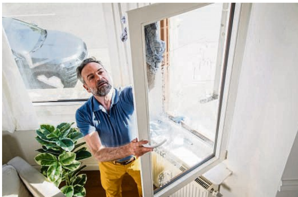
Wenn es wieder länger hell bleibt, sollte man das Tageslicht auch in die Wohnung lassen – indem man die Fenster vom Winterdreck befreit.

Man sollte einen Tag wählen, der einem gut passt. Ohne Termine, ohne Verpflichtungen. Dazu würde ich mir auch meine Lieblingsmusik anmachen. Irgendwas Flot-