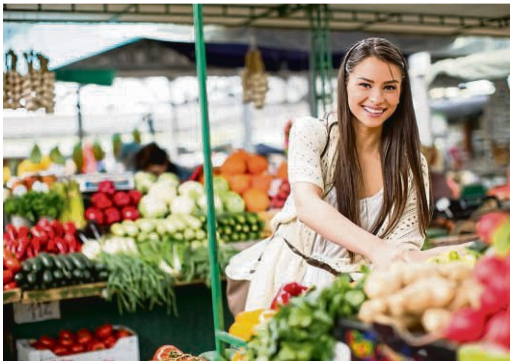
Frisches vom Markt: Regionale und frische Produkte gibt es in Hülle und Fülle von Direktvermarktern.