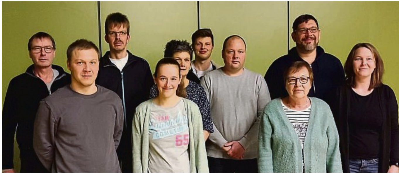
Der Vorstand des MC Sachsenberg wurde in der Jahreshauptversammlung gewählt.