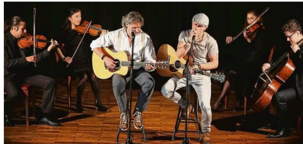
Das „Duo Graceland“ wird in diesem Jahr das Korbacher Altstadt- und Kulturfest musikalisch mit Songs von Simon & Garfunkel eröffnen.

anstaltung als Sponsoren. Das Altstadt-Kulturfest findet von Donnerstag, 29. Juni, bis Sonntag, 2. Juli, statt und bietet ein abwechslungsreiches Programm für alle Altersgruppen. Die Besucher erwartet ein Wochenende voller Musik, Kunst und Kultur in der malerischen Kulisse der Altstadt. Karten sind ab sofort bei der Korbach-Info sowie an allen bekannten Vorverkaufsstellen erhältlich. Der Eintritt beträgt 30 Euro. red