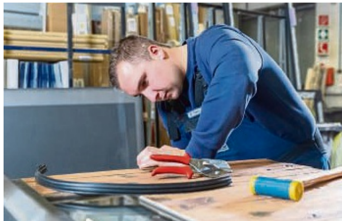
...mit Spaß und Know-how.