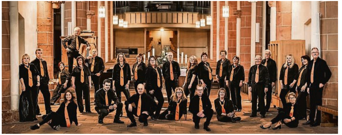
Vorfreude auf ein großes Konzertereignis: Nach langer Corona-Pause holt der Burgwalder Chor „Happiness“ (Foto) sein Jubiläumskonzert zum 25-jährigen Bestehen am 6. Mai gemeinsam mit dem Gastchor „Trendsingers“ nach. Weil die Nachfrage so groß war, wurde es in die Liebfrauenkirche verlegt, wo auch dieses Foto entstand.