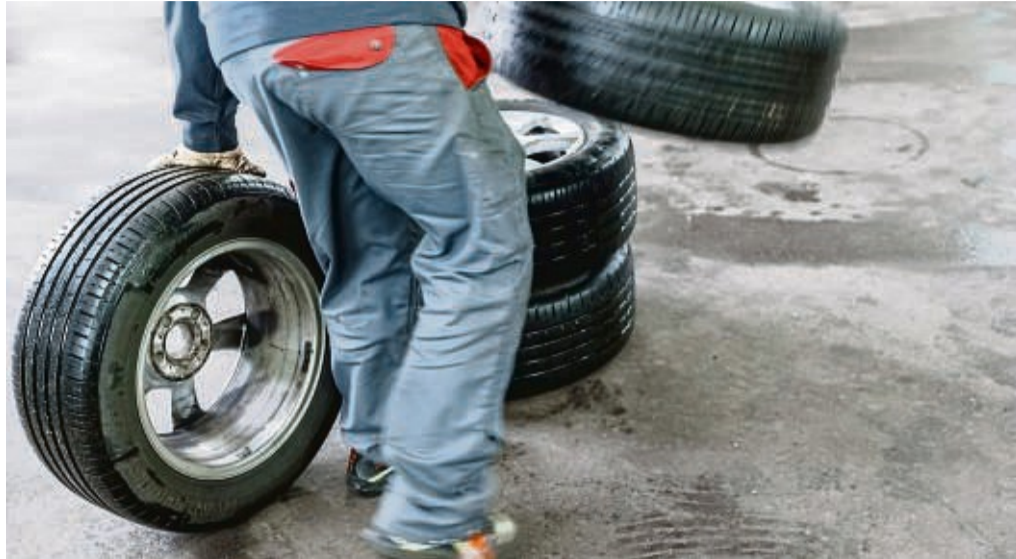
Beim Reifenwechsel lohnt ein kurzer Check der Pneu, um mögliche Pannen und Unfälle zu vermeiden.

Ein Blick gilt auch dem Profil: Gesetzlich sind zwar nur mindestens 1,6 Millimeter Profiltiefe vorgeschrieben. Doch Dekra rät bei Sommerreifen zu mindestens drei, bei