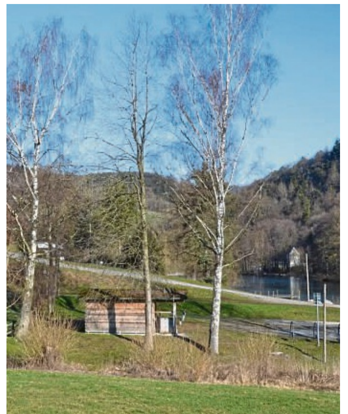
Eine Wanderhütte soll beim Bömighäuser See entstehen. Die Grillstation müsste weichen.