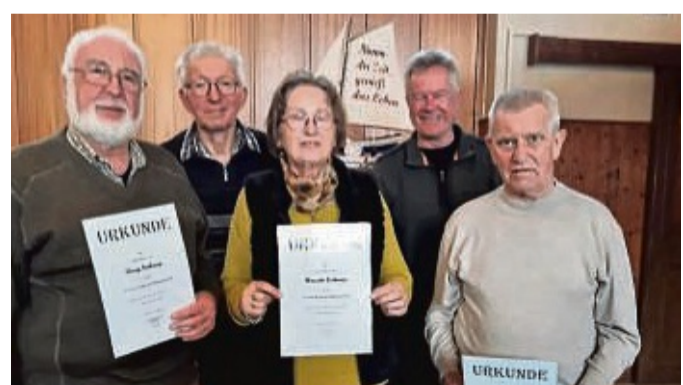
Geehrt: Diese Mitglieder erhielten Urkunden für zehn Jahre treue Mitgliedschaft.