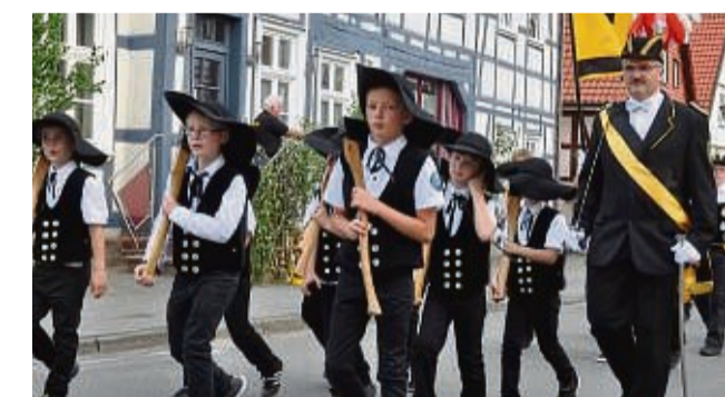
Nachwuchs für Traditionsgruppen: Kinder-Sappeure beim Schützenfest 2015 in Rhoden.

Jetzt soll die ungewöhnlich lange Wartezeit zwischen den Freischießen mit einem Aktionstag für Kinder und Jugendliche überbrückt werden. Dazu sind alle zwischen 10 und 18 Jahren eingeladen, die Schützengesellschaft am Samstag, 29. April, ab 15 Uhr bei einem Spiel ohne Grenzen kennenzulernen. Für die Gewinner des sportlichen Wettkampfes hat die Schüt-