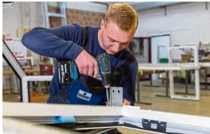
Präzision will gelernt sein – beim Handwerk...

Ausbildung im Familienunternehmen Pistorius hat Tradition