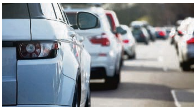
Verkehrsalarne warnen vor Gefahr, etwa einem Unfall, einem liegen gebliebenen Fahrzeug, einem Stau oder einer verschmutzten Fahrbahn.

Die viel beschworene Verkehrswende in Deutschland ist bislang reine Theorie – tatsächlich steigt die Zahl der Pkw von Jahr zu Jahr. Anfang 2022 waren hierzulande nach Angaben des Kraftfahrt-Bundesamtes (KBA) knapp 48,5 Millionen Autos zugelassen, fast 300 000 mehr als Anfang 2021. Eine der Konsequenzen sind endlose Staus. Münchner Autofahrer beispielsweise standen 2022 durchschnittlich 74 Stunden im Stau, dicht dahinter folgen die Metropolen Berlin und Hamburg. Das Verkehrsgeschehen wird demnach immer mehr zu einer Herausforderung. Für mehr Sicherheit können Verkehrsalarne sorgen. Das sollte man dazu wissen: