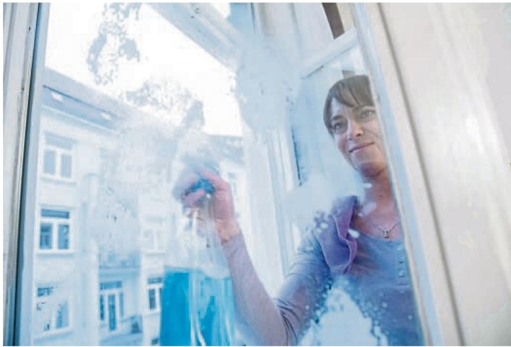
Wer seine Fenster regelmäßig putzt und pflegt, kann ihre Haltbarkeit verlängern.

Handelt es sich um einen Metall- und Kunststoffrahmen, raten die Experten dazu, einen Neutralreiniger und einen Schwamm oder