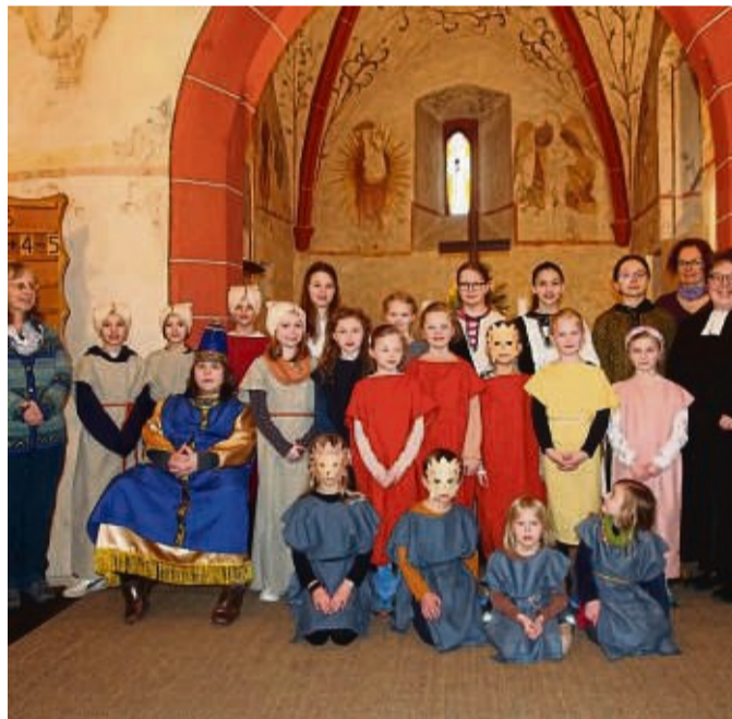
Der Kinderchor Schwalmpforte führte in der Kleinengliser Kirche das Kindermusical „Daniel in der Löwengrube“ auf.

eingübt und so die vielen Gottesdienstbesucher begeistert. red