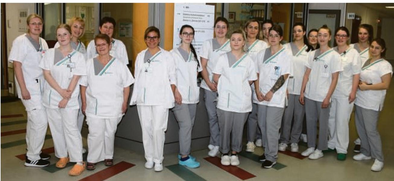
Man wächst mit seinen Aufgaben: Man wächst mit seinen Aufgaben: Drei Wochen lang sind die Pflegeschülerinnen für einen Teil der Station verantwortlich – immer unterstützt von Ausbilderinnen und Stationsmitarbeitenden.

Drei Wochen lang leiten Pflegeschüler:innen eine Station