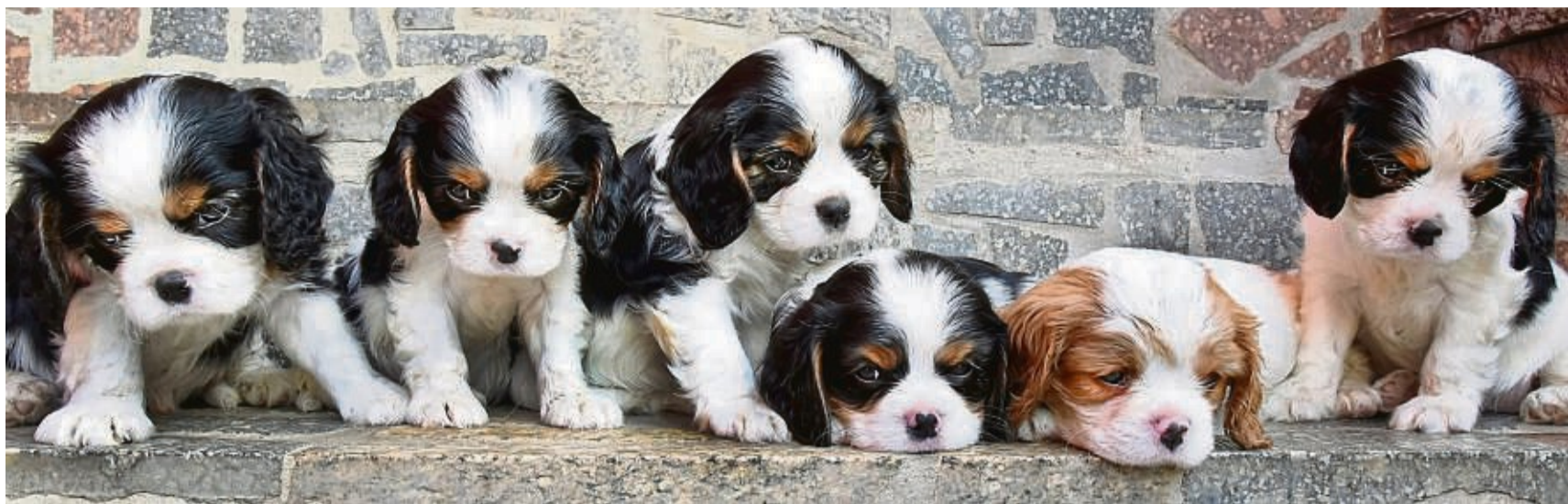
Wenn die Rasse entschieden ist, dann steht wieder eine Wahl an: Welcher Welpe aus dem Wurf ist geeignet?

„Bevor ich mir einen Welpen aussuche, muss ich mich als Erstes fragen: Welcher Hund passt zu meiner Lebenssituation?“, appelliert Autor Vogt („Typgerechtes