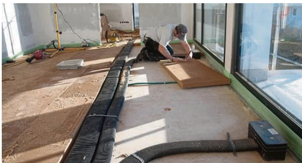
Die Zuluftleitungen für eine zentrale Lüftung werden im Fußboden verlegt.

Daher sind Lüftungsanlagen in Neubauten oft schon Standard und selbst in Altbauten können sie nötig werden. „Wer heute neu baut oder aufwendig energetisch