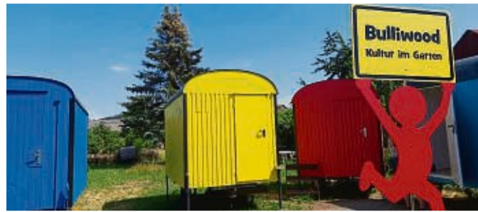
Das Sommerprogramm des Bulliwood Kulturgartens in Metze steht fest.

„Kuchenpicknick:“ Im Kulturgarten findet an einigen Sonntagen ein Kuchenpicknick statt, so zum Beispiel am Sonntag, 23. April, ab 15 Uhr, am Sonntag, 4. Juni, ab 15 Uhr und am Sonntag, 16. Juli, ab 15 Uhr. Die Picknicks finden im Garten in Metze statt. In lockerer Atmosphäre trifft man sich zum Schnuddeln und Kuchen essen. Kuchen und Geschirr selbst mitbrin-