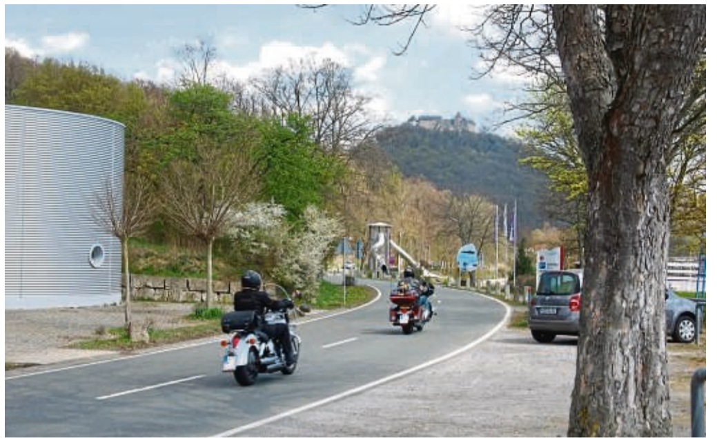
Wenn die Motorradsaison startet, soll es laut Polizei häufige Kontrollen vor allem am Edersee und am Diemelsee geben.

Im Jahr 2022 ereigneten sich nach Auskunft von Hessen-Mobil 137 260 Straßenverkehrsunfälle im Land. Gegenüber dem Vorjahr bedeutete dies einen Anstieg um fünf Prozent. Die Zahl der Unfälle mit Personenschäden mit knapp 19 200 (plus 11,4 Prozent) folge diesem, in der Zeit nach der Corona-Pandemie, generell wieder ansteigenden Trend in der Unfallstatistik. Auch die Zahl der tödlich verunglückten Personen im hessischen Straßenverkehr ist laut der Verkehrsbehörde 2022 gestiegen. 208 verkehrstote bedeuten eine Zunahme von 12 Prozent. „Nicht selten passieren solche Unfälle gleich zu Beginn der Motorradsaison, wenn sich andere Verkehrsteilnehmer mitunter noch nicht wieder auf Zweiräder im Straßenverkehr eingestellt haben oder es bei den Motorradfahrerinnen und -fahrern nach der Winterpause an Fahrpraxis mangelt“, heißt es in der Pressemitteilung des Polizeipräsidiums. So hätten im Jahr 2022 sieben Motorradfahrer auf nordhessischen Straßen tragischerweise ihr Leben verloren, vier davon zu Beginn der Saison. Deswegen wolle die Polizei frühzeitig auf die Gefahren für Zweiräder im Straßenverkehr hinweisen und allen Verkehrs-