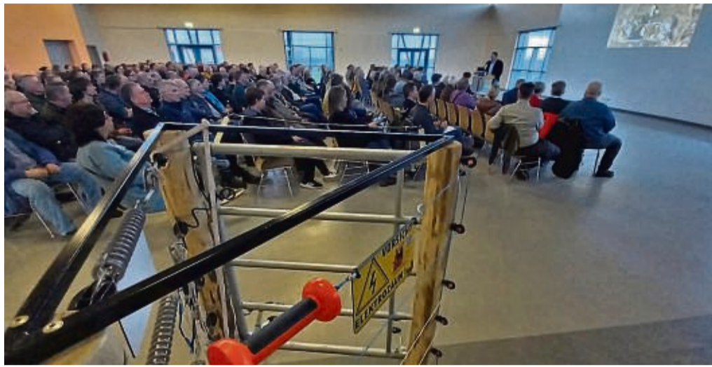
Voll besetzt war beim Thema „Herdenschutz gegen Wölfe“ die Kelleralldorfhalle.