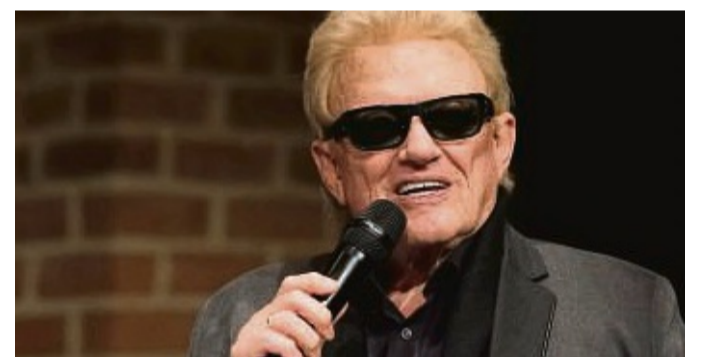
Heino gastiert am 13. Mai in Volkmarshen.