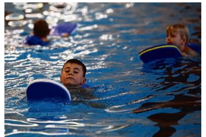
In Kursen ans Wasser gewöhnen: Schwimmen zu können ist für Kinder sehr wichtig.