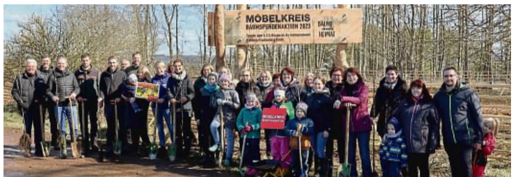
Folgenden Bäume wurden gepflanzt: 1.550 Douglasien, 1.550 Küstentannen, 1.300 europ. Lärchen, 1.100 Roteichen, 325 Spitzahorne, 325 Kirschbäume, 25 Feldahorne, 100 Elsbeeren, 50 Mammutbäume. Weitere Informationen zum Thema Nachhaltigkeit im Möbelkreis unter www.moebelkreis.de.

Pünktlich um 11 Uhr trafen sich am Montag, den 3. April die fleißigen Unterstützer in der Meininghäuser Gemarkung, um den ersten Teil der Setzlinge in die Erde zu bringen. Selbst die kleinsten Helferinnen und Helfer waren begeistert und konnten sich bei Sonnenschein aktiv am Klimaschutz beteiligen. Ne-