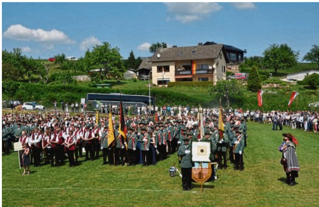
Antreten zum Freischießen: Die Schützengilde 1593 bereitet sich auf das Fest am Pfingstweekenende vor; im Bild der Aufmarsch beim letzten historischen Festreigen im Mai 2018.

Zahlreiche auswärtige Vereine werden am Pfingstsonntag zum großen Festzug erwartet, der sich vom Sportplatz aus in Bewegung setzt. Dabei präsentiert sich die 430 Jahre alte Schützengilde mit allen Gruppen. Derzeit sind fast 240 Mitglieder in der Männerkompanie eingeschrieben. Burschen- und