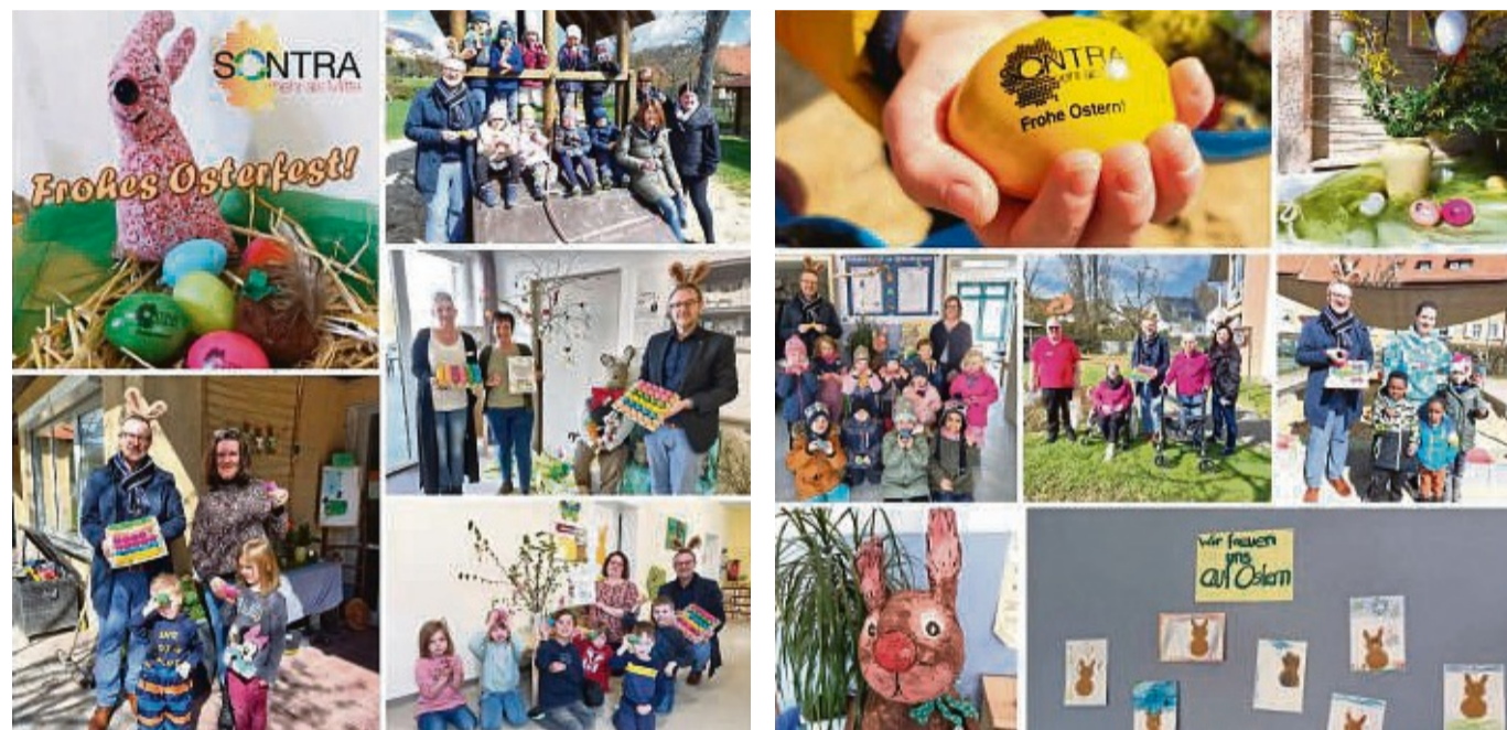
Stadt bedankt sich: Ostergrüße der Stadt Sontra an die sechs Kindertagesstätten und an beide Seniorenpflegeheime.