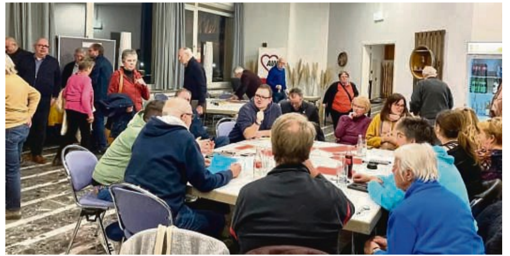
Erausgearbeiteten Anregungen: Bei der Auftaktveranstaltung zum Quartierprojekt waren Ideen erfragt.

Der Quartiermanager war das Thema am zweiten Tisch. Diese Person an der Spitze des Projekts müsse der Ideengeber und Motor bei der Entwicklung des Quartiers sein. Für das Vorhaben in Sontra wurde ein Bürgerbus ange-regt, für den sich der Quartiermanager stark machen sollte. Dieses Fahrzeug könn-