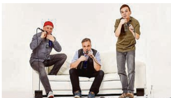
Europas führende Pfandwerker: So bezeichnen sich GlasBlasSing selbst.

Glück teilen, um es zu multiplizieren – wie ertragen das Mathematiker? Kann man auf der Bühne wirklich ein Glücksrad über die Songreihenfolge entscheiden lassen? Ist eine bis zur Mitte gefüllte Bierflasche halb voll oder halb leer? (Antwort: Weder noch. Es ist ein Cis.) „Happy Hour“, das ist nicht nur eine, das sind knapp zwei Stunden akustische Wonnen, erzeugt