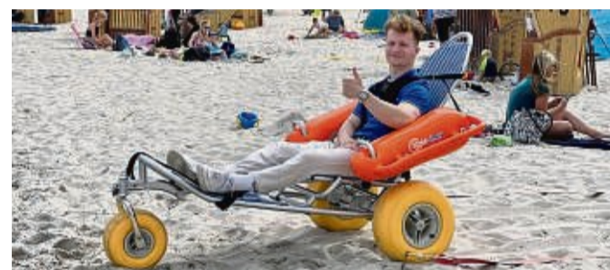
An drei der schönsten Strände der Eckernförder Bucht stehen spezielle Strand-Rollis für Menschen mit Behinderung parat.

Auf die Bedürfnisse von Menschen mit Behinderung hat sich die Eckernförder Bucht eingestellt. Sie gilt als eine besonders schöne Region an der Ostseeküste Schleswig-Holsteins. Zentrum ist die lebendige Hafenstadt Eckernförde mit ihrem maritimen Flair, sie liegt nur wenige Autominuten von Kiel entfernt. An drei der schönsten Strände sind spezielle Strand-Rollis verfügbar und Strandkörbe, die man über eine Rampe erreichen kann. Von Mai bis September sind zudem zwei Holzrampen fest installiert, die zu den Einstiegstrepfen am Wasser führen, einem