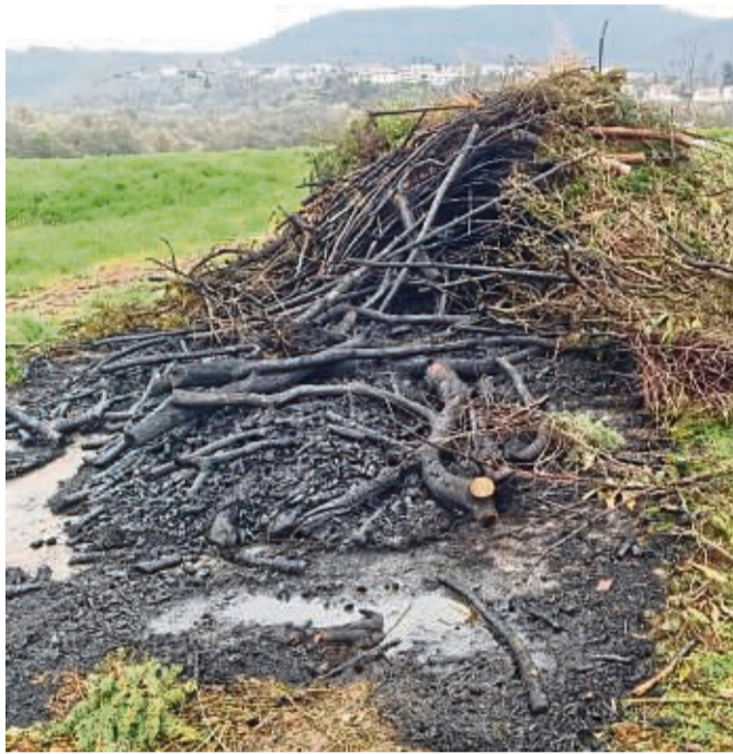
Abgebrannt: Unbekannte hatten den Osterfeuerhaufen in Grebendorf in der Nacht auf Samstag angezündet.