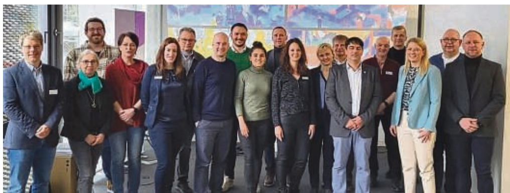
Die Digitalisierung in der Arbeitswelt war Thema eines „Tags der Ausbildung“ im Werra-Meißner-Lab. Das besondere Angebot machten möglich die Arbeitsagentur Kassel, die Wirtschaftsförderung Werra-Meißner und die IHK Kassel-Marburg.

Eschwege – Wie sieht die Arbeitswelt von morgen aus? Was bedeutet die Digitalisierung für Jugendliche, die demnächst ins Berufsleben starten wollen? Drängende Fragen, die ein „Tag der Ausbildung“ im Werra-Meißner-Lab in Eschwege mit vielen Informationen zu beantworten half. Unter dem Titel „Digitale Berufe im Wandel“ thematisierten die Agentur für Arbeit Kassel, die Wirtschaftsförderung Werra-Meißner-Kreis und die IHK Kassel-Marburg die zukünftige Berufswelt, ihre Herausforderungen und Chancen im Rahmen der bundesweiten Aktion „Woche der Ausbildung“.