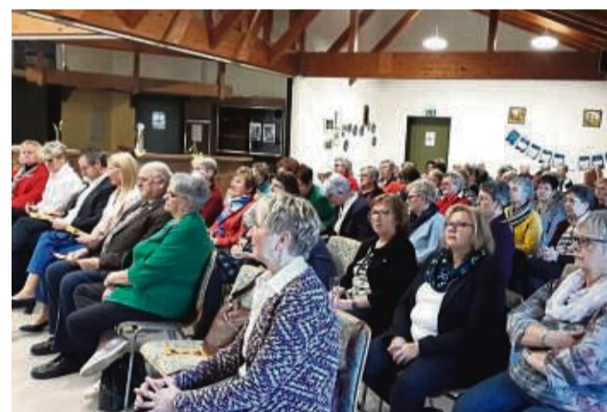
Neujahrsempfang der Bezirkslandfrauen: Insgesamt 165 Frauen nahmen an dem Treffen teil.