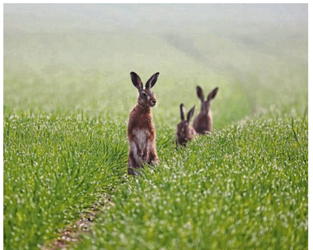
Gelten als Boten des Frühjahrs: die Feldhasen. Denn die Tiere sind die ersten im Jahr, die ihre Jungen bekommen. Ihre Population steigt auch im Werra-Meißner-Kreis wieder an. Das haben auch jüngste Wildzählungen ergeben.

Die Jägerschaft versuche, so Stelzner, durch Lebensraumverbesserungen in den Feldmarkungen diesem Trend entgegenzusteuern. Ziel dieser Hegemaßnahmen ist es, Feldhasen, Rebhühner, aber auch Feldlerchen als Symboltiere einer artenreichen Feldflur zu erhalten, damit der Anblick eines Hasens,