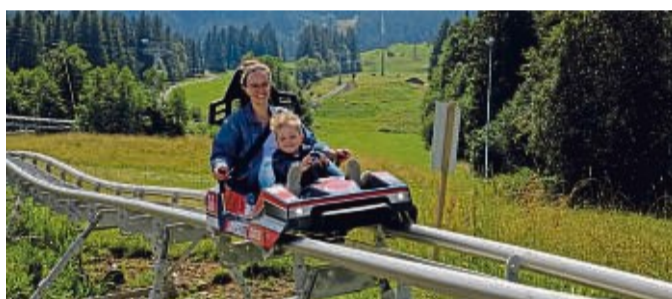
Auf der Sommerrodelbahn sausen Groß und Klein über Wellen, Jumps, Kreisel, Brücken und Tunnel ins Tal.

Dank der begünstigten Lage beginnt der Sommer in Nesselwang deutlich früher als in anderen Alpenorten. Rund um den Allgäuer Luftkurort blühen die Wiesen, zahlreiche Seen glitzern in der Sonne und die Alpseilbahn bringt Wanderer auf den 1.500 Meter hohen Hausberg. Auf Familien warten actionreiche Erlebnisse in der Bergnatur, wie Sommerrodeln im rasanten Alpseil-Coaster, ein spektakulärer Drahtseilflug mit Deutschlands schnellster Zipline, Biathlon-Schnupperkurs oder Bogenschießen im Trendsportzentrum. Das Feriendorf Rei-