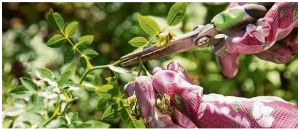
Die Gartenschere sollte man nach jedem Einsatz reinigen, damit sie länger scharf bleibt und keine Krankheiten auf Pflanzen überträgt.

Den Schleifstein müssen Sie vor dem Einsatz wässern. Dafür sollten Sie ihn so lange