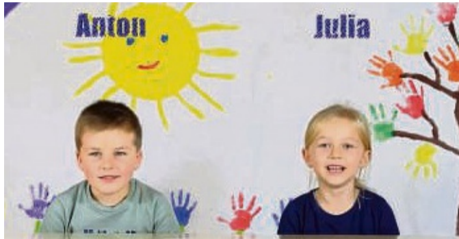
Die beliebte HNA-Aktion geht auch im April weiter.

Mazda Autohaus Sauer Berliner Straße 7 34560 Fritzlär ☎ 0 56 22 / 16 30 Mail: mazda-sauer@t-online.de Informationen unter: www.autohaus-sauer.de