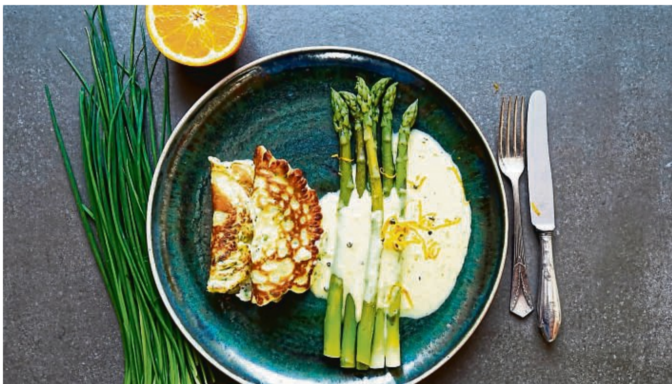
Ein Hauch von Frühling zaubert Food-Blogger Manfred Zimmer mit grünem Spargel, Orangensauce und Eierkuchen auf den Teller.

Mit den Schnittlauchpfannkuchen und der Orangensauce bildet der grüne Spargel ein Dreier-Bündnis, das Ihre Gäste und vielleicht auch Sie selbst überraschen wird.