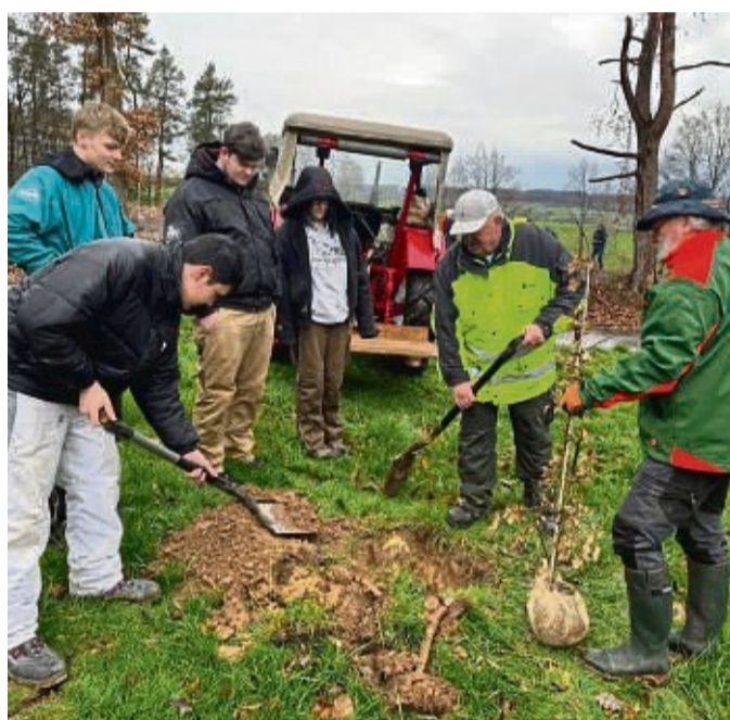
Die Pflanzaktion in Rengshausen war gut besucht. 90 Helfer packten mit an.

Angeleitet wurde die Pflanzaktion von Mitarbeitern des Forstamtes Neukir-