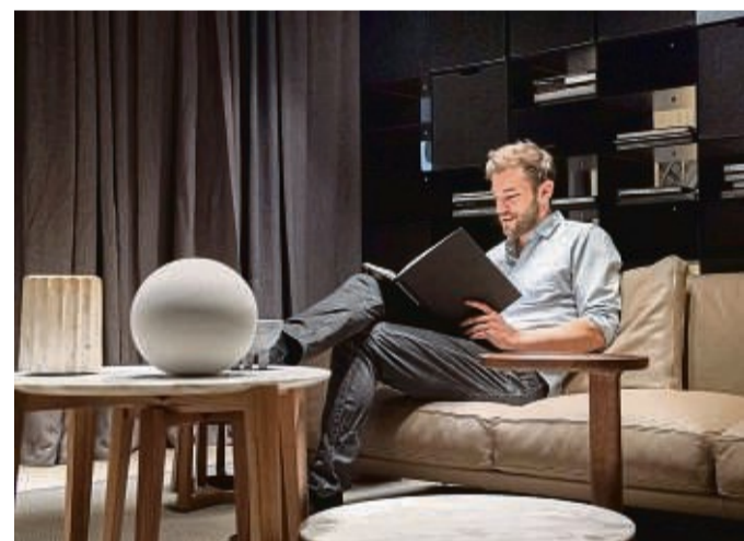
Nicht immer reicht das Tageslicht: Lampen mit LED, Dimmer oder Präsenzsensoren helfen beim Sparen.