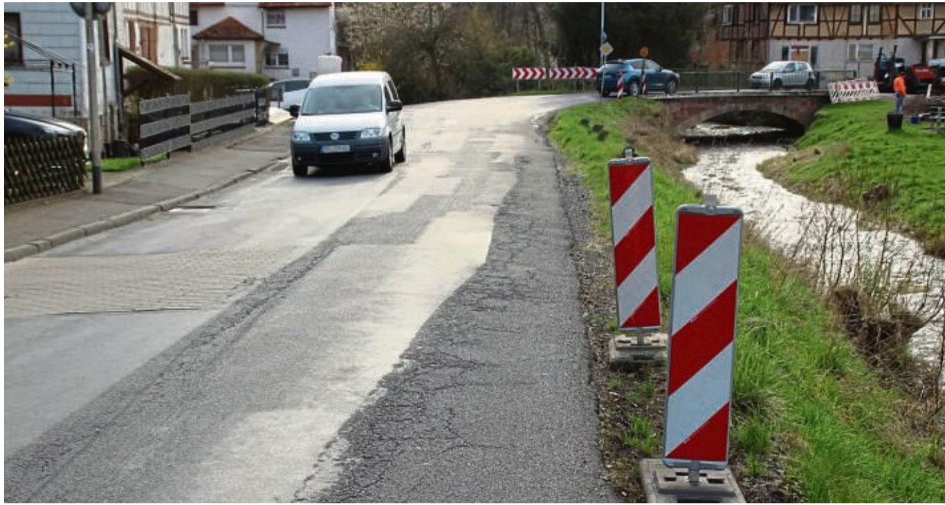
Gefährliche Situation: Zwischen der kaputten Landesstraße und der Mülmisch in Empfershausen sind auch die Seitenstreifen schon lange marode. Warnbaken sind nur ein Provisorium.