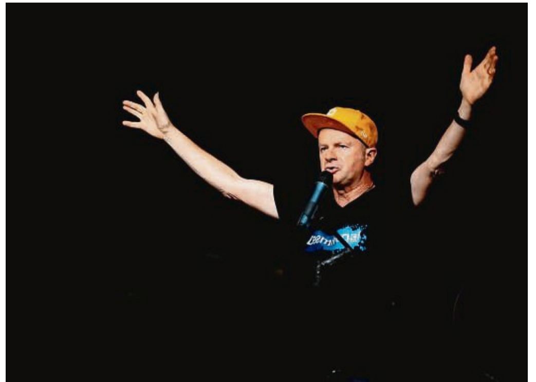
Kabarettist Willy Astor erklärt die Welt mit viel Wortwitz und Musik.

Tickets für die Veranstaltung des Kulturladen Wolfhagen am Montag, 12. Juni, ab 20 Uhr in der Stadthalle gibt es für 30,70 Euro. Die Karten gibt es unter anderem: online auf kulturkarten.de, unter Tel. 0 56 92/9 96 00 96, im Kulturbüro des Kulturladens an der Triangelstraße 19, in der Buchhandlung Mander, Schützeberger Straße 29, im Concept Store, Mittelstraße 12 und beim HNA-Ticketservice Kassel in der Mauerstraße 11.