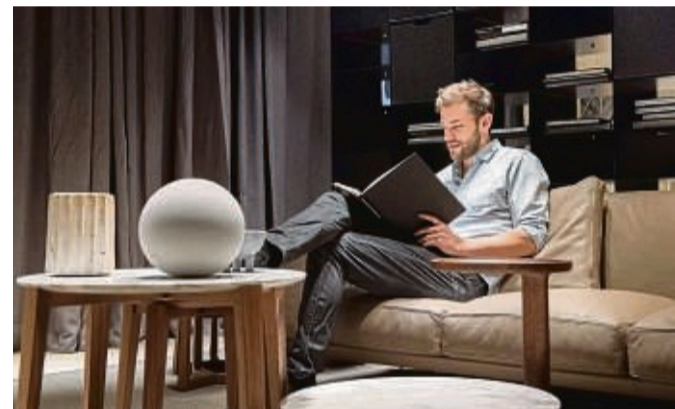
Nicht immer reicht das Tageslicht: Lampen mit LED, Dimmer oder Präsenzsensoren helfen beim Sparen.