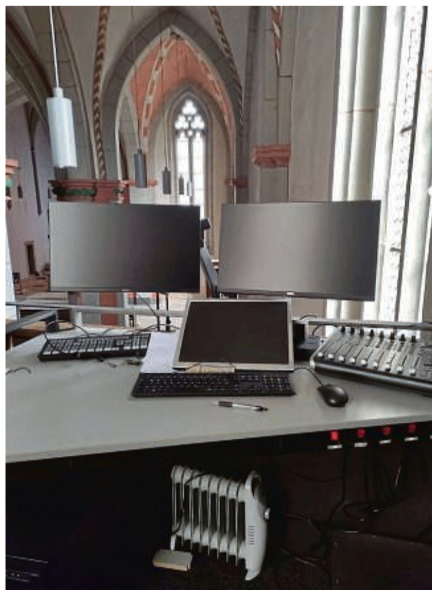
In der Technikecke sitzt jeden Sonntag der Kamera dienst, der für die Übertragung des Gottesdienstes zuständig ist.