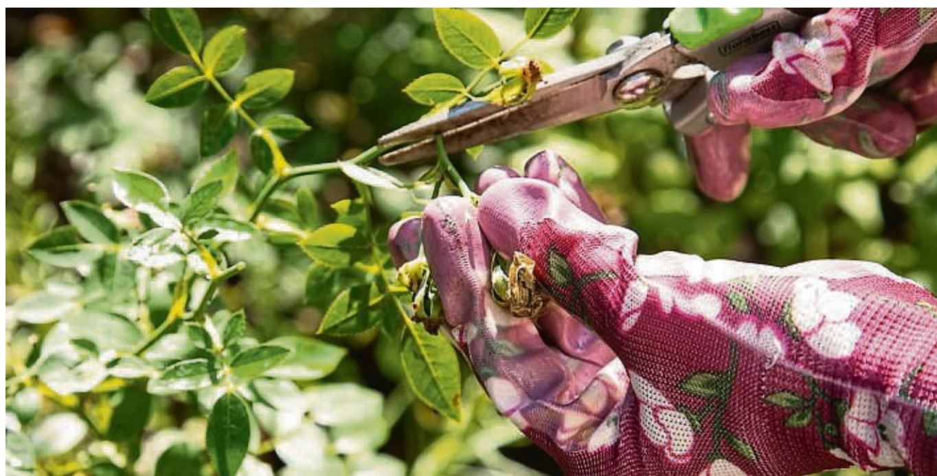
Die Gartenschere sollte man nach jedem Einsatz reinigen, damit sie länger scharf bleibt und keine Krankheiten auf Pflanzen überträgt.