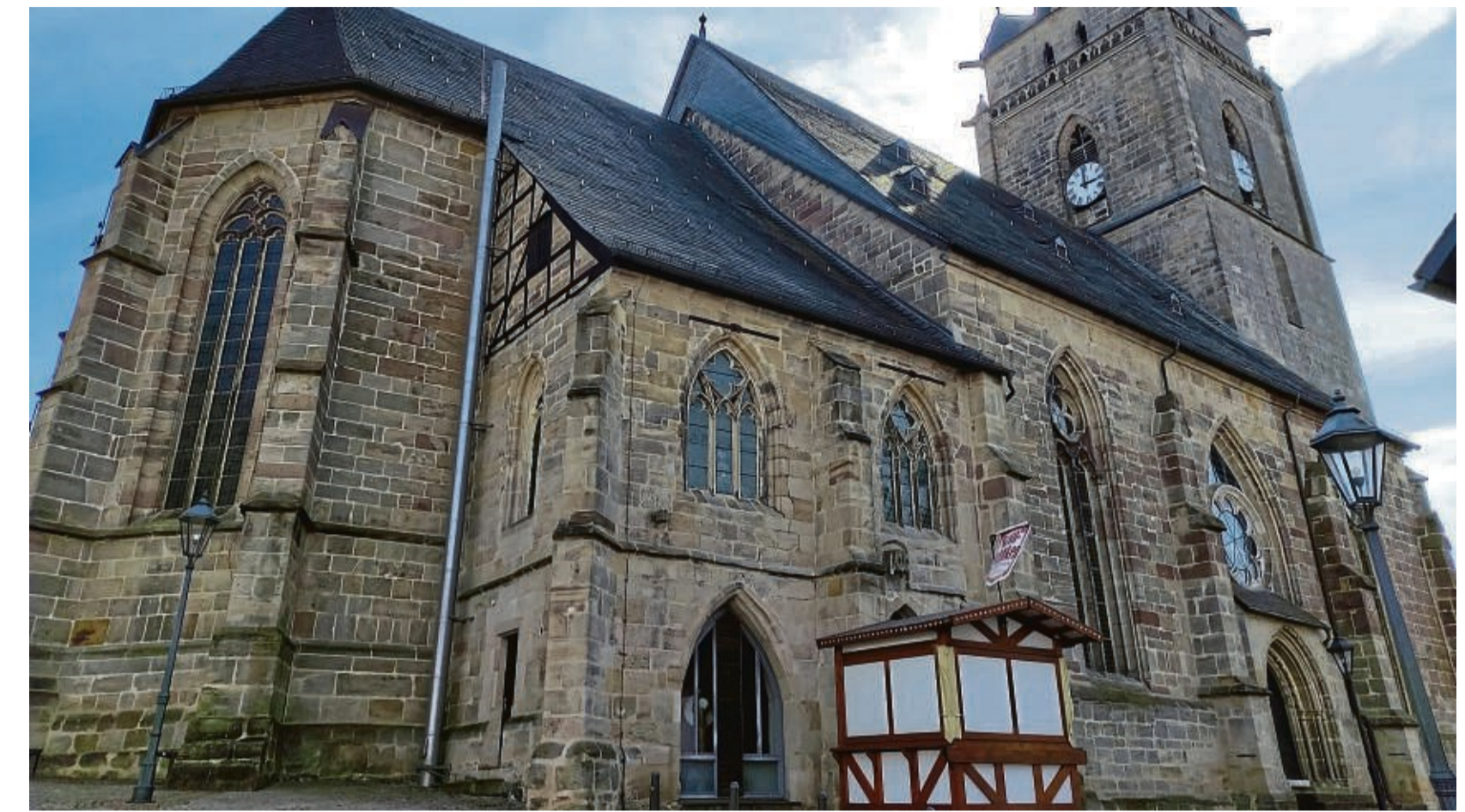
Die Stadtkirche in Wolfhagen ist eine spätgotische Hallenkirche.

Bauarbeiter machten bei der 2009 gestarteten Renovierung der Kirche einige überraschende Entdeckungen. Beim Einbau der Fußbodenheizung stießen sie unter anderem auf menschliche Knochen. „Über die Jahrhunderte hinweg sind immer wieder