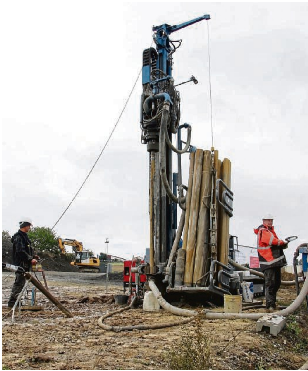
Eine klimaschonende Heizquelle: Die Geothermie oder Erdwärme. In Vellmar und Habichtswald wurden in den vergangenen Jahren Probebohrungen vorgenommen.