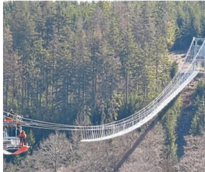
Auf der Strecke hoch über dem Strycktal haben die Arbeiten diese Woche den Mittelpunkt erreicht.

Der Eintritt auf die Brücke soll elf Euro kosten.