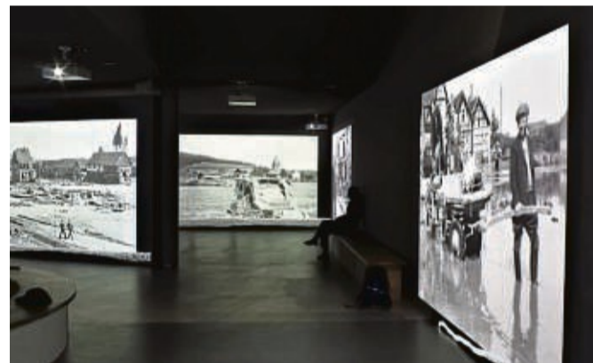
Die Tage nach der Flut: die Sperrmauerbombardierung 1943 ist eines von acht Themenfeldern der Multivisionsschau.