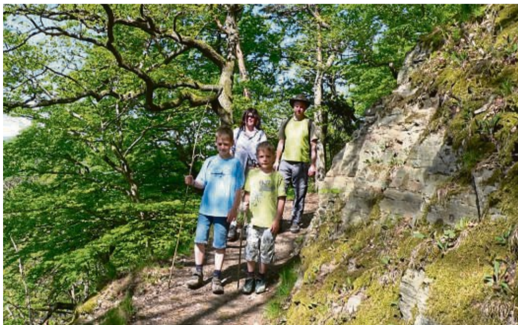
Urlaub für die ganze Familie: Die Ferienregion Diemelsee lockt immer mehr Gäste an, wie die Statistik zeigt.

Im Schnitt blieben die Gäste im vorigen Jahr 3,6 Tage in Diemelsee - das sei ein „sehr hoher“ Wert, betonte Becker. Im gesamten Kreis waren es 3,9 Tage - dabei seien allerdings die Bad Wildunger Kur-