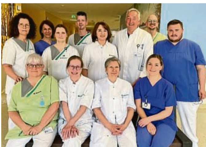
Gelungene „Patchworkfamilie“: Das interdisziplinäre Team der Geriatrie arbeitet zum Wohle der Patienten eng zusammen.