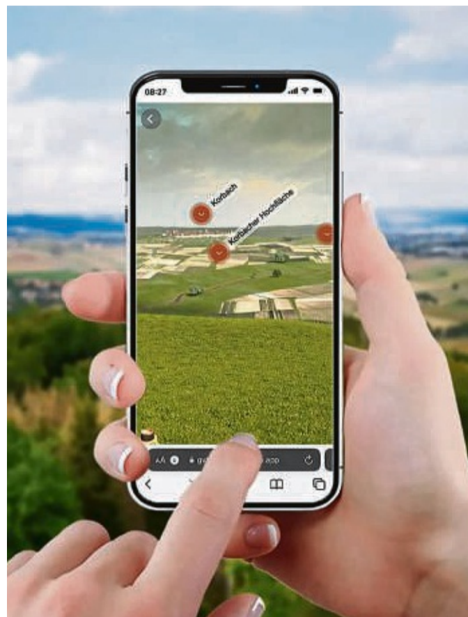
Digitale Zeitreise: Mit Smartphone lässt sich in die Welt von vor 250 Millionen Jahren eintauchen.

Auch das Goldbergwerk bietet zur Saisoneröffnung Sonderführungen an. Für das leibliche Wohl sorgt die Eisenberg-Hütte. Auf Fragen wie „Wie sah unsere Landschaft vor 250 Millionen Jahren aus?“ oder „Wie bildeten sich die regionalen Gesteine und unter welchen Bedingungen lebte eigentlich der berühmte Korbacher Urzeitdackel Procyonosuchus?“ bekommen Besucherinnen und Besucher auf dem Korbacher Eisenberg nun nicht nur Antworten, sondern auch ein realitätsnahes Bild. Auf dem Georg-Viktor-Turm tauchen sie mit Hilfe von modernster Technik in die Erdgeschichte und ihre Geheimnisse ein, live auf Smartphone oder Tablet. Die Augmented-Reality-Technik holt längst vergangene Zeiten in die Gegenwart. Damit öffnet sich eine neue Welt mit urzeitlichem Meer, ausgestorbenen Pflanzen und Tieren, Wüstenlandschaften und Gebirgszügen. 250 Millionen Jahre Erdgeschichte werden greifbar, da sie in die gegenwärtige Landschaft eingebunden werden. Das ist eine völlig neue Form der Wissensvermittlung. Die digital rekonstruierte Burg Eisenberg kann ebenso erforscht werden wie die Veränderungen des Klimas in erdgeschichtlicher Vergangenheit und eine mögliche