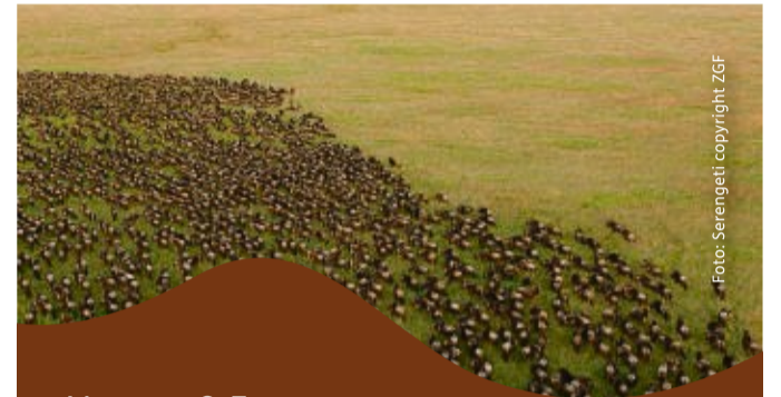
Foto: Serengeti