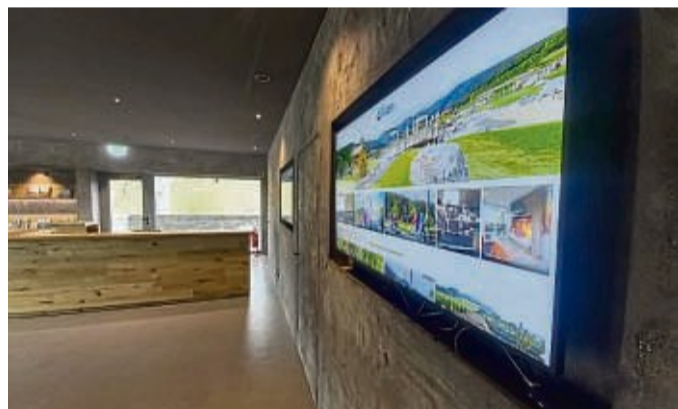
Im wohnlich gestalteten Foyer des Besucherzentrums gibt es große Bildschirme mit Informationen über die Ederseeregion.