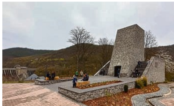
Das markante Besucherzentrum mit den naturnahen Außenanlagen lädt zum Verweilen ein.