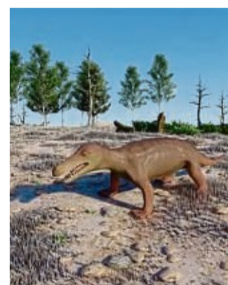
Auch der Urzeitdackel Procyonosuchus wird in die Gegenwart geholt.

Zukunft in Zeiten des Klimawandels. Die Landschaftsrekonstruktion wurde mit Hilfe des Förderprogramms „Starke Heimat“ des Hessischen Ministeriums für Digitale Strategie und Entwicklung verwirklicht. Beim Projekt entstanden Kosten von 150.000 Euro, die mit einer Fördersumme von 135.000 Euro bezuschusst wurden. Darüber hinaus wurde die digitale Rekonstruktion der Burg Eisenberg aus dem europäischen Leader-Programm in der Region Diemelsee-Nordwaldeck unterstützt.