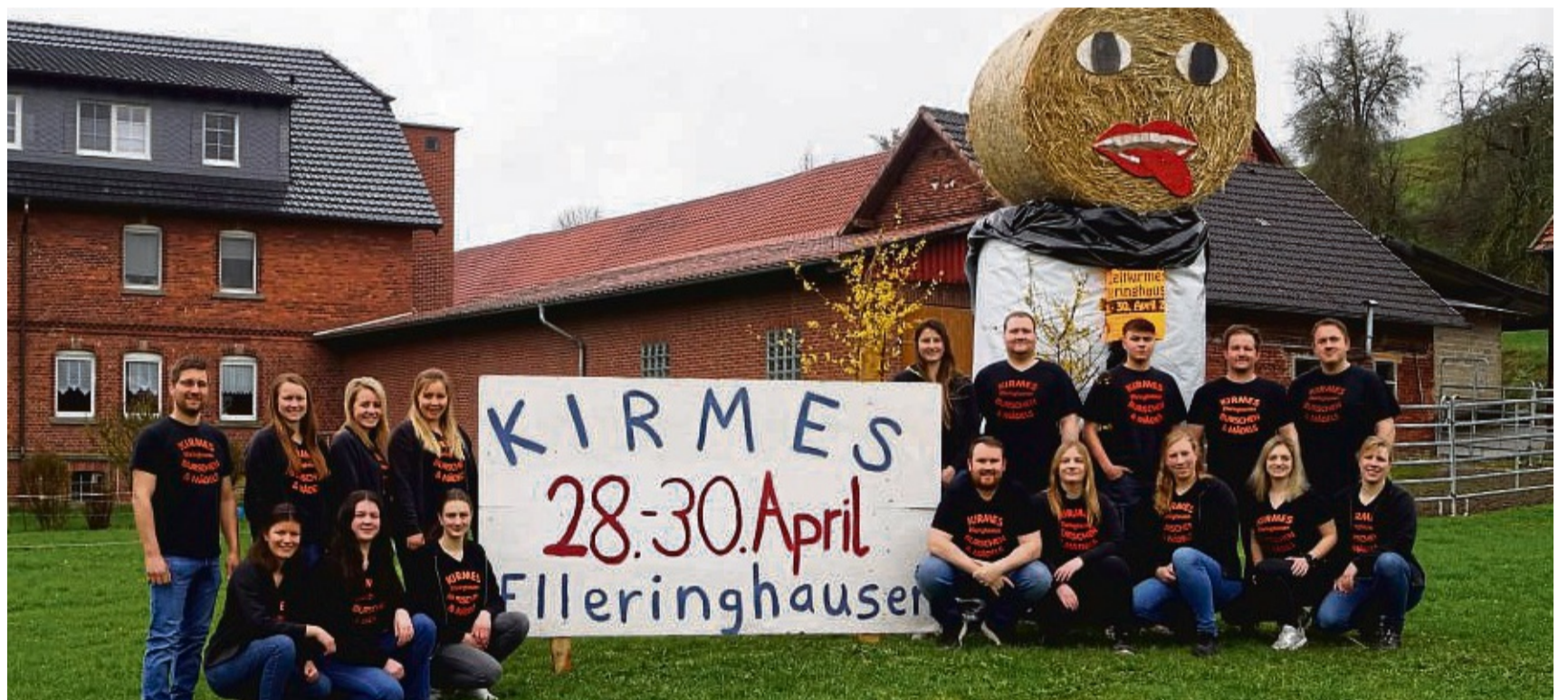
Die Kirmesburschen und -mädel aus Elleringhausen freuen sich auf drei ganz besondere Festtage mit viel Musik, Spaß und Action.

Im Anschluss an den Festzug können sich alle Teilnehmer und Zuschauer auf Kaf-