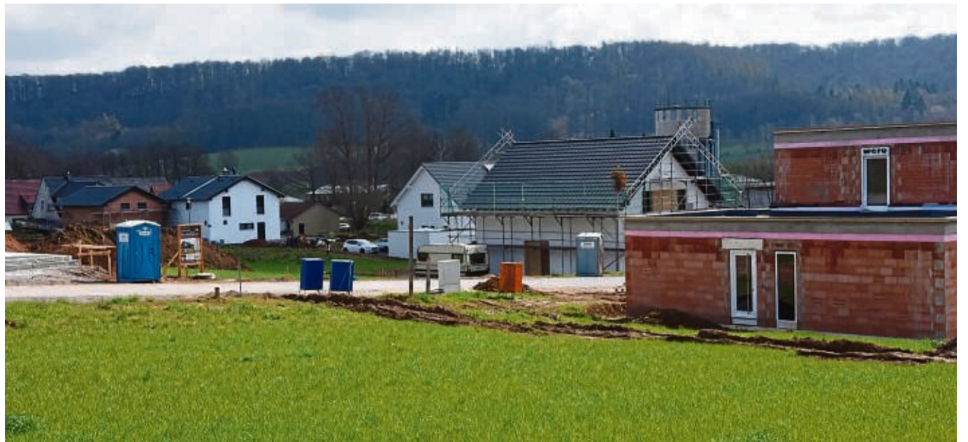
Bauland war bis vor Kurzem stark nachgefragt. Dieser Trend könnte sich nun aufgrund der gestiegenen Baukosten und Unsicherheiten abschwächen. Hier das neue Baugebiet Erlengrund in Twistetal-Berndorf.

Der Bodenpreis stieg hingegen im gleichen Zeitraum um 16,6 Prozent. Lediglich bei Grundstücken mit einem Bodenrichtwert ab 100 Euro pro Quadratmeter stieg der Geldumsatz, was laut den Autoren