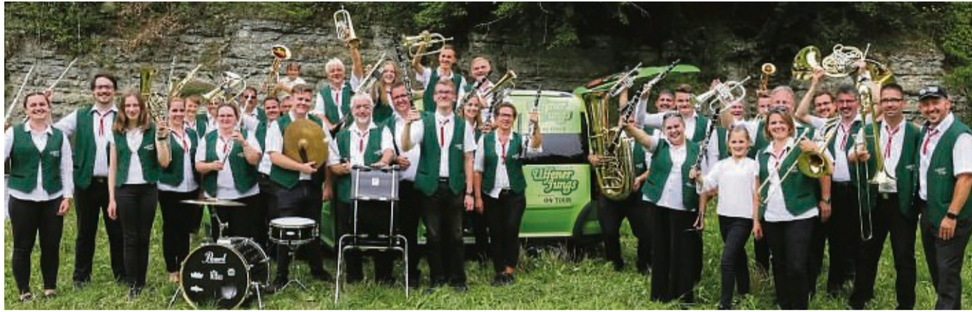
Treten demnächst unter dem Motto „Musikalisch in den Frühling“ wieder auf: Die Ulfener Jungs freuen sich auf sie und laden zu zwei Auftritten ein.