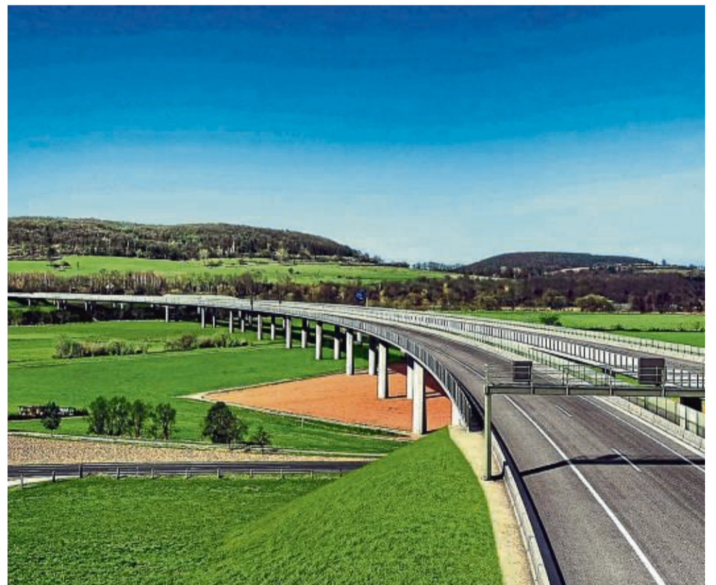
Die Wehretalbrücke verbindet die Tunnel Trimberg und Spitzenberg.