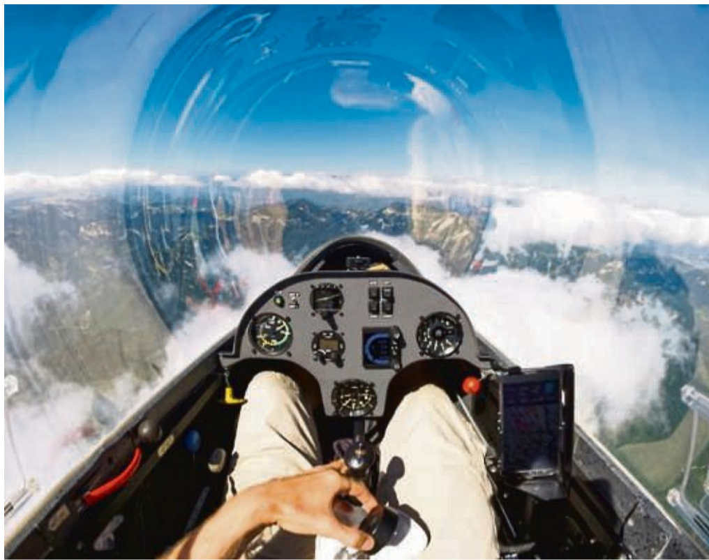
Das traditionelle „1. Mai Fliegen“ kann in diesem Jahr endlich wieder stattfinden: Dabei sind unter anderem Rund- und Kunstflüge sowie eine Flugzeugausstellung geplant.

Nun, zum Start der neuen Saison, kann wieder häufiger geflogen werden. Meist nehmen die Mitglieder ihren Flugbetrieb dann am Wochenende und an Feiertagen auf. Dafür braucht es gleich mehrere Personen, die den Start eines Segelfluges begleiten – etwa den Flugleiter, den Windenfahrer und weitere Helfer. Denn beim Segelfliegen ist eben auch Teamarbeit gefragt.