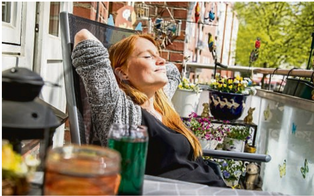
Die Sonne im Frühjahr genießen - dagegen spricht nichts, wenn man sich denn gut mit einem Sonnenschutzmittel eingecremt hat.

Dieses Risiko machen sich viele Menschen allerdings nicht so bewusst, weil die Sonne ein lebensspendendes