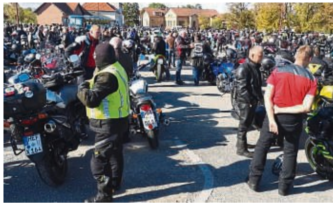
Aus der ganzen Region kommen die Motorradfans Jahr für Jahr, um am Gottesdienst zum Saisonstart auf dem Meißner teilzunehmen.