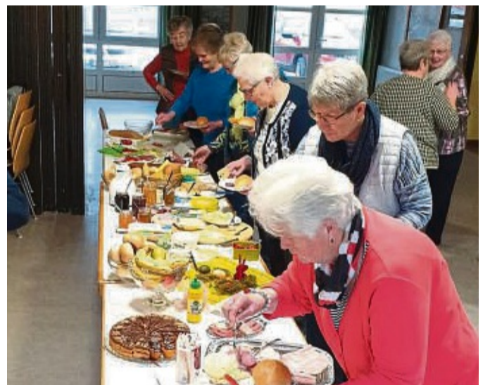
Verbrachten einen schönen Vormittag zusammen: die Ulfener Landfrauen.

Unsere nächsten Termine sind am Freitag, 26. April, ein Kinobesuch in Eschwege mit vorherigem Kaffeetrinken; Abfahrt ist um 13.15 Uhr an der Bushaltestelle. Anschließend kommt am Mittwoch, 3. Mai, Frau Möller aus Sontra zu uns mit dem Thema: „Iss dich gesund und stärke dein Immunsystem mit Kräutern und Gewürzen.“