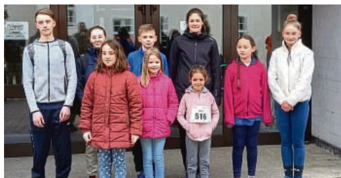
Nehmen an Wettkämpfen teil: die Leichtathleten des TV Sontra.

Weitere Informationen unter Tel. 05653 9777-16, Frau Rößler