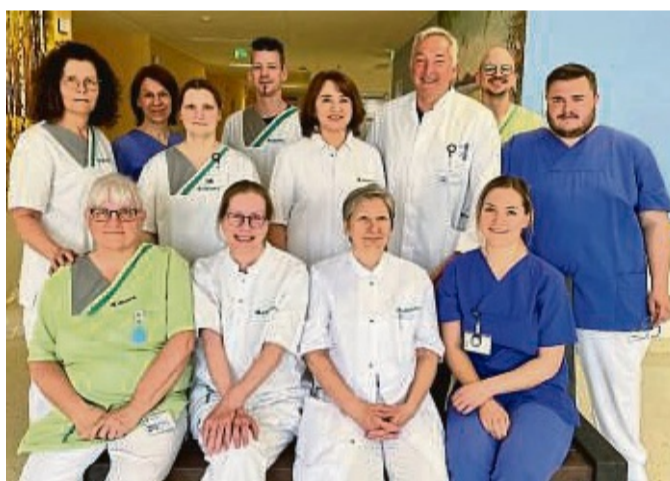
Gelungene „Patchworkfamilie“: Das interdisziplinäre Team der Geriatric arbeitet zum Wohle der Patienten eng zusammen.