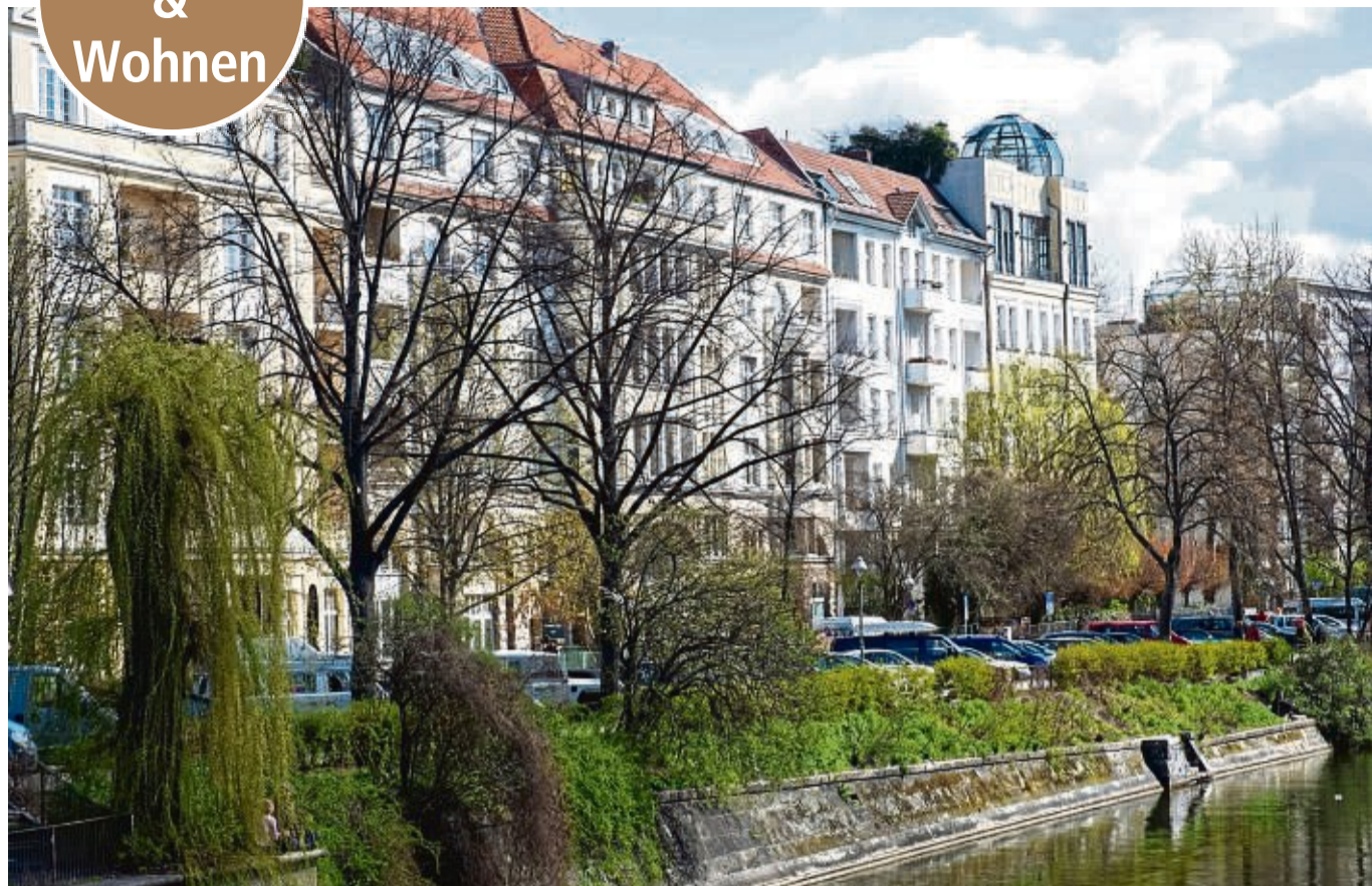
Selbst in Metropolen wie Berlin sind die Kaufpreise für Immobilien im Schnitt zuletzt gesunken.