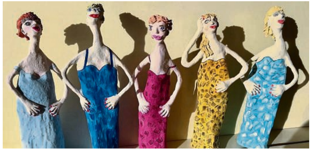
Best of artur: Die Korbacher Künstlergruppe malerei.grafik.plastik stellt im Kunstverein Battenberg aus. Vernissage ist am Dienstag, 25. April.

*Sämtliche Bezeichnungen beziehen sich auf alle Geschlechter.