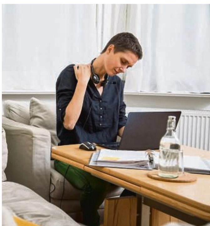
Arbeiten vom Sofa aus: Das klingt bequem, kann aber zu Verspannungen führen.

Bewegung in den Alltag bringen und Bücher stapeln Um Verspannungen zu vermeiden, rät das BGF, so oft wie möglich die Position beim Sitzen zu wechseln, Pausen einzulegen und auch am Arbeitsplatz im Homeoffice ergonomische Anpassungen vorzunehmen. Hat man keinen höhenverstellbaren Tisch, kann es etwa helfen, den Laptop auf ein paar Bücher zu stellen, so dass der