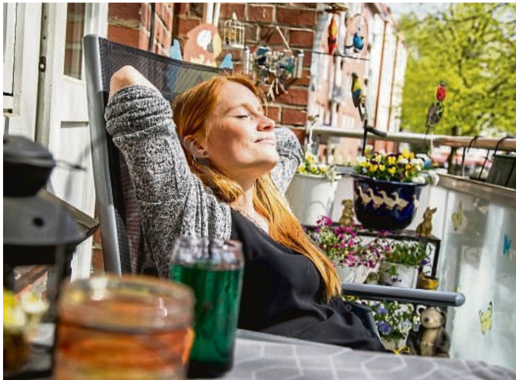
Die Sonne im Frühjahr genießen - dagegen spricht nichts, wenn man sich denn gut mit einem Sonnenschutzmittel eingecremt hat.

Dieses Risiko machen sich viele Menschen allerdings nicht so bewusst, weil die Sonne ein lebensspendendes Gestirn ist. Denn ohne die Wärme und das sichtbare Licht könnten wir gar nicht