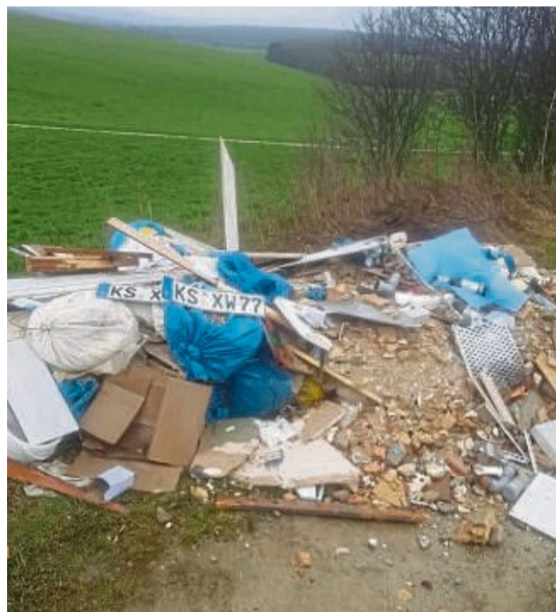
Müll am Naturdenkmal: Unterhalb der Friedenseiche wurde Ende März ein Kippplaster voll Bauschutt und sonstiger Müll abgeladen.