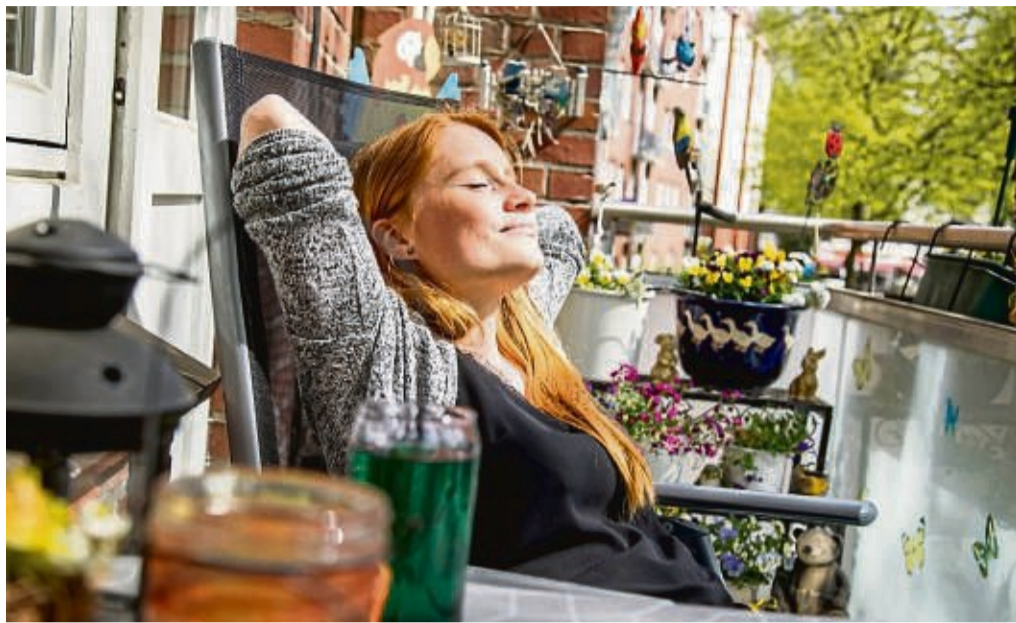
Die Sonne im Frühjahr genießen - dagegen spricht nichts, wenn man sich denn gut mit einem Sonnenschutzmittel eingecremt hat.

Dieses Risiko machen sich viele Menschen allerdings nicht so bewusst, weil die