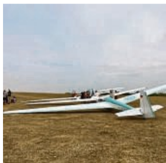
Doe Segelflieger in Aktion: Hier bei ihrem Sommerfluglager auf dem Dörnberg zusammen mit der Luftsportgruppe Erbslöh aus Langenfeld bei Düsseldorf.

Mit 10 000 Euro wird die Anschaffung einer vollständigen Ausstattung für ein doppelstiebiges Hochleistungssegelflugzeug mit einem Transportanhänger unterstützt, das kündigte jetzt die Landtagsabgeordnete von Bündnis 90/Die Grünen in einer Pressemitteilung an. Weitere 3200 Euro sind für die Neuananschaffung von Turngeräten des Turnvereins in Hoof bestimmt.