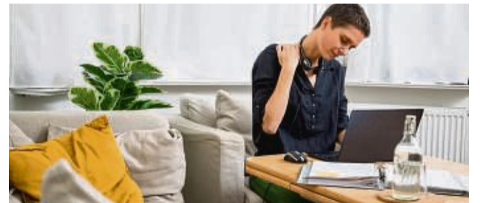
Arbeiten vom Sofa aus: Das klingt bequem, kann aber zu Verspannungen führen.