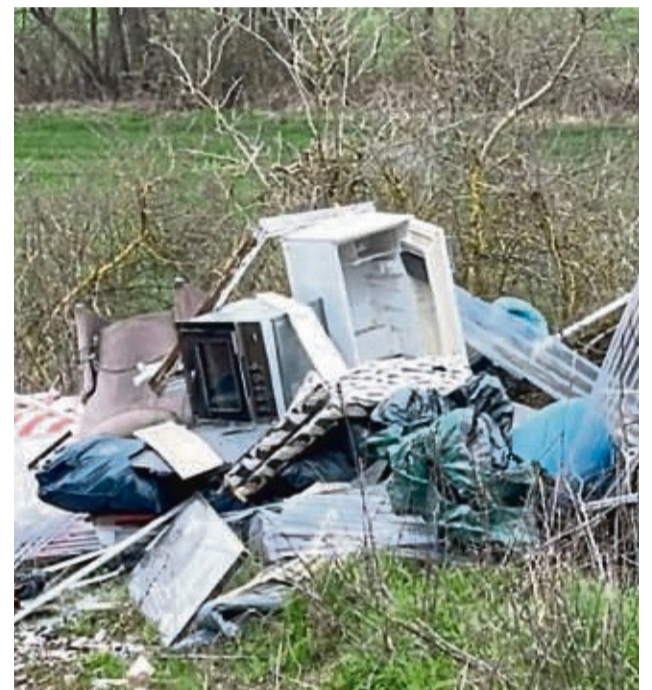
Karfreitag entdeckt: Am Radweg zwischen Westuffeln und Meimbressen wurde eine große Menge Sperrmüll entsorgt.