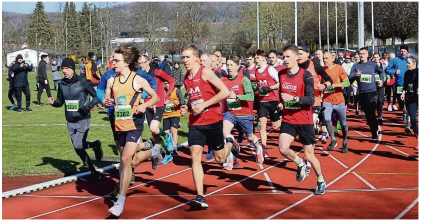
Volkslauf: Alle Wettbewerbe starten im Angerstadion in Hofgeismar. Das Foto entstand beim Volkslauf 2022.