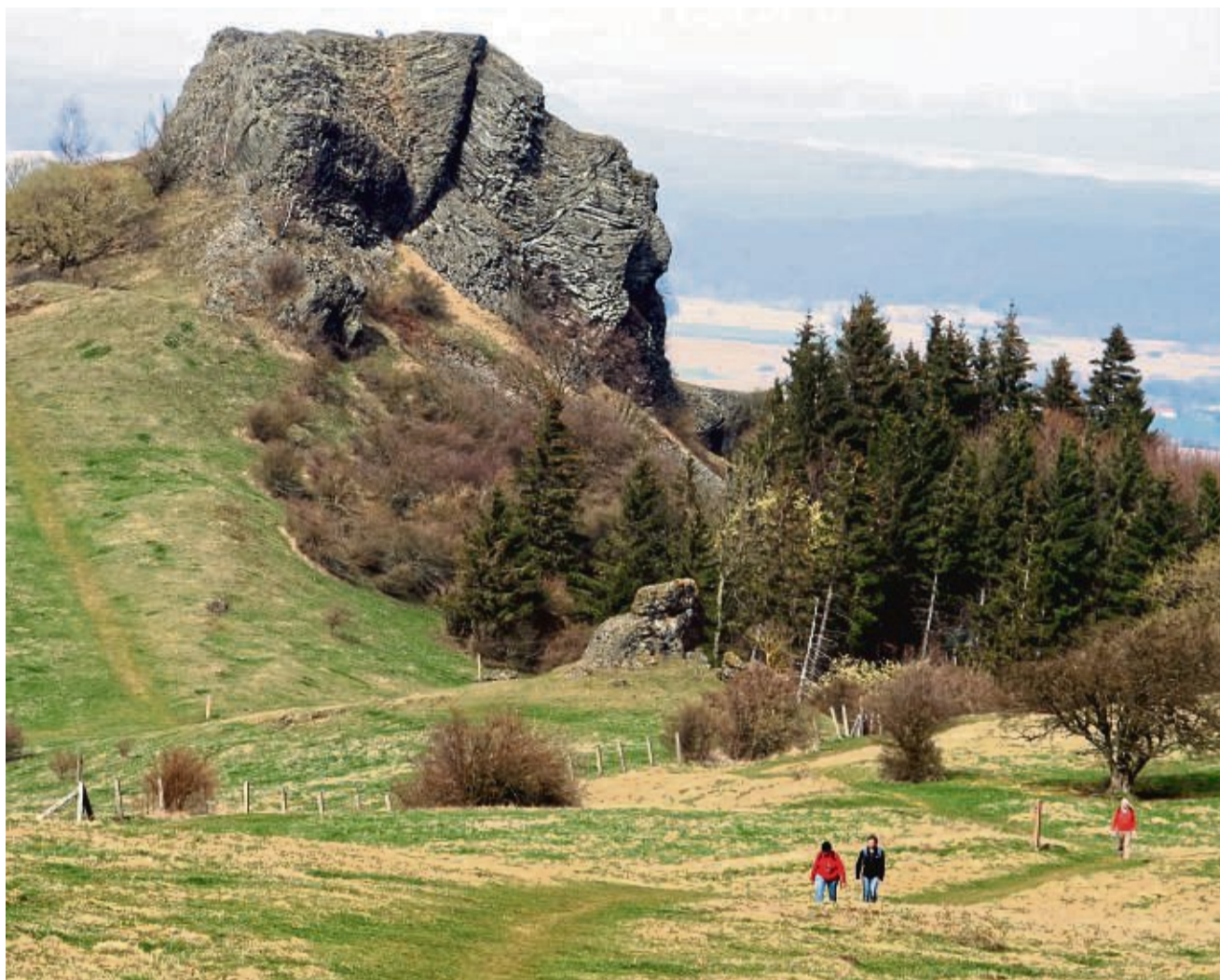
Ruff un runner geht's beim Wanderevent am 29. und 30. September. Wer die Strecke wandert, wird in Zierenberg im Ziel überrascht.

Angeboten werden eine 24-Stunden-Wanderung über 93 Kilometer und eine Zwölf-Stunden-Wanderung über die 45-Kilometer-Distanz. Beide Strecken führen ab dem jeweiligen Startpunkt über den Habichtswaldsteig – vom Edersee nach Zierenberg. Gemäß der angebotenen Streckenlängen handelt es sich bei der Zwölf-Stunden-Tour