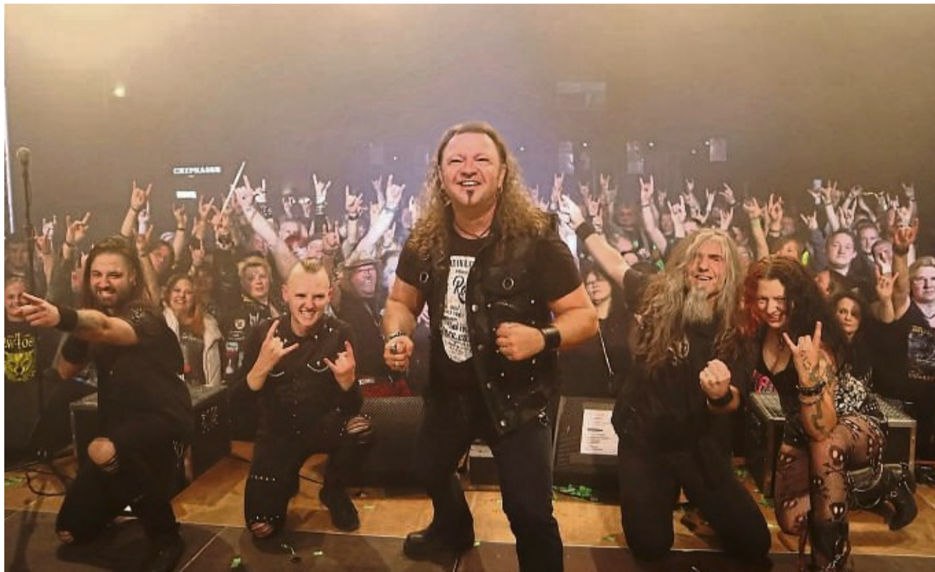
Erinnerung an einen besonderen Konzertabend: Nach ihrem Auftritt im letzten Jahr ließ die Band Mystic Prophecy noch ein Erinnerungsbild mit den Besuchern schießen. Hunderte von Händen schnellten dabei in die Höhe. Die Veranstalter rechnen auch in diesem Jahr mit einem gut besuchten Metal-Festival.