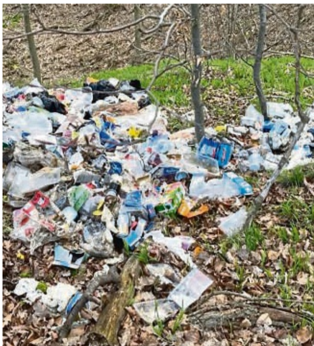
Dreiste Tat: In der Nähe des Carlsdorfer Ortsausganges Richtung Udenhausen wurde kurz vor den Osterfeiertagen Hausmüll abgeladen.