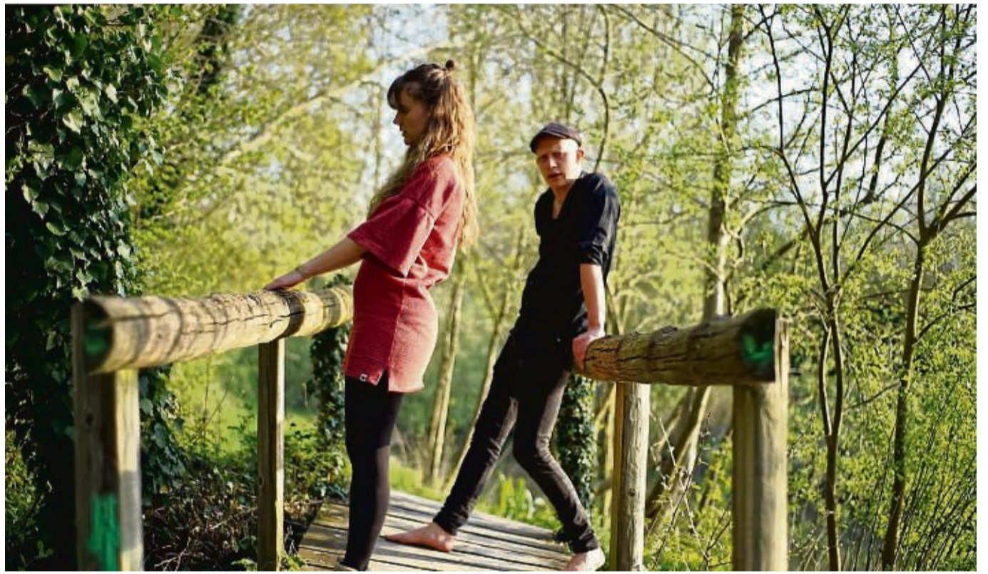
Stereo Naked waren bereits im April 2018 zu Gast in Rotenburg.