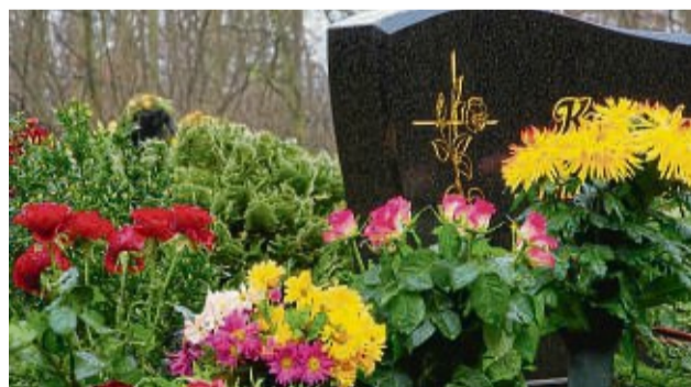
Wer sich schon zu Lebzeiten kümmert, nimmt den Angehörigen eine Last.