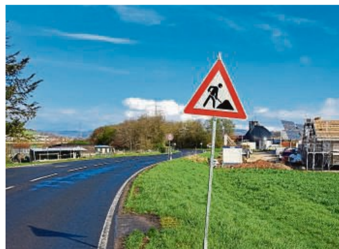
Die Vollsperrung am Braacher Ortsausgang sorgt für Umweg und Änderungen im Bus-Fahrplan.

Die Sperrung dauert laut der Stadt voraussichtlich bis Ende Juni. Der ÖPNV-Fahrplan wird entsprechend angepasst. Die Buslinien 305 und 308, die normalerweise die Landesstraße zwischen Baumbach und Braach entlangfahren, müssen während der Vollsperrung bis Ende Juni umgeleitet werden. Sie fahren Braach bis zum Abschluss der Bauarbeiten nicht an. Dafür hat der NVV Bus-Alternativen für die Braacher Schulkinder geschaffen.