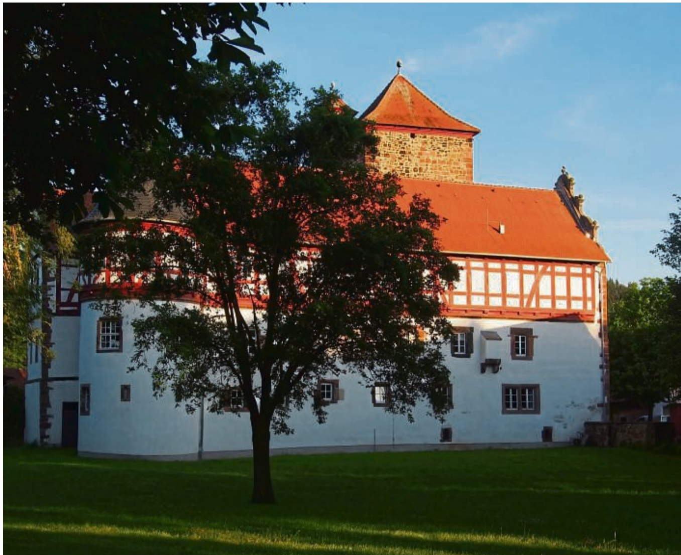
Im Schloss Eichhof wird das Stück „Nein zum Geld!“ im Rahmen der Festspiele aufgeführt.

Richard gewinnt eine riesige Summe im Lotto – und will das Geld nicht abholen. Er sagt: „Nein zum Geld!“. Kann man sich das vorstellen? Richard stellt sich genau das vor, denn er ist mit seinem Leben zufrieden. Seine Frau, seine Mutter und sein bester Freund, die zu ihm zum Abendessen gekommen sind, reagieren fassungslos. Es ent-