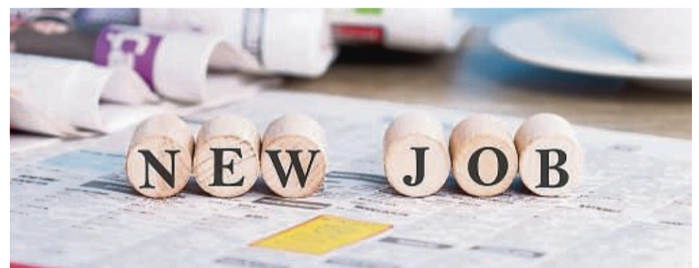
Manchmal ist es an der Zeit für einen neuen Job.

Hainstraße 7 36251 Bad Hersfeld Tel.: 0 66 21 / 80 59 60 13 www.ludwig-fresenius.de