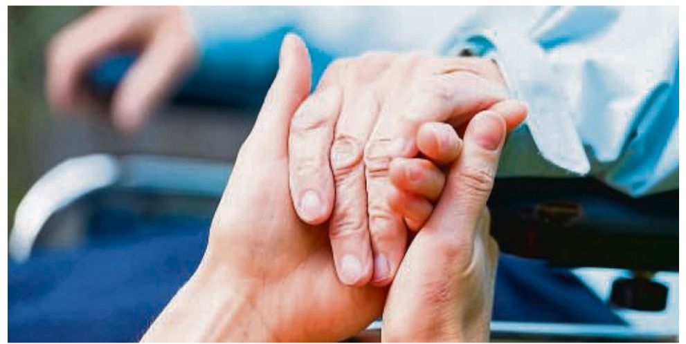
Betreuer helfen bedürftigen Menschen , etwa Senioren oder Asylbewerbern, indem sie ihnen Gesellschaft leisten.

Für die Senioren-Assistenten als Dienstleister wiederum kann der Beruf eine sinnstiftende Aufgabe sein.