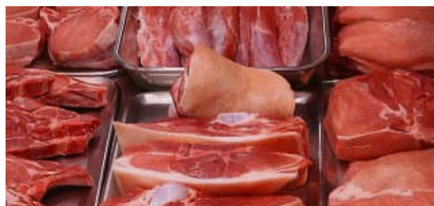
Frische Fleischwaren aus eigener Fütterung und Schlachtung: Das Rindfleisch kommt von hiesigen Bauern, das Schweinefleisch direkt vom Hof.