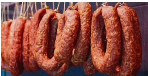
Der Direktvermarkter setzt auf einen hohen Qualitätsanspruch sowie Nachhaltigkeit.

Öffnungszeiten: Mo.: Ruhetag Di. - Fr.: 7 - 18 Uhr Sa.: 7 - 13 Uhr