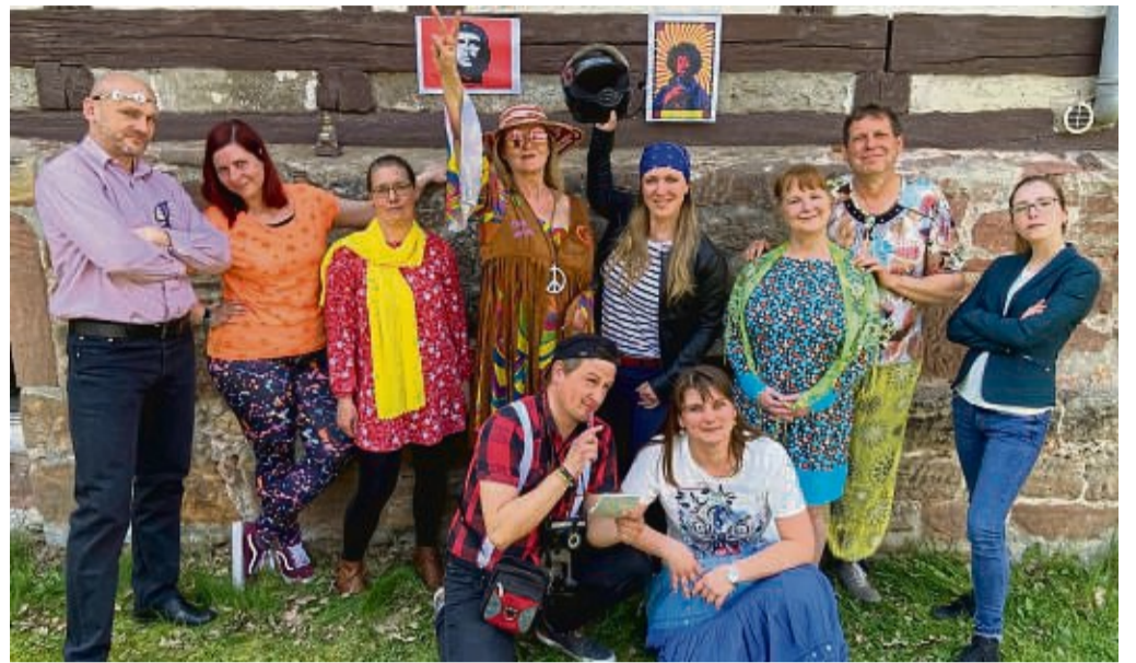
Mittendrin in der Probenarbeit für „Love & Peace im Landratsamt“: die Schauspieler der Werralöwen.

Die Laienschauspieler der Werralöwen, welche die deutsche Einheit leben – sie stammen aus Hessen und Thüringen, genauer aus Herleshausen, Lauchröden, Eisenach, Spichra, Wutha-Farn-