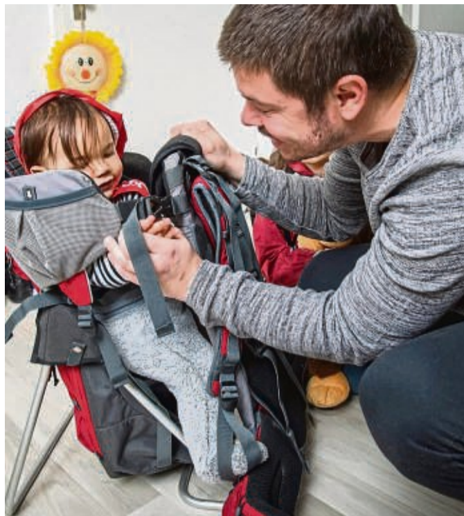
Die Anschallgurte der Kindertrage sollten verstellbar sein so bleibt die Tour für alle bequem.

Damit die Tour für alle bequem bleibt, sollten die Anschallgurte und die Sitzhöhe verstellbar sein. Um den Rücken bei längeren Ausflü-