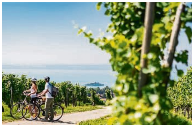
Der Bodensee-Radweg bietet seit 40 Jahren naturnahes Radeln mit Alpenpanorama und Seeblick.

Tipps für Eltern: Die richtige Trage fürs Wandern