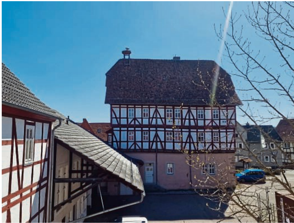
Guter Rundumblick ist für die Störche wichtig: den haben sie vom Dache des Grebendorfer Rathauses, wo sich ein Paar niedergelassen hat.