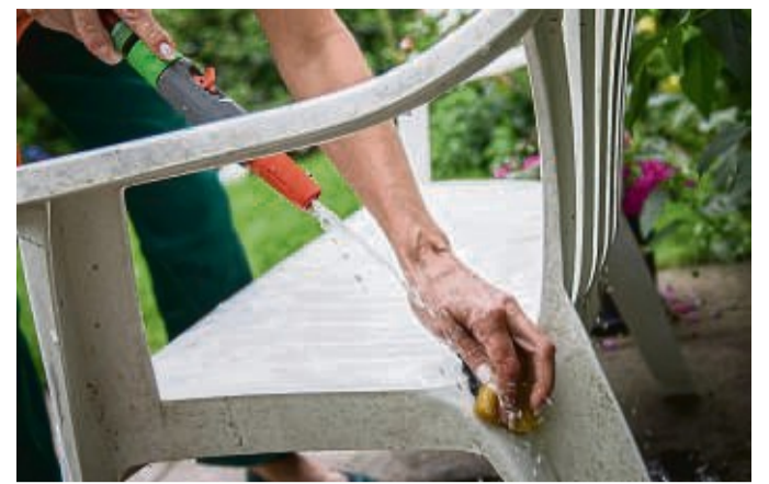
Bei Kunststoff-Gartenmöbeln sollte man von Scheuermittel die Finger lassen.