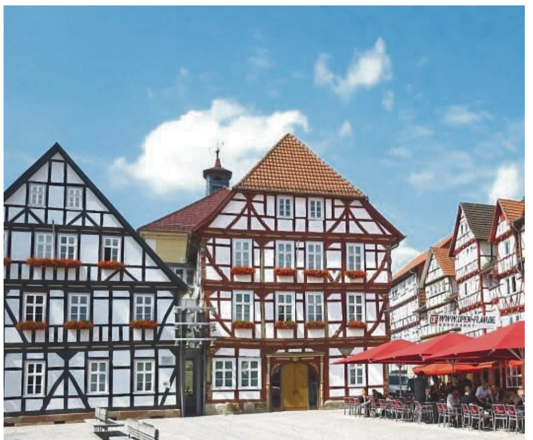
Als U-Bahn-Station waren die öffentlichen Toiletten bekannt, die früher an dieser Stelle zu finden waren. Auch sie sind im Eschwege-Lexikon zu finden.

Thematisch standen anfangs Eschweger Straßen im Mittelpunkt jedes Nachmittags. Die Fotoalben zum Rumreichen und Ansehen wurden mit der Zeit durch Beamer und Leinwand abgelöst. Gerade orientieren sich die Inhalte in alphabetischer Reihenfolge am Eschwege-Lexikon. Am Dienstag ging es um die Umgestaltung der Straße „Unter dem Berge“, das