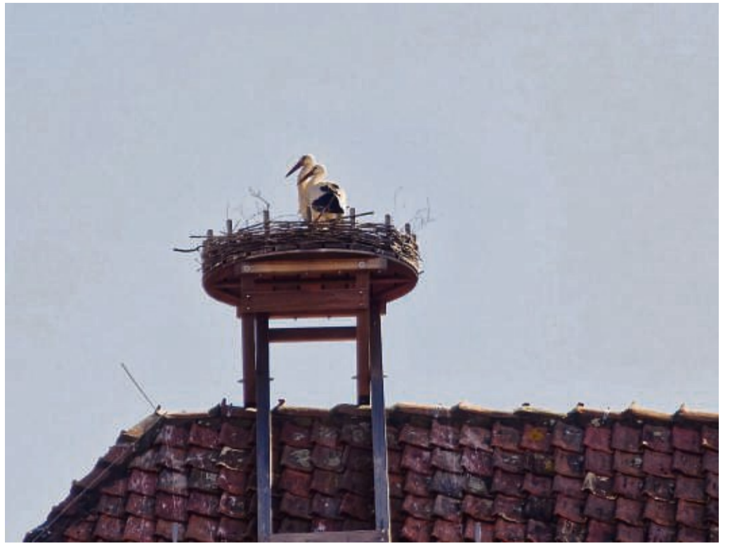
Trautes Glück: Das Storchenpärchen auf ihrem Horst auf dem Rathausdach.