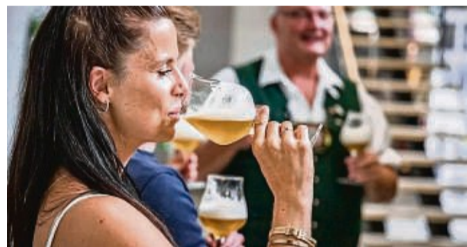
Die Brauereiführungen, Bierwerkstätten und Brauseminare der Chiemgauer „Heimatbrauer“ interessieren immer mehr Frauen.

Unter www.chiemsee-chiemgau.info gibt es weitere Informationen. djd-k