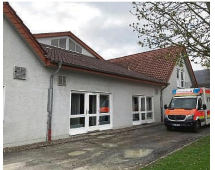
Noch ist die Rettungswache in Reinhardshagen in der Wesertalhalle untergebracht. Aufgrund der beengten Verhältnisse dort, ist ein moderner Neubau angezeigt.

ger, dass mit Unterstützung des Landkreises das DRK eine Rettungswache in der Gemeinde einrichtete. Die ist bis heute in der Wesertalhalle untergebracht. Mannschaftsraum, Aufenthaltsraum und Duschen befinden sich im Dachgeschoss der Halle. Eher ein Provisorium als eine Dauerlösung. Letztere soll nun endlich in die Wege geleitet werden. Auf der Suche nach einem Grund-