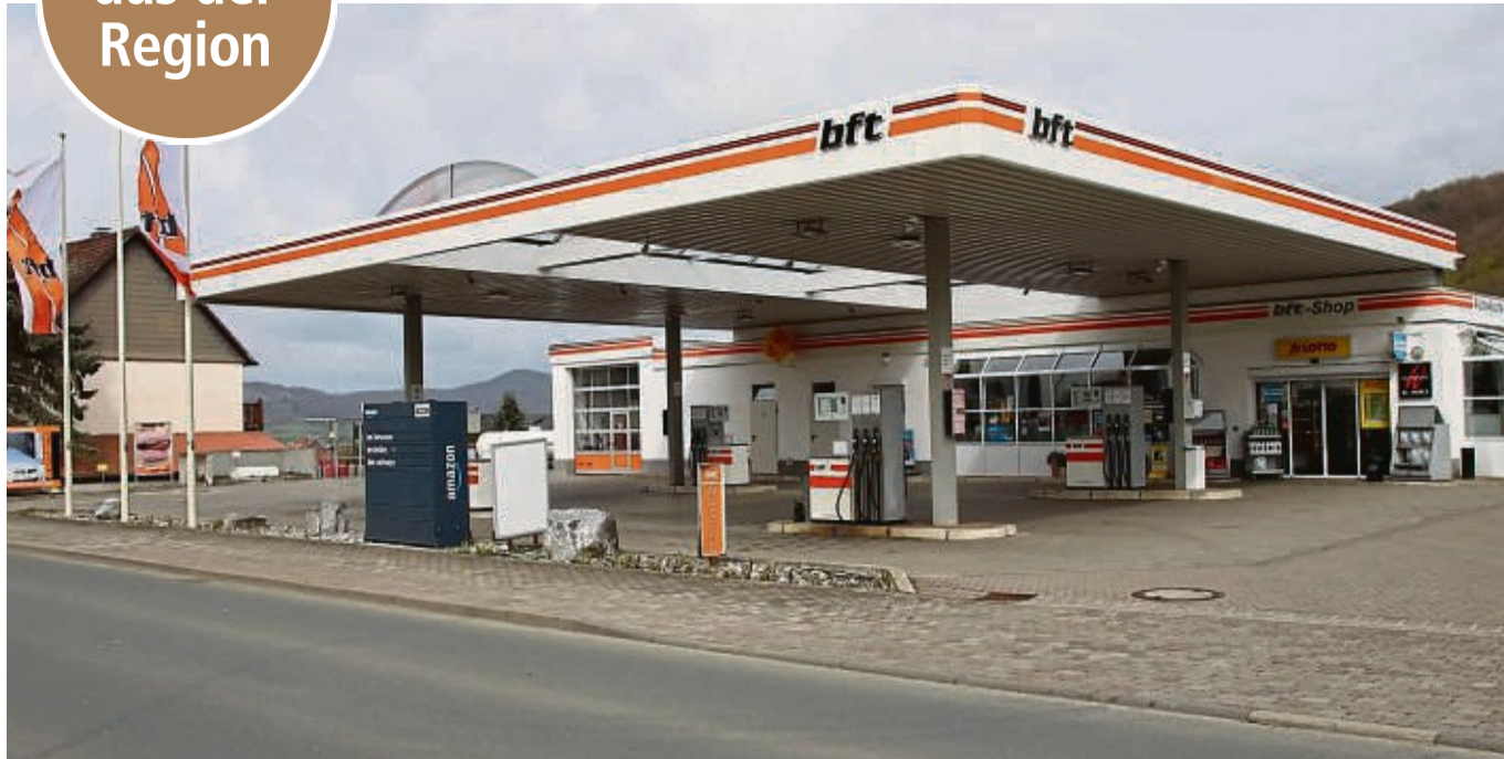
Rund ums Jahr geöffnet: Die bft-Tankstelle in Habichtswald Dörnberg bietet mit ihrem großen Sortiment eine Anlaufstelle für Bewohner und Pendler.