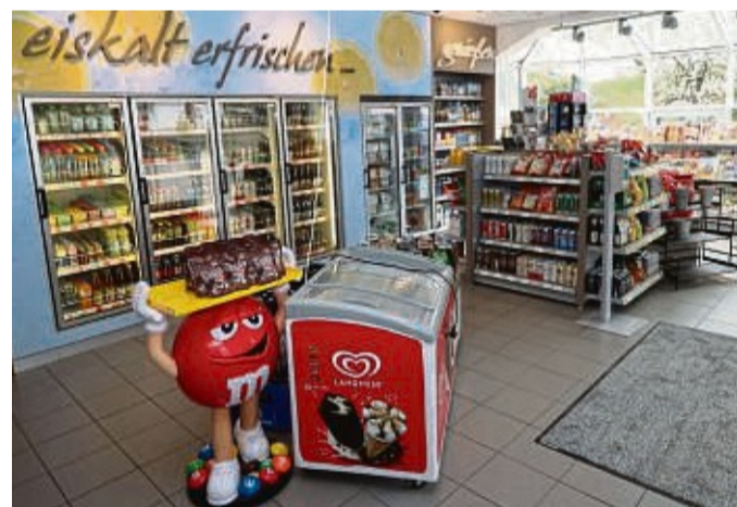
Was das Herz begehrt: Vom Eis über die Grillkohle bis zur Glückwunschkarte. Hier finden Kunden mehr als Benzin, Diesel und Autogas.