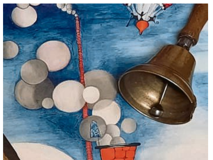
Bauhausbild und Ausrufglocke: Neuzugänge im Stadtmuseum.

Gänzlich anderer Art ist ein total verspieltes Aquarell aus einem dem Museum zugefallenen Nachlass, dessen Urheber der in Hofgeismar geborene Friedrich Wilhelm Bogler ist, einer der bekanntesten Bauhaus-Maler der Zwanziger Jahre. Das an Anspielungen reiche Bild wird erstmals in der Sonderausstellung „Heimische Maler“ ab dem 2. Juli zu sehen sein.