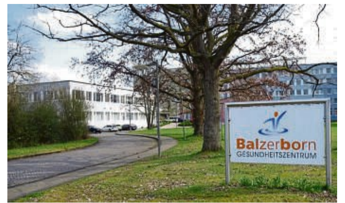
Die ersten Reha-Patienten sind nach der zweiwöchigen Schließung in dieser Woche wieder in der Balzerborn-Klinik in Bad Sooden-Allendorf aufgenommen worden.