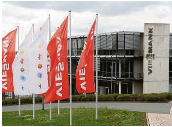
Der Verkauf des Kerngeschäfts des Firma Viessmann an den US-Konzern Carrier hat nicht nur am Stammsitz Allendorf-Eder und in der Region für Aufsehen gesorgt.