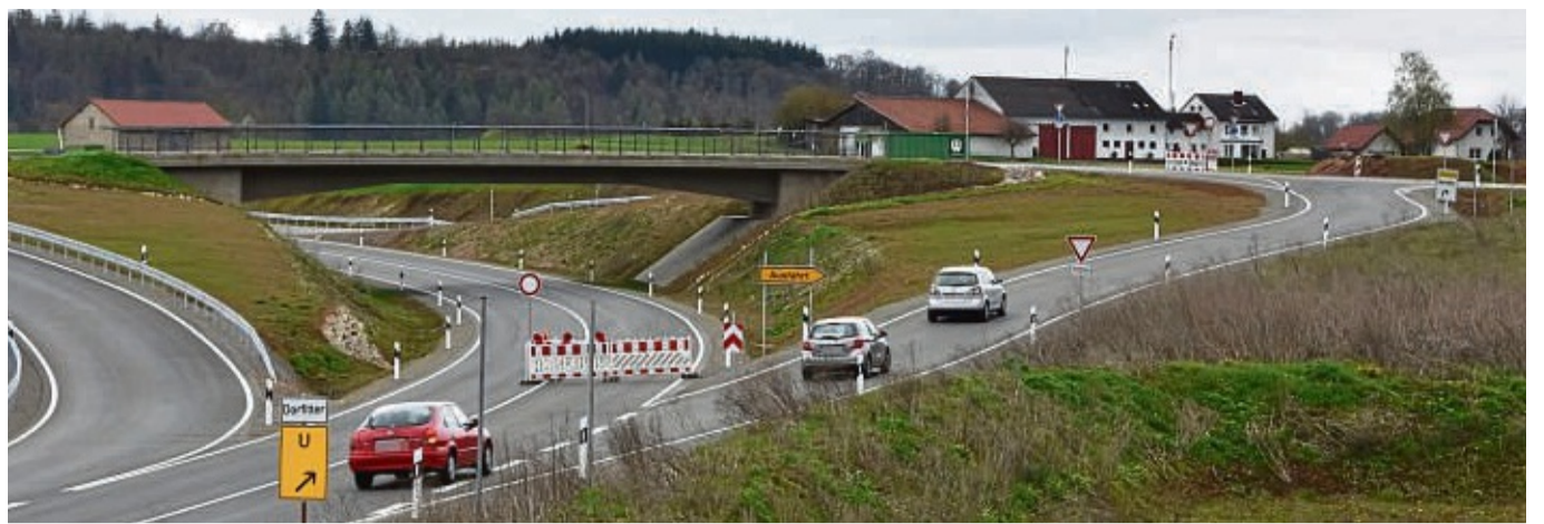
Erste Autos auf der neuen Trasse: Aufgrund der Abrissarbeiten an der Bahnbrücke wird die Umleitung nach Dorfitter über einen Teil der Ortsumgehung geführt.

Anzeigen in Ihrer Tageszeitung sind eine wirkungsvolle Werbemöglichkeit.