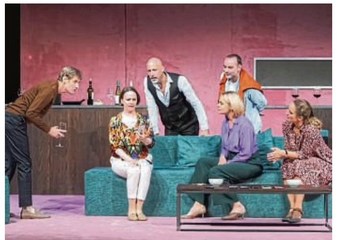
Die Darsteller der Komödie „Das perfekte Geheimnis“ wollen dem Korbacher Publikum in der Stadthalle amüsante Unterhaltung bieten.

Das Stück handelt von sieben Freunden (drei Paaren und ein Single), die beim gemeinsamen Abendessen ein gefährliches Spiel spielen: Jede Nachricht, die im Laufe des Abends auf den sieben Handys ankommt, wird laut vorgelesen, Bilder und Filmchen bekommen alle zu sehen. Sehr schnell zeigt sich: Mit entscherten Handgrana-