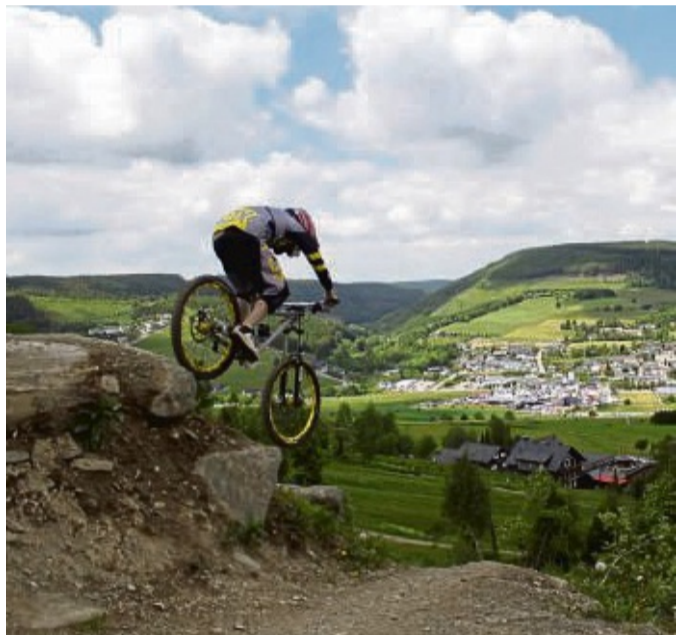
Das Willinger Bike-Festival bietet ein imposantes Panorama für Zuschauer und Sportler.

Anmeldungen für die Wettbewerbe werden im Internet unter www.willingen.bikefestival.de entgegen genommen.