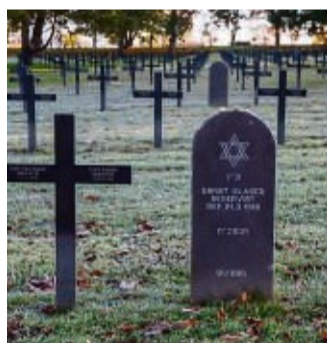
Jüdische und nichtjüdische deutsche Soldatengräber aus dem Ersten Weltkrieg in Aras/Frankreich.

schen Juden! In schicksalsernster Stunde ruft das Vaterland seine Söhne unter die Fahnen. Dass jeder deutsche Jude zu den Opfern an Gut und Blut bereit ist, die die Pflicht erheischt, ist selbstverständlich...“ Während des Ersten Weltkrieges dienten fast 100000 Juden in Heer und Marine, 12000 waren zu Kriegsbeginn 1914 als Freiwillige zu den Fahnen geeilt. 77000 kämpften an vorderster Front, 30000 wurden mit zum Teil höchsten Auszeichnungen dekoriert und mehr als 20000 befördert. 12000 Soldaten jüdischen Glaubens verloren im Krieg ihr Leben. Indem sie sich freiwillig zum Kriegsdienst meldeten oder Kriegsanleihen zeichneten, erhofften sich viele deutsche Juden, dass die in der Bevölkerung vorhandenen anti-