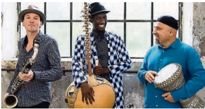
Das Trio JMO spielt in der Vöhler Synagoge.

Bei ihren Live-Konzerten pendeln die drei Musiker zwischen magisch verklärten Momenten und rhythmisch explosiven Höhenflügen. So entsteht eine authentische und zeitgenössische Kam-