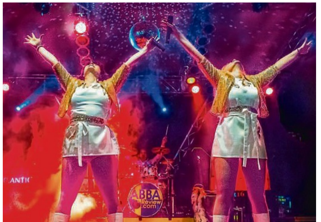
„Waterloo – The ABBA Show“ kommt am 17. August nach Edertal.