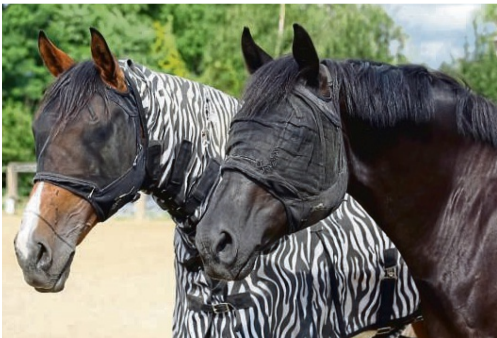
Halter schützen ihre Pferde mit Zebra-Fliegendecke und Fliegenschutzmasken.

Mit Zebrastrifen oder Karomuster, gepunktet oder einfarbig: Wer eine Fliegen-