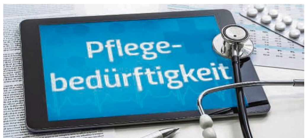
Die Pflegeversicherung übernimmt für Pflegebedürftige mit mindestens Pflegegrad 2 die Kosten für die Inanspruchnahme eines Pflegedienstes bis zu einem gesetzlich vorgeschriebenen Höchstbetrag.

Weitere Information und die Möglichkeit zur Anmeldung gibt es unter info@mgh-bad-wildungen.de oder telefonisch unter 05621-9695950.