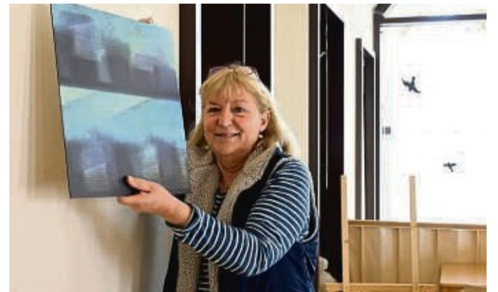
Blick aus dem Restaurantfenster: So umschreibt Fotografin Wilburg Kleff dieses Werk. Sie stellt ab dem 7. Mai rund 30 Werke im Museum Kloster Hasungen aus.

Die Motive selbst mögen die Fotografin wie von selbst gefunden haben. Dies hänge damit zusammen, dass sie ein inneres Raster, quasi eine ästhetische Prägung, mit sich herumführe. Dadurch sprächen sie bestimmte Sachen im Speziellen an. Doch: „Nur wenn man die Kamera dabei