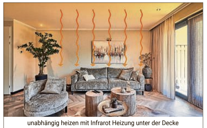
unabhängig heizen mit Infrarot Heizung unter der Decke

Fast jeder sucht Alternativen beim Heizen Der schnelle Umbau oder eine Erneuerung der Heizungsanlage scheidet oft an der Verfügbarkeit neuer, energiesparender Anlagen und an langfristig ausgebuchten Handwerkern. Das Lagerfeuer im Wohnzimmer ist bekanntlich keine Option, scheidet also auch aus. Was lässt sich alternativ und unabhängig zu Gas- oder Ölheizungen einbauen? Wie wäre es mit einer Infrarotheizung? Infrarot sorgt für behagliche Wärme. Wie bei Sonnenstrahlen spürt die Haut diese Wärme sofort. Herrlich! Auch für Hausstauballergiker. Infrarotheizungen können elegant unter Spanndecken „versteckt“ werden.