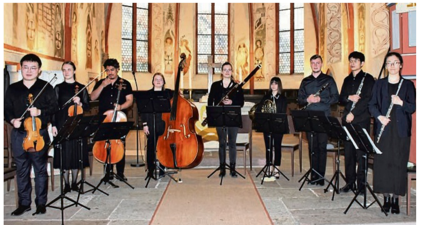
Von Klassik bis Romantik: Die Studierenden der Musikakademie Louis Spohr in Kassel überzeugten beim Kammermusik-Konzert in der Stadtkirche Zierenberg.