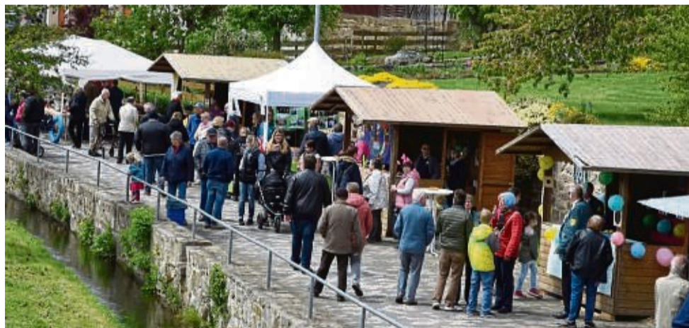
Open Air Ausstellung: Entlang des Mühlengrabens befinden sich zahlreiche Hütten, wo die Künstler und Handwerker ihre Arbeiten präsentieren.