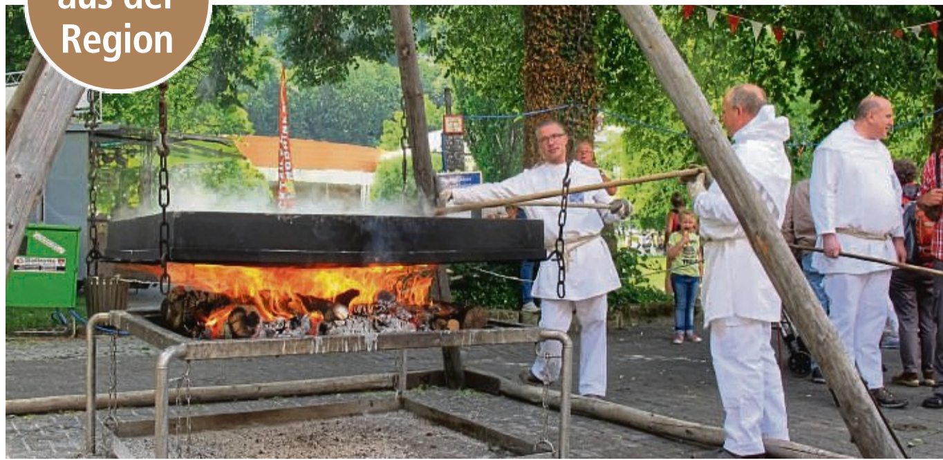
Beim Brunnenfest kann man sehen, wie Salz in Handarbeit gewonnen wird.