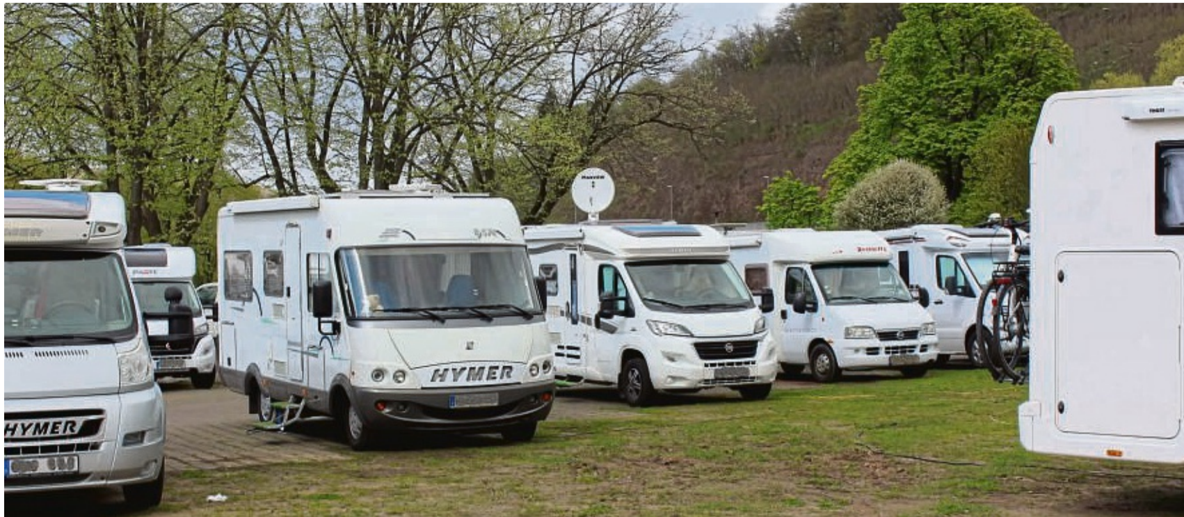
Immer gut besucht: Der Wohnmobilstellplatz auf dem Tanzwerder am Weserstein wird gerne von Campern angefahren.