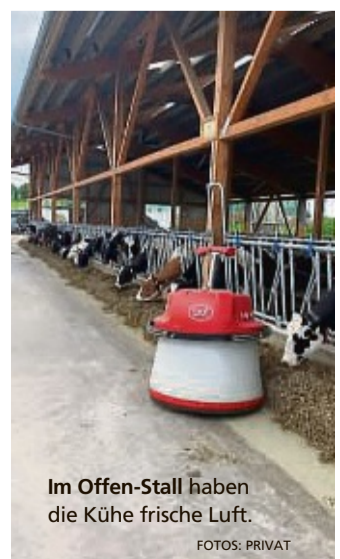
Im Offen-Stall haben die Kühe frische Luft.

Mehrere Sachsenhäuser Vereine wollen sich zudem an einer Pflanzaktion beteiligen, die Ende Oktober oder Anfang November im angrenzenden Wald stattfinden soll. Schließlich plant der Festausschuss am 31. Dezember einen zünftigen Jahresabschluss.