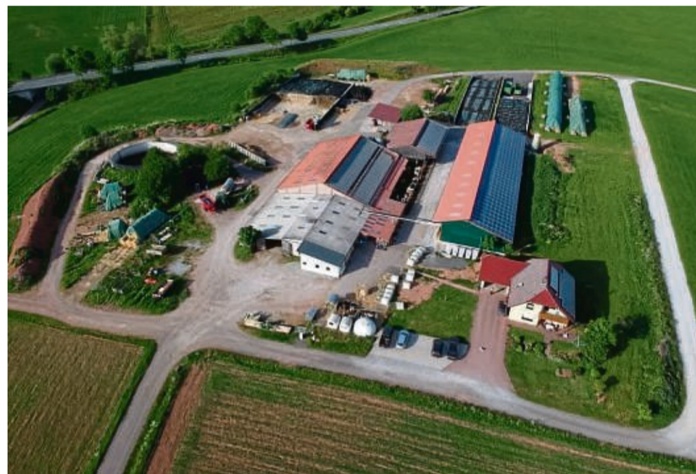
Der Milchviehbetrieb Schmal in Sachsenhausen.

235 Hektar Grünland, Acker und Futterbau, dazu 180 Milchkühe und dazu viele weitere Informationen über den konventionell produzierenden Milchviehbetrieb Schmal GbR bekommen die Besucher. Kennzeichnend für die heutige zukunftsorientierte Landwirtschaft ist die moderne, digital gesteuerte technische Ausstattung, die hier natürlich auch vorgestellt wird. „Bei den Stallbesichtigungen kann man sich die drei Melkroboter ansehen, die wesentlich zur betriebswirtschaftlichen Effizienz beitra-