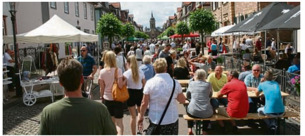
Barockfestspiele in Bad Arolsen: Hier eine Szene von der Künstlermeile in der Schlossstraße.