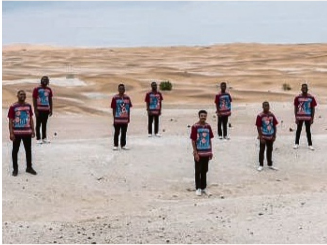
Die „African Vocals“ aus Namibia sind am 2. Juni auf Burg Lichtenfels zu hören.

Es werden Getränke und Snacks angeboten. red/md