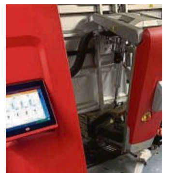
Computersteuerung gehört beim Füttern oder Melken dazu.

Nach dieser ersten Veranstaltung geht es nach Auskunft von Klaus Schmal schon bald weiter: Das große Festwochenende zum 777-jährigen Bestehen von Sachsenhausen steigt vom 23. bis 26. Juni mitten im Ort, auf dem Marktplatz und an der Kirche. Geplant sind viele Mitmachaktionen für ein fröhliches Miteinander. Zur Einstimmung auf das große Fest spielt der Musikzug der Freiwilligen Feuerwehr Sachsenhausen am kommenden Sonntag ab 11 Uhr in der örtlichen Stadthalle.