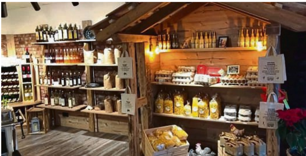
Regional erzeugte Produkte werden immer beliebter.

Durch die gute Zusammenarbeit des Fachdienstes Landwirtschaft mit den direktvermarktenden Betrieben, die in allen Bereichen der Direktvermarktung Fortbildungsmaßnahmen erhalten haben, sei der Stellenwert regional erzeugter Produkte von Jahr zu Jahr gestiegen. Auch die Nachfrage nach Lebensmitteln aus Wal-