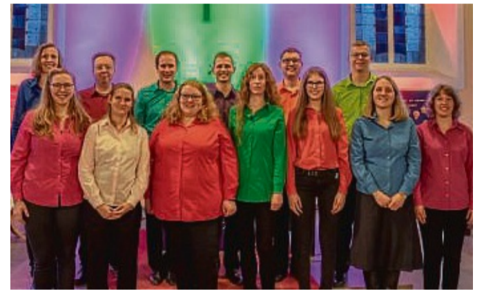
Anspruchsvolles Repertoire: Das Vokalensemble feiert 10 Jahre d'aChor mit einem Konzert.

den altbekannten „Hits“ werden auch neue Stücke dabei sein. Uraufgeführt werden unter anderem „Perfect“, bekannt in der Version von Ed Sheeran, „Amoi seg ma uns wieder“ von Andreas Gabaliere und „Viva la vida“ von Coldplay. Auch eine Hommage als Dankeschön an den Gemischten Chor Goldhausen wird zu hören sein. red