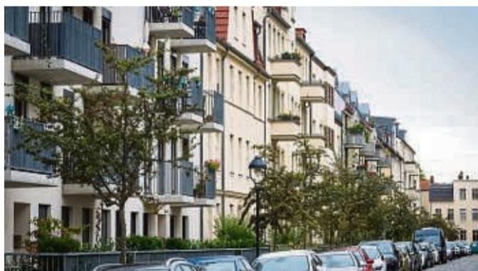
Im Besitz einer wertvollen Immobilie? Wer diese in mehreren Tranchen überträgt, kann den Bedachten dadurch womöglich die Steuerlast drücken.