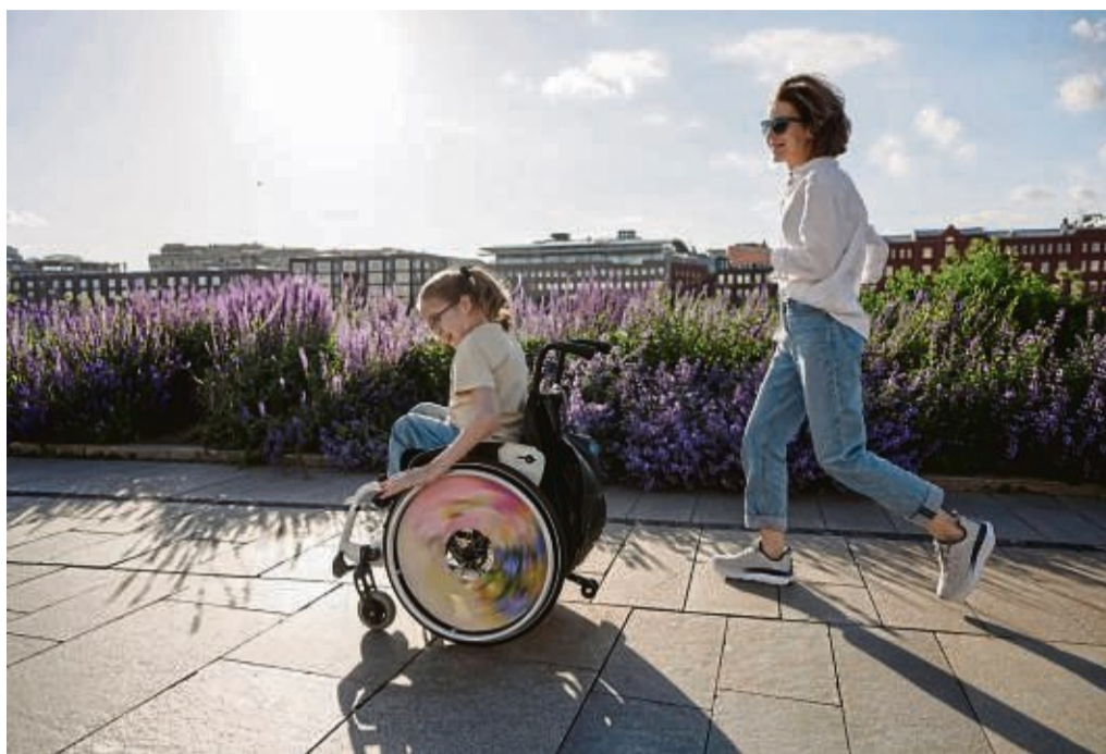
Adaptive Mode soll sich verschiedenen Lebenssituationen anpassen: Dazu gehört auch, dass Kleidungsstücke beim selbstständigen Anziehen eines Rollstuhls nicht stören.

In der Kollektion von Wundersee Fashion ist dieser vorne lang, aber hinten kurz, „damit man den Mantel auch