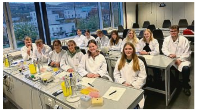
Biologen und Kriminologen: die Schüler der Bio-Leistungskurse aus Sontra im XLAB der Uni Göttingen.

ben sich in der Kinderbetreuung des Angebots sehr wohl gefühlt. Entsprechend galt der Dank der Mütter den Betreuerinnen. Sie kümmern sich um die Kinder der Teilnehmerinnen von „Aktiv in den Job“ und der Qualifizierungsmaßnahme. „Let's Work“ für Frauen mit Flucht- und Migrationshintergrund. Zusammen mit „Let's Work“ fand unter anderem gemeinsames Kochen statt.