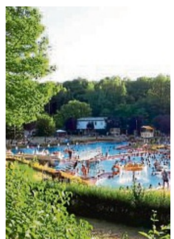
Das familienfreundliche Freizeitbad öffnet bald.

Barrier Reef“ zu schnorcheln. Weitere Aktionen sowie Aqua-Gymnastik und Schwimmkurse sind in Planung. Die Stadtverwaltung Sontra wünscht allen Badegästen eine schöne und sonnige Badesaison. Freizeit- und Erlebnisbad Sontra, Jahnstr. 11, 36205 Sontra Telefon: 05653 - 914206 (ab Beginn der Badesaison)