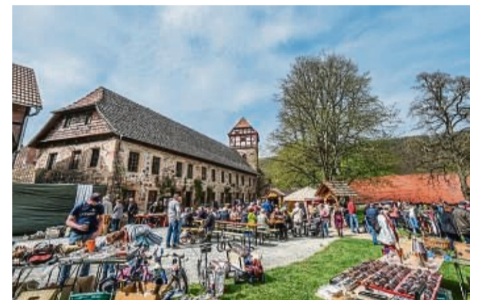
Eröffnung wurde gut besucht: Museumsverein im alten Boyneburger Schloss sagt „Danke“.