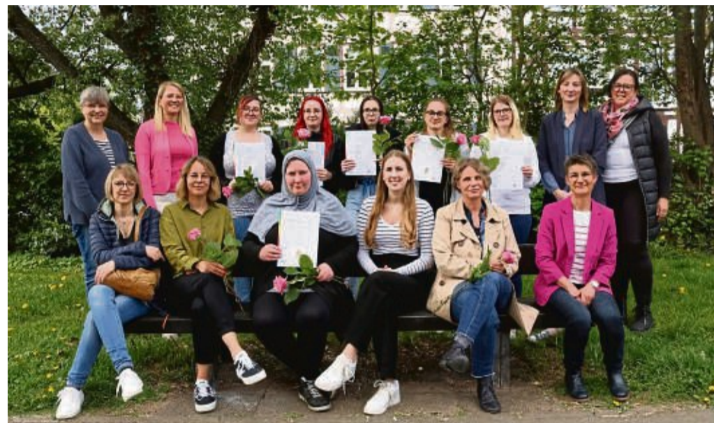
Den erfolgreichen Abschluss der Arbeitsmarktintegrationsmaßnahme feierten die Teilnehmerinnen mit Gästen der FBS, des Jobcenters und des Kreises.

Hierbei handelt es sich um eine Vervielfältigung einer DNA-Sequenz, die durch die Zugabe von bestimmten Reagenzien sowie einem Gerät, dem Thermocycler, erreicht wird. Der PCR-Mix, welcher aus den Substanzen und der isolierten DNA besteht, durchläuft im Thermocycler mehrmals den gleichen Zyklus. Die Anzahl der DNA-Sequenzen wächst exponentiell. Zuletzt machten die Schüler die Erbsubstanz durch die Agarosegel-Elektrophorese sichtbar – ein Verfahren, mit dem die DNA für das menschliche Auge erkennbar gemacht wird. Zurückkommend auf die Ermittlungen der Kripo, kann nun festgestellt werden, wer der Täter war. Unter dem UV-Licht werden Striche sichtbar, die einen unregelmäßigen Abstand zueinander haben. Der Täter ist gefunden, wenn alle Striche miteinander übereinstimmen.