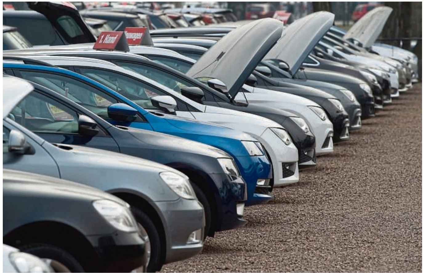
Verreint in Tristesse: Bei den Autolackierungen dominieren weiterhin unbunte Töne.

Auch das Bild auf den Straßen beeinflusst die Kaufent-