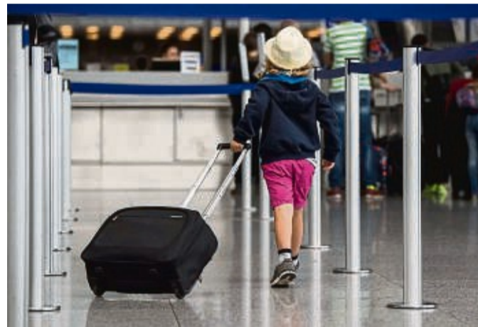
Wenn das Kind nicht mit den Sorgeberechtigten fliegt, braucht es für die Einreise eine Reisevollmacht. Diese muss in manchen Ländern sogar beglaubigt sein.

Der ADAC informiert darüber, dass in einigen Ländern, zum Beispiel in Nordmazedonien oder Griechenland, die Reisevollmacht für die Einreise zusätzlich amtlich beglaubigt sein muss. tmn