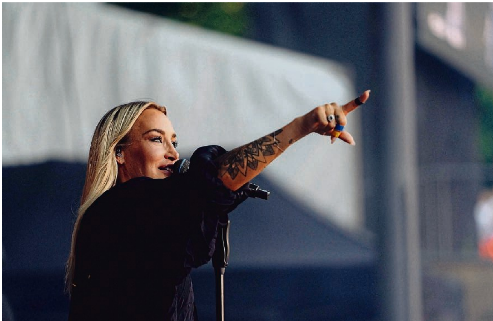
Starke Frau, starke Stimme: Sarah Connor singt am 11. Juni auf dem Friedrichsplatz in Kassel.

Ihre kraftvolle Debütsingle „Control“ hat bis heute in 10 Ländern Gold- und Platin Status erreicht, stieg bis auf Platz 18 der Pop-Radio-Charts in den USA und führte zu ihrem US-Fernsehdebüt in „The Late Late Show with James Corden“. Es folgten weitere Hits wie „Girls Like Us“, „Hold Me Like You Used To“ und der gemeinsame Song „That’s How It Goes“ mit dem Grammy-nominierten R&B Artist 6LACK. Mit ihrem Track „Daddy’s Eyes“ hat die 20-Jährige zum Ende des ver-