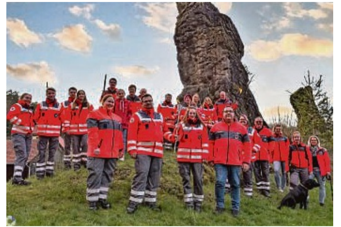
Fackellauf nach Solferino: Der DRK-Kreisverband Witzenhau- sen hat die Fackel vom DRK Eschwege am Frau-Holle-Stein in Hollstein übernommen und dann an das DRK Hofgeismar am Gut Waitzrodt übergeben.