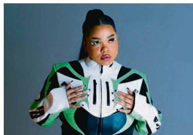
Supporting Act: Zoe Wees.