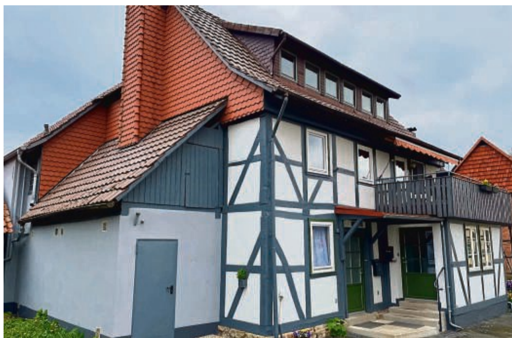
Ein schmuckes Fachwerkhaus in Hemeln ist nun ein Gasthaus.