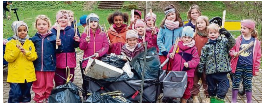
Die jüngsten Pfadfinder des Stamms Berglöwe haben eine Menge Müll in Fürstentagen eingesammelt.

Aktion des Stamms Berglöwe in Fürstentagen