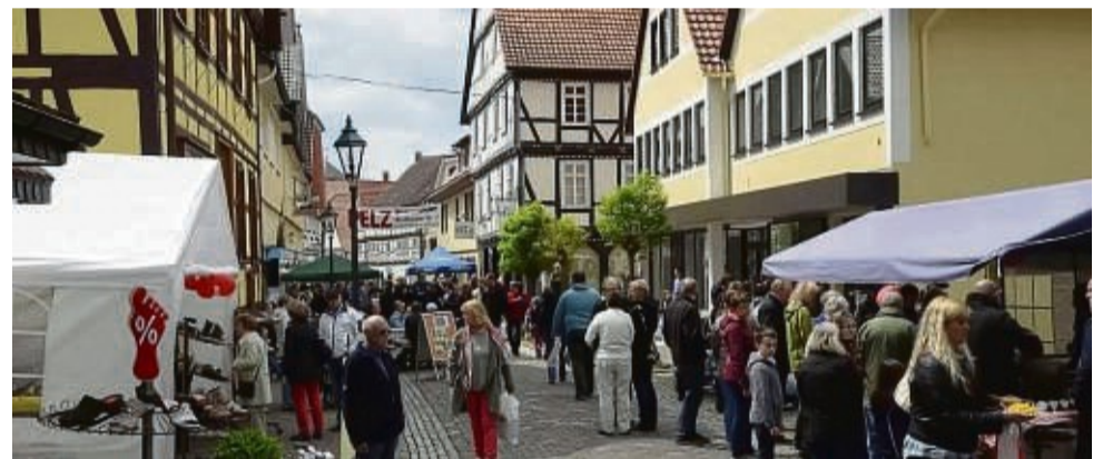
Das Johannifest in Wolfhagen lockt mit vielfältiger Unterhaltung.

Die Geschäfte sind ab 12 Uhr ebenfalls geöffnet. Speziell zum Johannifest stehen in vielen Geschäften tolle Angebote zur Verfügung.