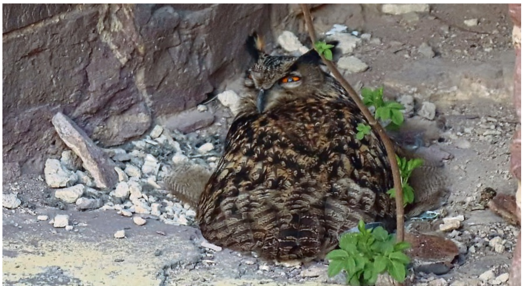
In der Burg: Kurz vor Ostern wurde das nistende Uhuweibchen im Mauerwerk der Ruine entdeckt.

Uhus sind standorttreu. Deshalb könnte es sich bei dem Weibchen in der Burg um jenes handeln, das sich