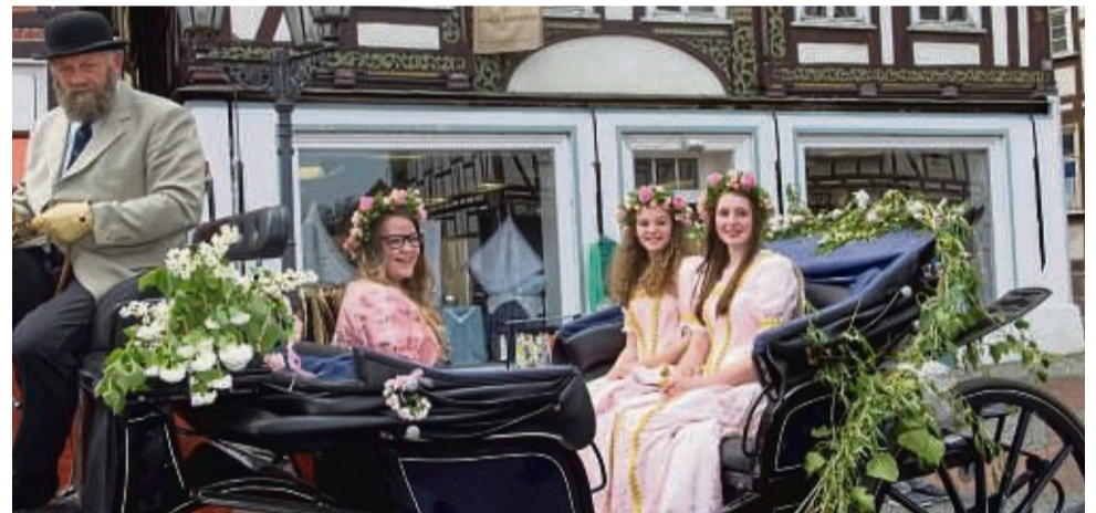
Dornröschchen mal drei: Wo, wenn nicht beim Dornröschenfest in der Dornröschchenstadt Hofgeismar wird man mit Sicherheit auf Dornröschchen treffen?

Selbstverständlich wird Dornröschchen höchstselbst auf dem Fest anwesend sein und dabei nicht nur auf Seifenblasenkünstler und Walking-Acts treffen, die in der Fußgängerzone und der Bahnhofstraße unterwegs sind, sondern auch auf „Tot-