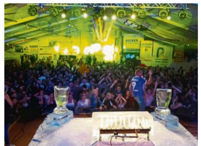
Fire and Ice-Party im Jahr 2018: Wie damals wird es in diesem Jahr auch heiße Sounds zu eiskalten Getränken und eine Wahnsinnsparty Stimmung in Isth geben.