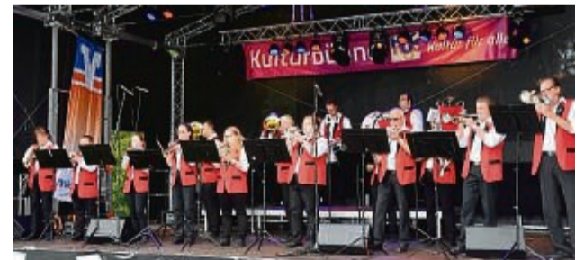
Mitreißend: Der Fanfarenzug Hofgeismar bietet von traditionellen Märschen bis hin zu modernen Schlagern und Evergreens ein breites Repertoire.