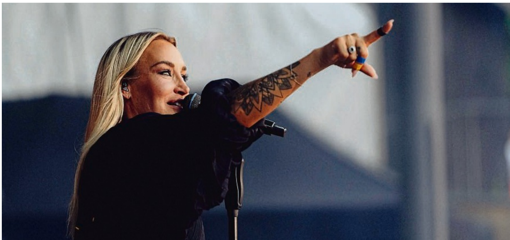
Starke Frau, starke Stimme: Sarah Connor singt am 11. Juni auf dem Friedrichsplatz in Kassel.

Ihre kraftvolle Debütsingle „Control“ hat bis heute in 10 Ländern Gold- und Platin Status erreicht, stieg bis auf Platz 18 der Pop-Radio-Charts in den USA und führte zu ihrem US-Fernsehdebüt in „The