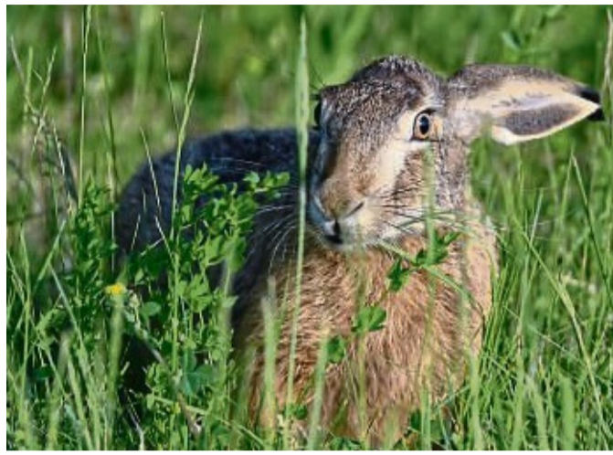
Feldhasen sind im Altkreis Wolfhagen keine Seltenheit mehr. Die Population hat sich erholt.