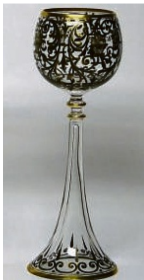
Neobarock-Römer: Entwurf von Unbekannt um 1910, ebenfalls von Harrach.