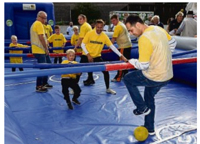
Mit Spaß dabei: Beim Menschenkicker-Turnier wird um den Dornröschchen-Cup gespielt. Es gibt attraktive Preise zu gewinnen.

Kulinarische Schmeckewöhlerchen in fester und flüssiger Form laden ganz nach dem persönlichen Gusto der Gäste zum Verzehr ein, damit alle Besucher für eine ausgiebige Shoppingtour gestärkt sind. Denn auch die Geschäfte haben an diesem Tag geöffnet und locken vielfältig mit Schnäppchen. zgi