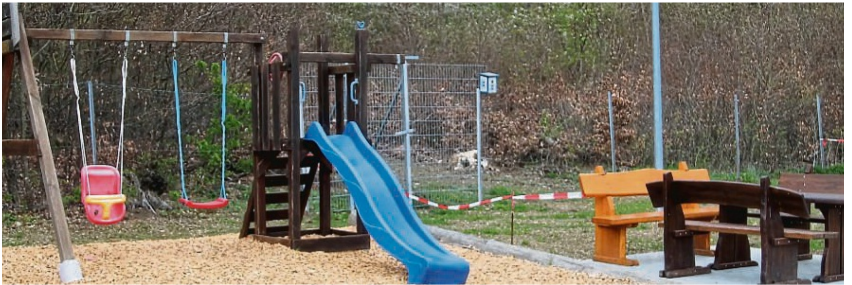
Der Fußballclub Oberelsungen setzt derzeit Bauprojekte rund um den Waldsportplatz um. Der Kinderspielplatz ist schon fertig.

Eins der Projekte, der Kinderspielplatz, ist schon abgeschlossen. Das zweite Projekt, die Pflasterung des Sportplatz-Vorgeländes samt Parkplätzen, Stellflächen für Menschen mit Behinderung sowie der breit angelegte Zugangsweg bis zum Vereinsheim sollen bis Pfingsten abgeschlossen sein. Offizielle Übergabe ist beim traditionellen Pfingstturnier des Fußballclubs.