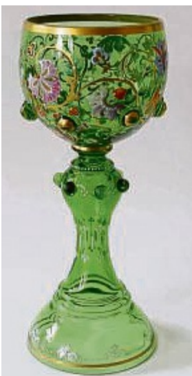
Römertglas aus der Harrach'schen Glashütte in Neuwelt/Tschechien, entstanden um 1880.