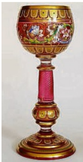
Römer-Entwurf von Unbekannt (1870), Karlsbader Kristallglas-Fabriken A.G. Ludwig Moser.