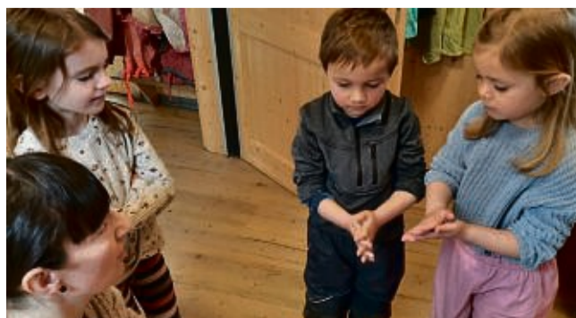
Mit wenig Aufwand große Aha-Effekte im Waldkindergarten Homberg.