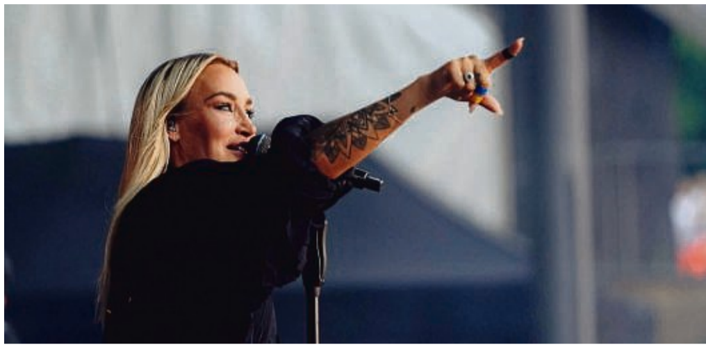
Starke Frau, starke Stimme: Sarah Connor singt am 11. Juni auf dem Friedrichsplatz in Kassel.

Dieser Sommer wird heiß: Und das gilt vor allem für Sonntag, 11. Juni, wenn Sarah Connor mit ihrem Supporting Act Zoe Wees den Friedrichsplatz in Kassel zum Kochen bringt. Unter dem Motto „Sommer Open Air 2023“ führt Sarah genau das fort, was sie ihren Fans schon im vergangenen Jahr geboten hat: Denn die Sängerin besticht mit einer unglaublich sympathischen Nahbarkeit ihren Fans gegenüber. Egal ob sie jemanden auf die Bühne holt, um mit ihm/ihr zu singen oder sie witzig und schlagfertig auf Rufe aus dem Publikum reagiert – all das ist Sarah Connor pur.