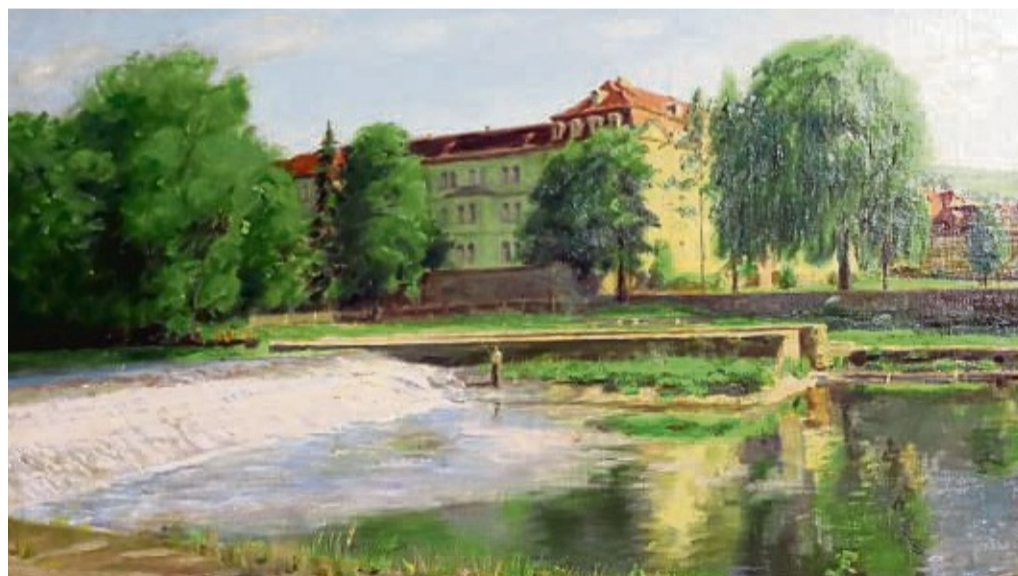
Von Landshut nach Rotenburg: Beim Entrümpeln seines Elternhauses fand ein Mann aus Landshut dieses Zirbes-Gemälde.