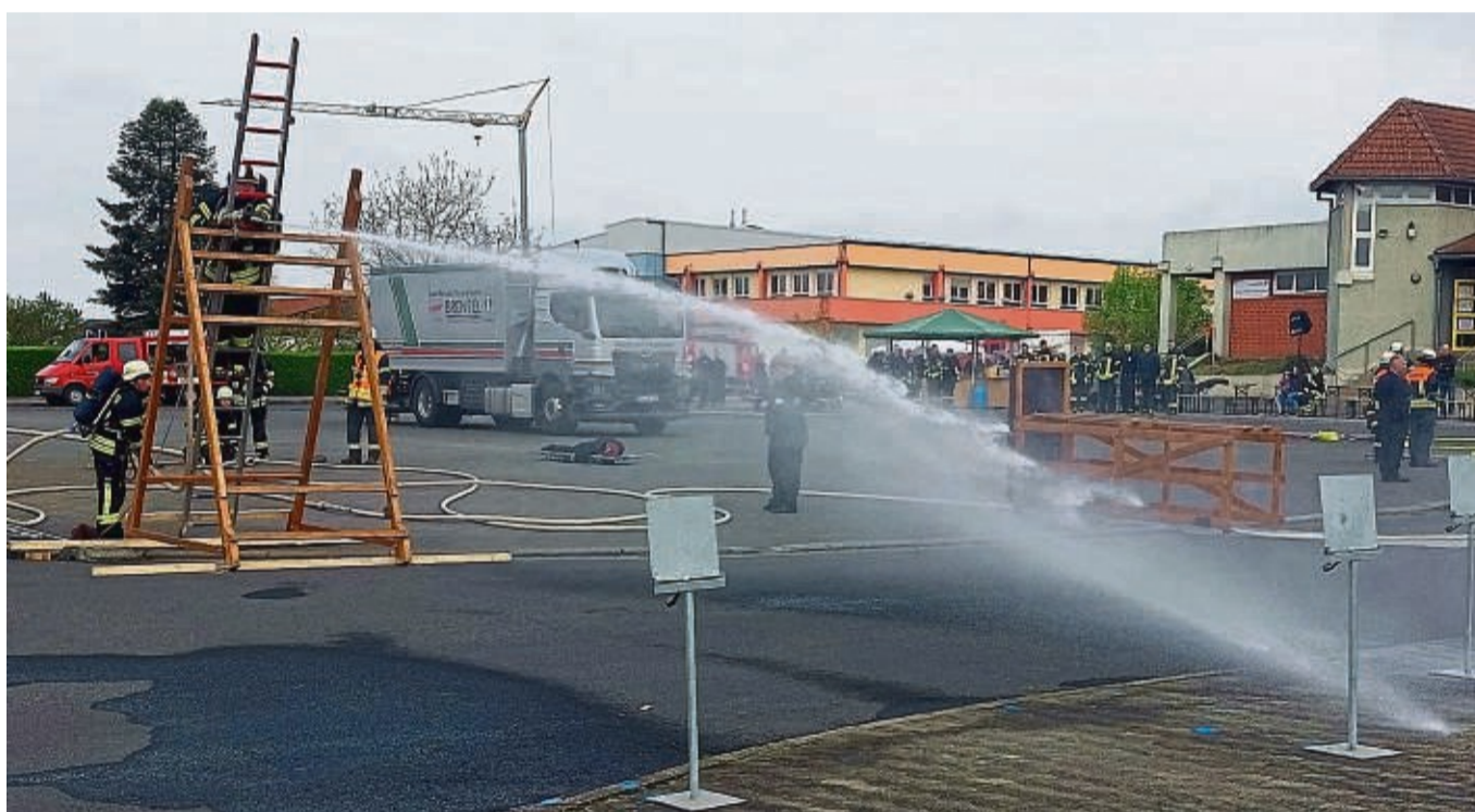
Wasser marsch: Ransbachs erste Staffel während des Wettkampfdurchlaufs. Am Ende reichte die fehlerfreie Übung für den zweiten Platz.

Am Ende trug die Feuerwehr Alheim-Erdpenhausen mit dem Traumergebnis von 100 Prozent den Sieg davon, dicht gefolgt von Hohenroda-