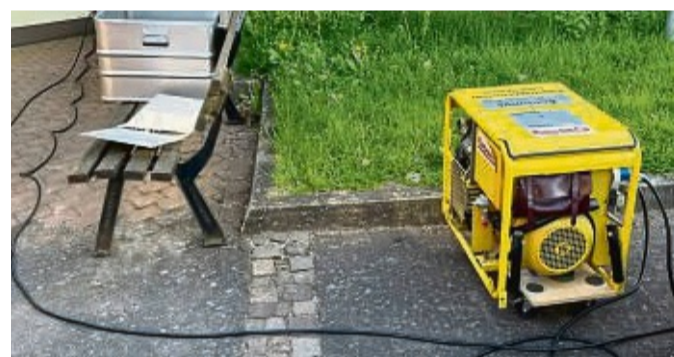
Externe Versorgung für den Ernstfall: mobile Stromerzeuger.