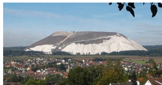
Sie ist ein unverkennbares Wahrzeichen: Die Abraumhalde ragt über NeuhoF weithin sichtbar in die Höhe.

Es sieht eine „ergebnisoffene, unabhängige und gleichwertige Prüfung aller in Frage kommenden Varianten zur Reduzierung der salzhaltigen Haldenwässer vor“. Dabei solle derjenigen Handlungsvariante der Vorzug gegeben werden, „die zur Zielerreichung geeignet ist, die geringsten negativen Auswirkungen auf den Menschen und den Naturraum in der Region hat und wirtschaftlich nicht unzumutbar ist“. Dabei sei nach