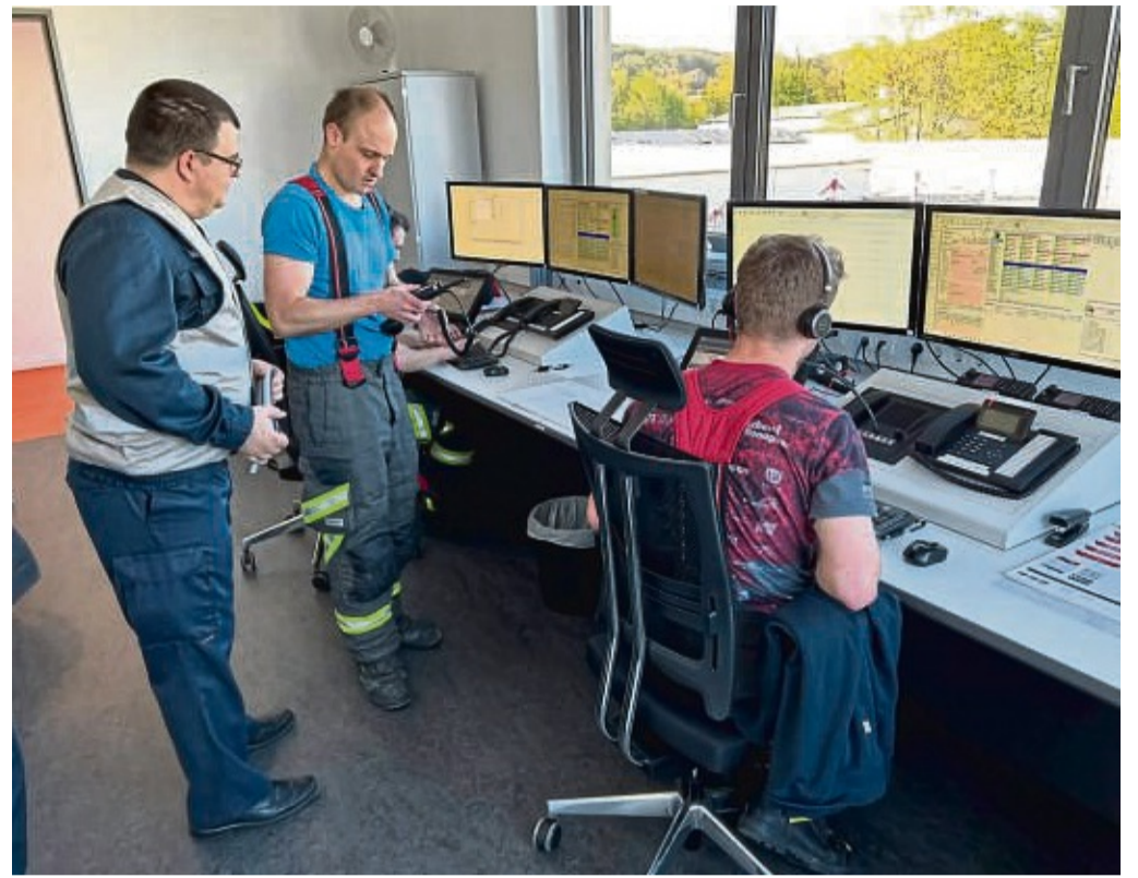
Die neue Feuerwache in der Kernstadt hat wie das Technische Rathaus durch eine Netzersatzanlage einen doppelten Boden bei Stromausfällen. Unser Foto zeigt die Stabsstelle der Feuerwehr während der Übung.

Das Technische Rathaus in Braach kann bei einem Stromausfall durch eine Netzersatzanlage zu 100 Prozent autark betrieben werden. Von dort werden daher im Notfall alle Maßnahmen koordiniert, die für die Aufrechterhaltung von wichtigen Infrastrukturen und der Versorgung der Rotenburger notwendig sind. Die Feuerwehrhäuser im Stadtgebiet dienen derweil als Anlaufstellen bei Notfällen, wenn ein