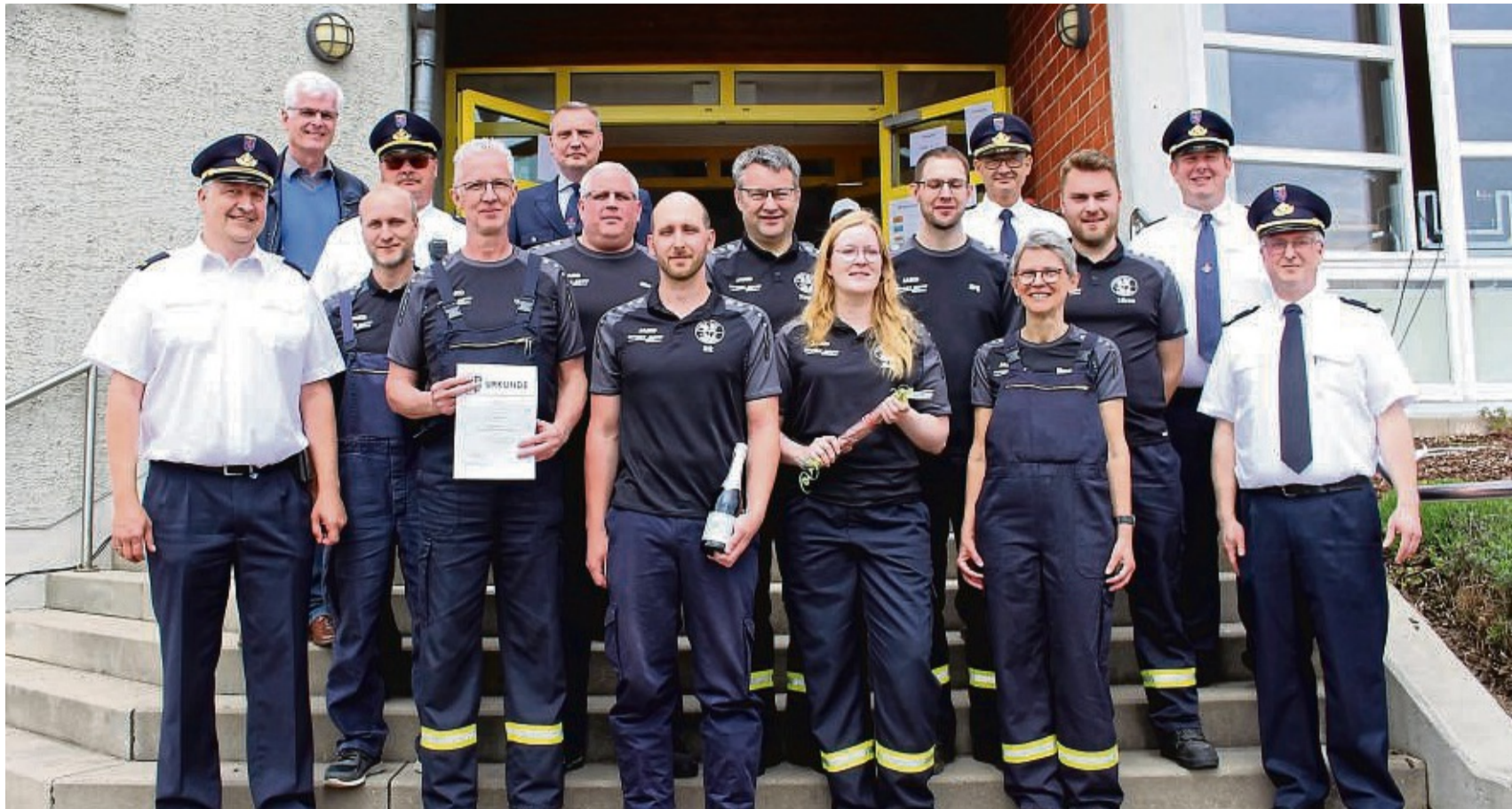
Besser geht's nicht: Die Feuerwehr Alheim-Erdpenhausen gewann mit einer 100 Prozent-Wertung die Leistungsübung der Feuerwehren.