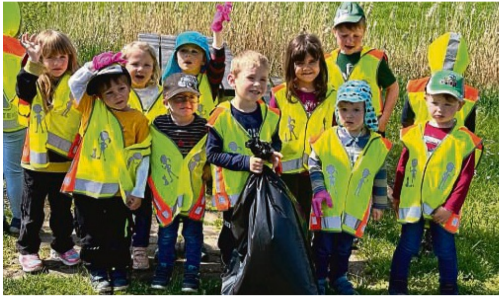
Gut ausgerüstet mit Sicherheitswesten, Handschuhen und Müllsäcken haben sich die Kinder der Spiel- und Lernschule Rabennest aus Berneburg ans Müll sammeln gemacht.

Achtlos weggeworfenen Müll haben die sechs Sontraer Kindertagesstätten in Sontra, Wichmannshausen, Ulfen und Berneburg an vielen Orten gefunden, aufgesammelt und in Säcke gepackt. Die Kinder waren voll bei der Sache, konnten aber manchmal nicht verstehen, warum so viel Müll unüberlegt weg-