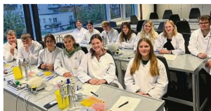
Biologen und Kriminologen: die Schüler der Bio-Leistungskurse aus Sontra im XLAB der Uni Göttingen.

isolieren. Hierzu wird mittels eines Abstrichstäbchens eine Mundschleimhautprobe entnommen und der Informationsträger durch Hinzugabe von Substanzen sowie verschiedenen Arbeitsschritten