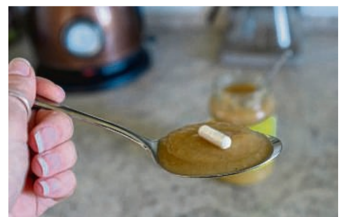
Hat jemand Schwierigkeiten beim Schlucken von Tabletten, kann ein Löffel Apfelmus helfen.

Hat der oder die pflegebedürftige Probleme, Tabletten oder Kapseln zu schlucken, können Angehörige sie auch zusammen mit einem Löffel Apfelmus oder Kartoffelbrei reichen, rät das ZQP. Und: Bei der Gabe von Medikamenten sollte der Oberkörper des Patienten oder der Patientin aufrecht sein, damit die Tablette nicht in der Speiseröhre hängen bleibt. tmn