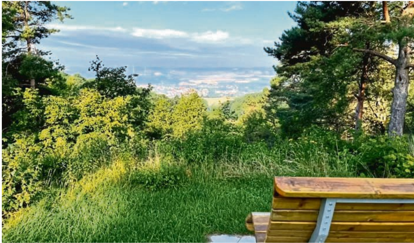
Gute Luft und Möglichkeiten zur Erholung zeichnen einen Luftkurort aus: Neben mehreren Merkmalen gehört auch eine Prüfung dazu. Die etwa 10 000 Euro an Kosten für diese möchte Sontra einsparen und lässt sein Prädikat als Luftkurort auslaufen.

Gemeinde lässt ihr Prädikat aufgrund hoher Prüfkosten auslaufen