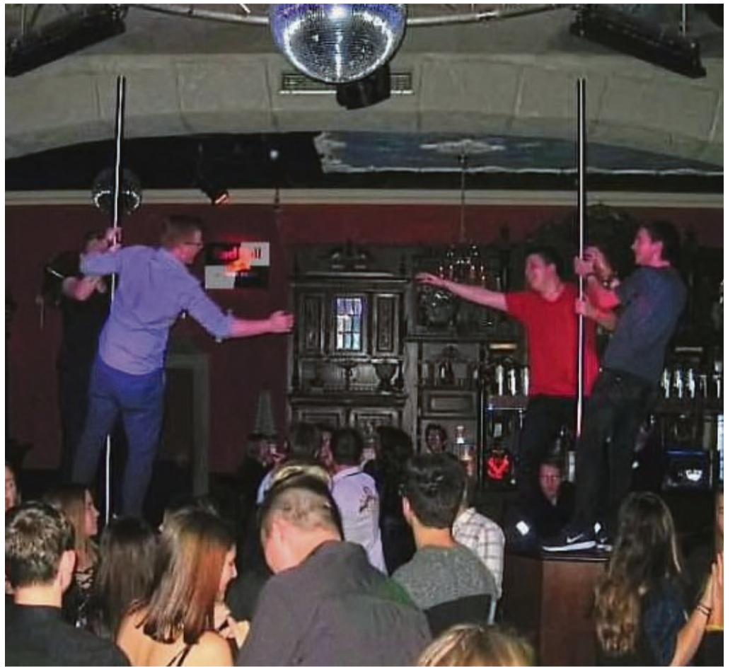
So ging es hier vor der Pandemie ab: ausgelassene Partys im Amadeus (Foto) und in der Mausefalle.

Im September will Diskothek mit neuem Konzept öffnen