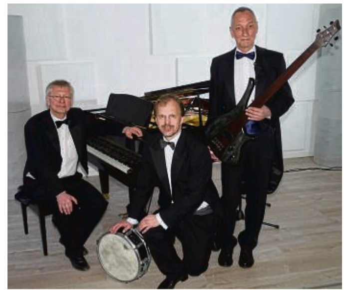
Das Thomas-Gabriel-Trio ist am Pfingstsonntag beim Volksbildungsring zum Schlosskonzert zu Gast.