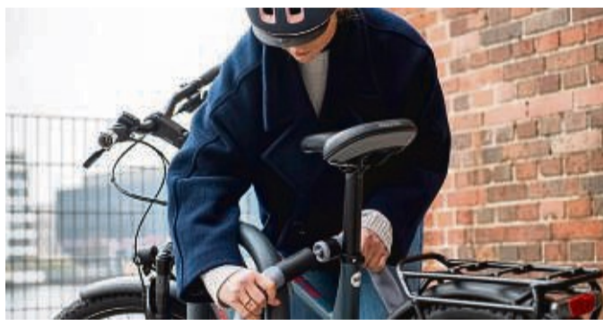
Verhindern lässt sich ein Diebstahl nicht immer, weswegen eine Versicherung ratsam sein kann.

Das A und O für einen guten Schutz gegen Fahrraddiebstahl ist ein gutes Schloss. Das können massive Stahlketten-, Falt-, Bügel- oder Panzerkabelschlösser sein. Am besten ketten Radler das Bike stets mit dem Rahmen, Vorder- und Hinterrad an einen festen Gegenstand an, raten das Landeskriminalamt und die Verbraucherzentrale Rheinland-Pfalz (VZ-RLP). So können es Diebinnen und Diebe nicht einfach wegtragen.