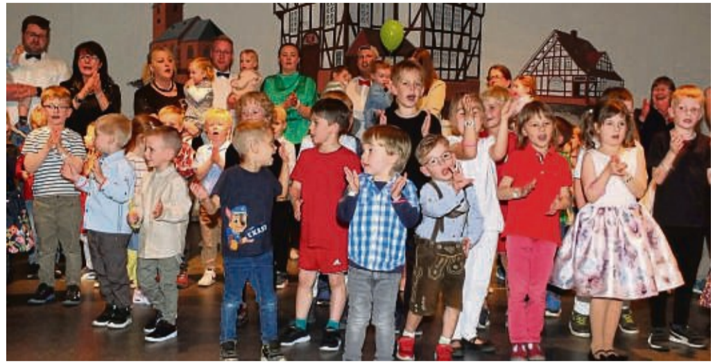
Stimmung in der Kita Rosenthal: Beim Schlusslied kamen die Kinder noch einmal alle zusammen auf die Bühne, im Hintergrund einige der Erzieherinnen und Erzieher.

Zum Lied vom Sternenhimmel trugen die Kinder blinkende Kränze auf dem Kopf, und auch wenn jeder Tag sein Gutes hat, waren sich alle einig bei „Am liebsten mag ich Wochenende“. Zum gemeinsamen Schlusslied füllte sich noch einmal die Bühne, dann